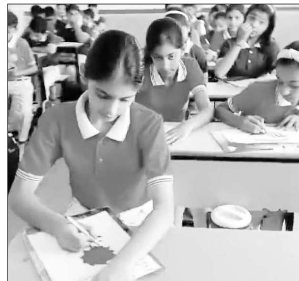
राजगढ़ खेमाणा रोड स्थित आशा देवी विद्यालय में आयोजित चित्रकला प्रतियोगिता में भाग लेते विद्यार्थी।