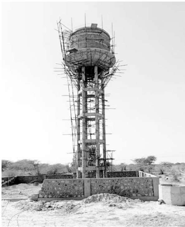
गुढ़ा में टंकी निर्माण कार्य लंबे समय से अटका पड़ा है।

टंकी निर्माण और हर घर जल योजना को अभी साकार होने में कितना वक्त लगेगा इस बारे में कोई स्पष्ट संकेत नहीं मिल रहे हैं। दूसरी ओर लोगों का कहना है कि प्यास बुझाने के लिए चार सौ रूपए टैंकर मंत्रावाकर आर्थिक बोझ उठाना पड़ रहा है। इतना पैसा खर्च करने के बावजूद भी तीन दिन पहले बुकिंग करनी पड़ती है तब जाकर टैंकर घरों तक पहुँचता है। कुएँ,