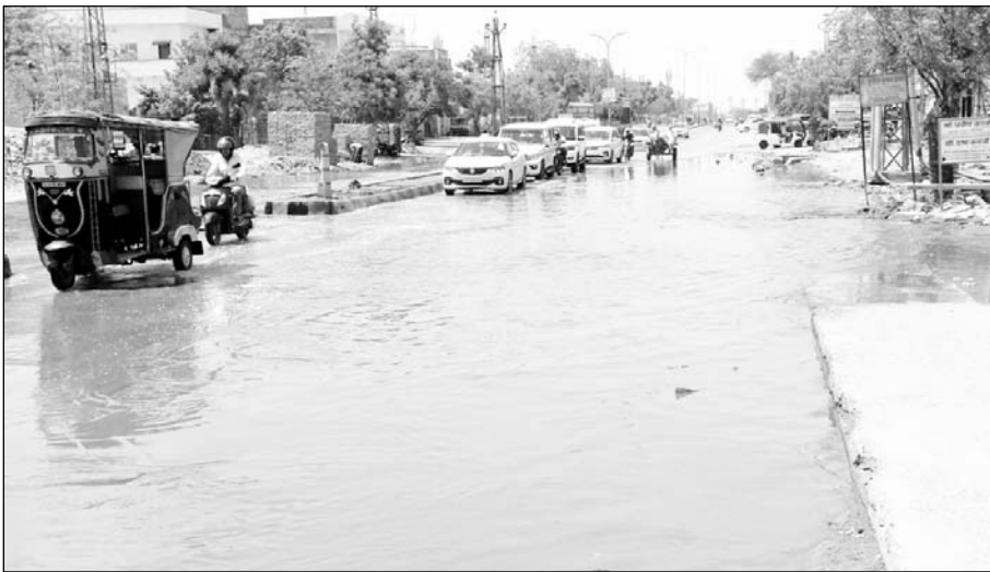
आई हॉस्पिटल के पास मुख्य सड़क पर चेंबर का गंदा पानी सड़क के चारों ओर फैल गया। जिससे पैदल चलने वाले राहगीरों व वाहन चालकों को काफी परेशानियों का सामना करना पड़ा।

आपको बता दें कि यह पंखा रोड चूँ शहर की सबसे व्यस्ततम रोड है, जो कई शहरों को जोड़ने का काम करती है। इस सड़क पर अक्सर यही स्थिति रहती है। बारिश के दिनों में तो और भी ज्यादा परेशानियों का सामना करना पड़ता है। आसपास के दुकानदारों ने बताया कि महीने में कई बार यह स्थिति बन जाती है, कि चेंबर का गंदा पानी सड़क पर आ जाता है। जिससे दुर्घटनाएँ बढ़ती आती रहती हैं। जिसके कारण ग्राहकों का भी दुकान पर आना दूँर हो जाता है। जिसके चलते काम काज प्रभावित होता है। बारिश के दिनों में इतनी अधिक मात्रा में गंदा पानी जमा होता है कि अस्पताल में आने वाले रोगियों को काफी परेशानी का सामना करना पड़ता है। पैदल रोगी यहां से निकलने की स्थिति में नहीं हो पाता है।