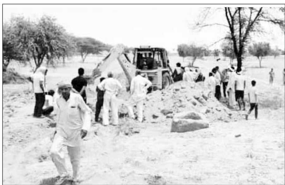
खुदाई के दौरान बड़े-बड़े पत्थर मिट्टी की बनी एक देव प्रतिमा तथा मिट्टी के बने बर्तनों के टुकड़े निकले।

सादुलपुर, (नि.सं.)। ग्राम पंचायत खेरू बडी के गांव कामाण की रोही में जमीन में दबे बड़े-बड़े पत्थर तथा मिट्टी की एक देव प्रतिमा तथा मिट्टी के बने बर्तनों के टुकड़े एवं एक पत्थर का बना पशुओं को चारा डालने का बर्तन निकला। बड़े-बड़े पत्थरों से बने कुआं जैसा गोल मकान भी मौके पर दिखाई दे रहा था, हालांकि जेसीबी मशीन से खुदाई के बाद कुआं या कोई मकान जैसा कोई मामला नजर नहीं आया। जिसके बाद ग्रामीणों ने खुदाई बंद कर दी। हर कोई उत्सुक था की जमीन में क्या दबा है क्या निकल रहा है। खुदाई के दौरान जमीन में दबी एक मिट्टी की बनी छोटी देव प्रतिमा निकली। जो भगवान बुद्ध तथा माता जी जैसी दिखाई दे रही थी। मौके पर अनेक ग्रामीणों ने जहां वर्षों पहले आबाद बस्ती होने की संभावना जताई तो अन्य लोगों ने पानी का कुआं या फिर कोई मंदिर अथवा मकान होना बताया। लेकिन जेसीबी मशीन से खुदाई के बाद सिर्फ बड़े-बड़े पत्थर ही निकले। ना कुआं और ना ही कोई मंदिर जैसा मकान निकला। लेकिन वर्षों पहले निश्चित रूप से मानव बस्ती रही होगी। ऐसा अनुमान ग्रामीण लगाते रहे। लगभग दो