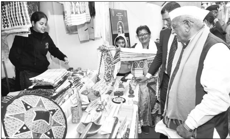
राज्यपाल हरिभाऊ बागडे ने सोमवार शाम को जवाहर कला केंद्र में सरस राजसखी राष्ट्रीय मेले में स्टॉल्स का अवलोकन किया।

जयपुर। राज्यपाल हरिभाऊ बागडे सोमवार शाम को राष्ट्रीय मेला 2024 पहुंचे। उन्होंने यहां देशभर से जवाहर कला केंद्र में आयोजित "सरस राजसखी आएं महिला स्वयं सहायता समूह की प्रतिनिधियों से