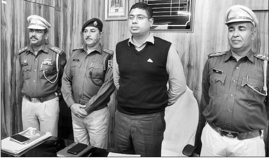
50 लाख की बीमा राशि हड़पने के लिए दो बहनों ने प्रेमी संग की गई जघन्य हत्या का राज फाश करते पुलिस अधीक्षक व अन्य अधिकारी।

बांसवाड़ा, (निर्सं) पति शराबी, कोई काम धन्धा नहीं ऐसे में परेशान पत्नी ने अपनी बहन और प्रेमी से मिलकर ऐसी साजिश रची की सुनकर दिल दहल जाए पति को रास्ते से हटाने के साथ भारी रकम लेने की नियत से बीमा करवाया गया और प्रेमी के साथ मिलकर पति की जघन्य हत्या कर दी।