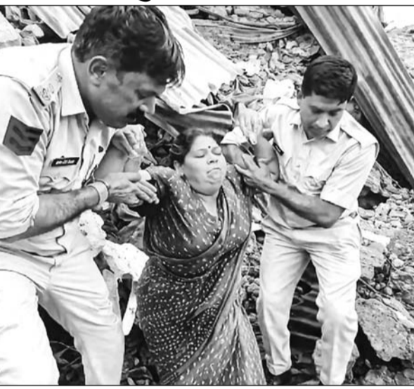
ब्रह्मपुरी इलाके में मलबे में दबी परिवार को पुलिसकर्मियों को सुरक्षित बाहर निकालकर जान बचाई।

जयपुर । ब्रह्मपुरी इलाके में शुकुवार शाम का मंजर किसी डरावने सपने से कम नहीं था। तेज अंधड़ और बारिश ने एक टीन शेड वाले घर को पलभर में मलबे में बदल दिया था। मलबे के नीचे दबी कराहती व मदद को पुकारती एक महिला... ऊपर बिखरे टोंक के टुकड़े... और चारों तरफ फैले टूटे बिजली के तार, जिनमें दौड़ रहा था करंट। हर सेकंड खतरा बढ़त हा था, हर पल मौत करीब आ रही थी।