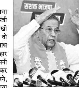
सांसद घनश्याम तिवाड़ी

जयपुर । भाजपा के वरिष्ठ नेता एवं राज्यसभा सांसद घनश्याम तिवाड़ी ने पूर्व मुख्यमंत्री अशोक गहलोत के इंतजार शास्त्र पर तीखी प्रतिक्रिया देते हुए कहा कि भारत में शास्त्र तो 64 ही हुए हैं, शास्त्र जैसे पवित्र शब्द के साथ इंतजार जोड़ना नहीं चाहिए। वे चाहे तो इजहार नामा कर सकते हैं। गहलोत हारने के बाद अपनी उपेक्षा से पीड़ित होकर हताशा का इजहार कर सकते हैं। गहलोत जब-जब मुख्यमंत्री बने, उसके बाद उन्होंने पार्टी को रसातल में पहुंचाया और सत्ता भाजपा के पास आई। इसके चलते कांग्रेस ने तत्काल उन्हें साइड लाइन कर दिया। कांग्रेस पार्टी को रसातल में पहुंचाने वाले गहलोत साहब को दिल्ली में पायलट और राजस्थान में डोटारास के चलते तबज्जो नहीं दी जा रही, ऐसे में वे सोशल मीडिया पर अपने कार्यों का इजहार कर रहे हैं। तिवाड़ी ने पूर्व मुख्यमंत्री गहलोत के कार्यकाल पर कटाक्ष करते हुए कहा कि "फूलां बाई फूलगी, गेल का दिन भूलगी" लोकोक्ति अशोक गहलोत पर चरितार्थ हो रही है। भाजपा के वरिष्ठ नेता घनश्याम तिवाड़ ने कहा कि पूर्व मुख्यमंत्री गहलोत अपना