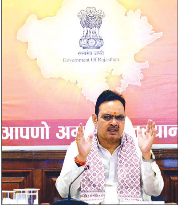
मुख्यमंत्री भजनलाल शर्मा

मुख्यमंत्री ने स्वायत्त शासन विभाग को आशुषि प्रबंधन को सुदृढ़ करने के लिए एकीकृत कंट्रोल रूम