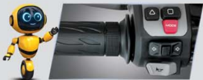
राइड बाय वायर 3 राइड मोड्स