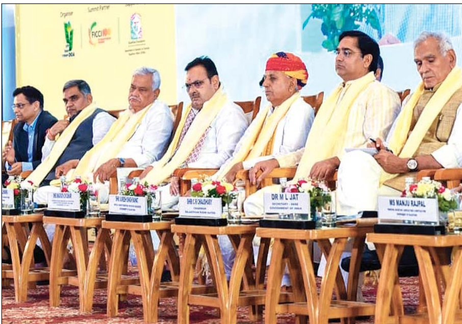
मुख्यमंत्री भजनलाल शर्मा ने गुरुवार को नई दिल्ली में आयोजित ग्राम-2026 इन्वेस्टर मीट को संबोधित किया।

मुख्यमंत्री भजनलाल शर्मा ने कहा कि बाजरा, सरसों, तिलहन, जौ, ग्वार, ईसबगोल व जौरे के उत्पादन में राजस्थान का देश में प्रथम स्थान है। दलहन उत्पादन के लिए झालावाड़ व टोंक को मॉडल जिले के रूप में विकसित किया जा रहा है।