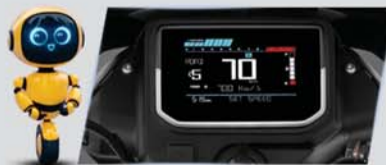
मल्टीकलर डिस्प्ले 60+ फीचर्स