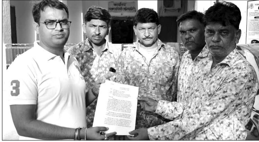
माण्डलगढ़ में समाजजनों ने एसडीएम को मुख्यमंत्री के नाम ज्ञापन दिया।