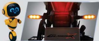
पैनिंक ब्रेक अलर्ट