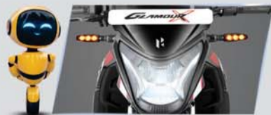
ऑल LED सेटअप