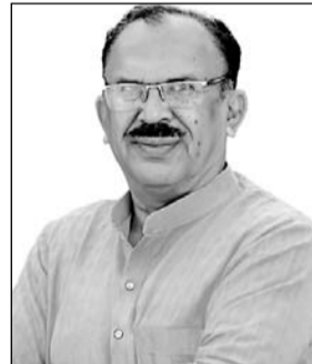
राजस्थान विधानसभा अध्यक्ष वासुदेव देवनानी

सिडनी (ऑस्ट्रेलिया) में आयोजित राष्ट्र मण्डल संसदीय संघ के 67वें सम्मेलन में विधानसभा अध्यक्ष वासुदेव देवनानी ने शिरकत की