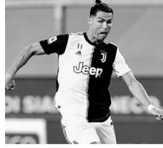
की तरफ से पहला गोल किया। इसके बाद रोनार्डो ने आधे घंटे के अंतराल के ठीक बाद

रियाद, 6 नवम्बर क्रिस्टियानो रोनाल्डो के गोल की मदद से अल नासर ने एएफसी चैंपियंस लीग फुटबॉल प्रतियोगिता के प्लेऑफ वर्ग में संयुक्त अरब एमीरात के क्लब और गत चैंपियन अल ऐन को 5-1 से हराकर 12 टीमों की तालिका में शीर्ष तीन में जगह बनाई। सऊदी अरब के क्लब अल नासर के चार मैचों में 10 अंक हैं तथा वह स्थानीय प्रतिद्वंद्वियों अल हिलाल और अल अहली से दो अंक पीछे हैं। इन दोनों ने अभी तक अपने चारों मैच जीते हैं। एंडरसन तालिस्का ने खेल शुरू होने के पांच मिनट बाद ही अल नासर