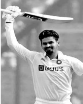
182 रनों पर 142 रन बनाए थे। आखिरी बार उन्होंने 2021 में न्यूजीलैंड के खिलाफ कानपुर टेस्ट में शतक लगाया था।

नई दिल्ली, 6 नवम्बर भारतीय बल्लेबाज श्रेयस अय्यर ने रणजी टूर्नामेंट 2024-25 में शतक ठोका है। अय्यर ने ओडिशा के खिलाफ मुंबई के शरद पवार क्रिकेट एकेडमी स्टेडियम में संचुरी लगाई है। अय्यर भारतीय टेस्ट टीम से बाहर चल रहे हैं, उन्हें खराब फॉर्म के चलते सेलेक्टर्स ने बाहर का रास्ता दिखाया था। हालांकि, अब चयनकर्ता उनपर नजर बनाए हुए हैं। हाल ही में अय्यर ने प्रथम श्रेणी में 3 साल बाद शतक का सूखा खत्म किया था। उन्होंने रणजी टूर्नामेंट में महाराष्ट्र के खिलाफ