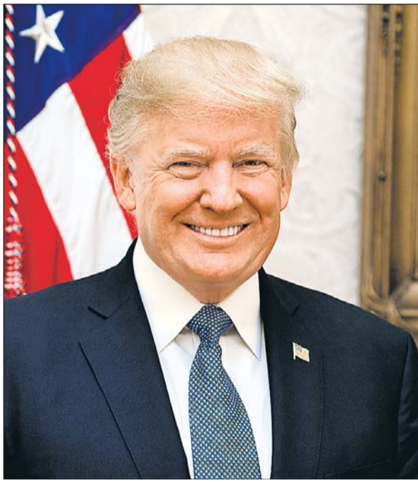
डॉनल्ड ट्रम्प की जीत ने अमेरिका के बुद्धिजीवियों व पत्रकारों को निरुत्तर कर दिया।

गए। डॉनल्ड ट्रम्प ने, बहुते इमिग्रेशन को लेकर औसत अमेरिकी नागरिक के भय का लाभ उठाया। जिसके कारण लोगों में आर्थिक असुरक्षा की भावना