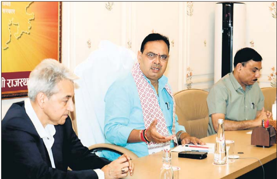
मुख्यमंत्री भजनलाल शर्मा ने राज्य सरकार की पहली वर्षगांठ पर जनता को दी जाने वाली सौगातों की वरिष्ठ अधिकारियों के साथ बैठक में समीक्षा की।

राज्य सरकार की पहली वर्षगांठ पर मुख्यमंत्री ने प्रदेश वासियों के लिए बड़ी सौगातों की समीक्षा की