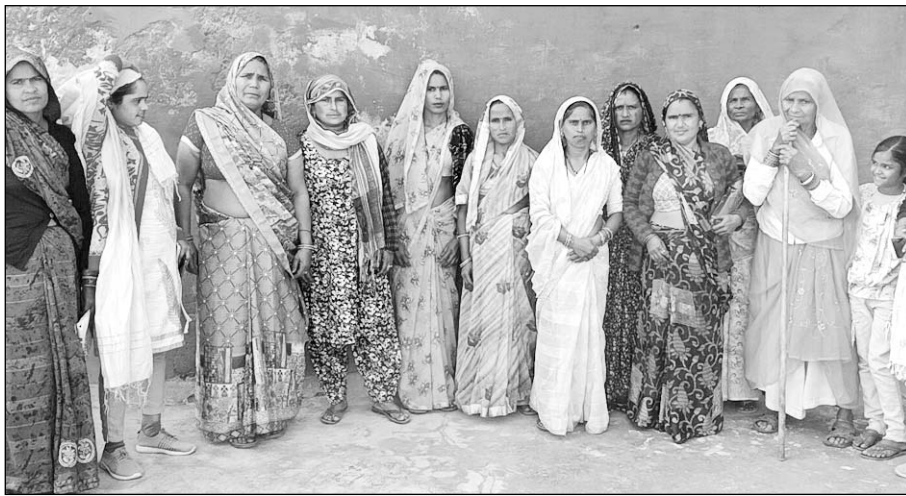
वार्ड नंबर 8 भरतपुर की महिलाओं ने कलेक्टर से पानी की समस्या को लेकर फरियाद लगाई।

भरतपुर (नि.स.)। सोशल वेलफेयर एंड मानव विकास संस्थान भरतपुर द्वारा भरतपुर के सेवर थाना इलाके के इंदिरा आवास कॉलोनी अड्डा वार्ड नंबर 8 भरतपुर की महिलाओं की परेशानी को लेकर जिला कलेक्टर से फरियाद लगाई गई की इंदिरा आवास अड्डा कॉलोनी वार्ड नंबर 8 में पीने का पानी नहीं मिलने से काफी परेशानी महिलाओं को उठानी पड़ रही है क्योंकि कॉलोनी के पास बयाना