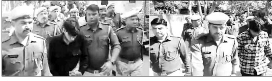
ब्लैकमेल कांड के आरोपियों को कोर्ट में पेश किया।