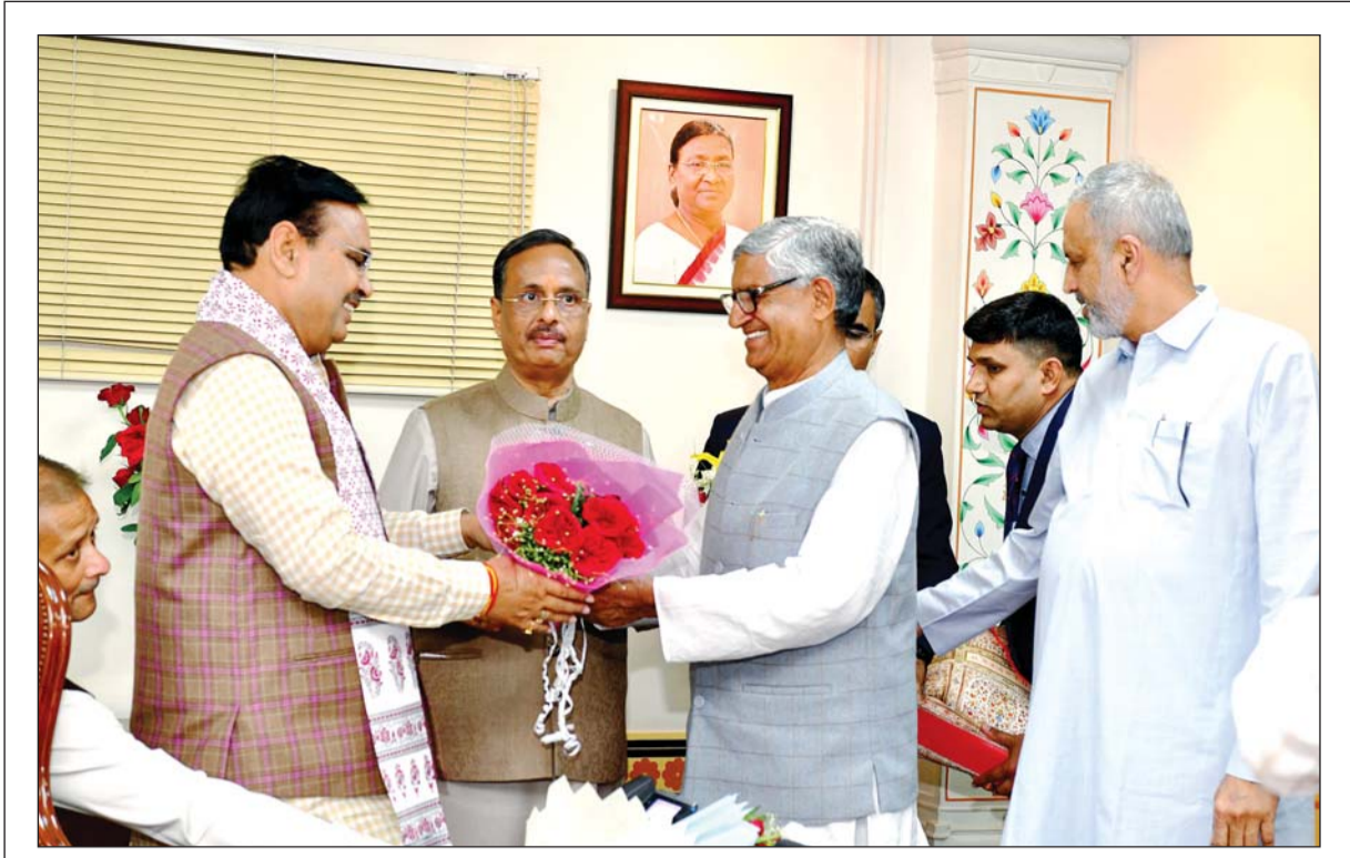
मुख्यमंत्री भजनलाल शर्मा से मंगलवार को विधानसभा में संसदीय राजभाषा समिति गृह मंत्रालय की प्रथम उप समिति के संयोजक और सांसद डॉ. दिनेश शर्मा एवं समिति के सदस्यों ने मुलाकात की। डॉ. दिनेश शर्मा उत्तर प्रदेश से राज्यसभा सांसद हैं और 2017 से 2022 तक उत्तर प्रदेश के उपमुख्यमंत्री रहे हैं। डॉ. दिनेश शर्मा के नेतृत्व वाली उपसमिति विभिन्न सरकारी कार्यालयों में हिन्दी कार्य संचालन का निरीक्षण करती है।