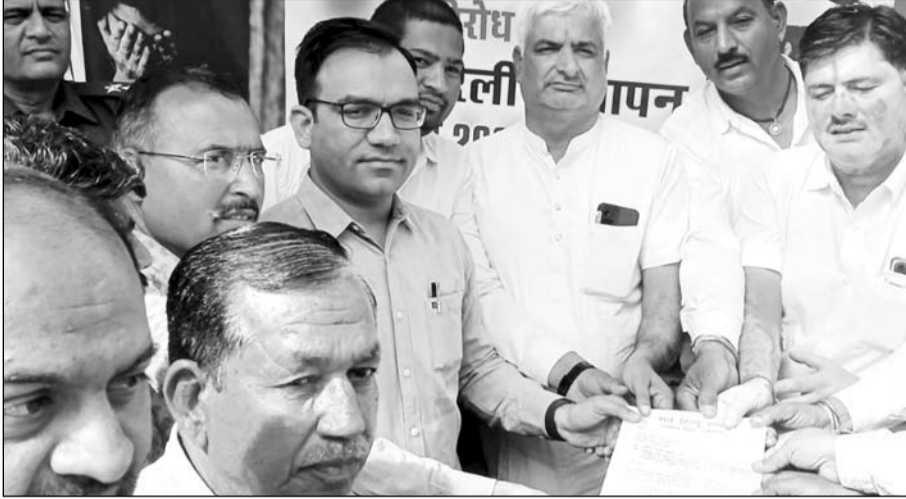
बिजयनगर ब्लैकमेल कांड के विरोध में सकल हिंदू समाज ने आरोपियों को कड़ी सजा की मांग की