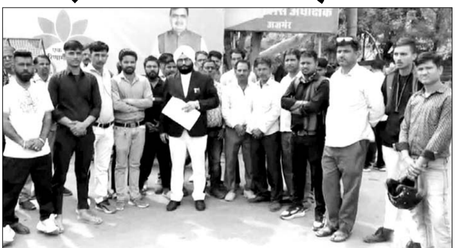
कलेक्ट्रेट पर पीड़ित लोगों ने प्रदर्शन किया।