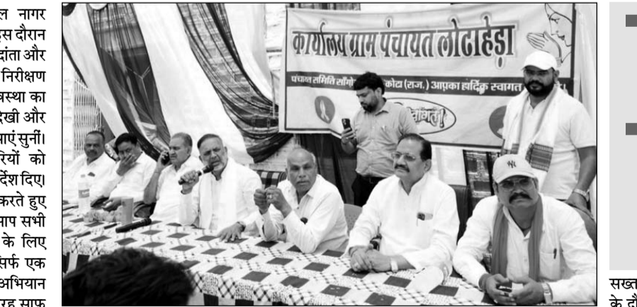
ऊर्जा मंत्री हीरालाल नागर ने कनवास क्षेत्र के लोढ़ाहड़ा में जनसुनवाई की।

कोटा, (निस)। ऊर्जा मंत्री हीरालाल नागर रविवार को कनवास क्षेत्र के दौर पर रहे। इस दौरान उन्होंने क्षेत्र के मामोरे, लोढ़ाहड़ा, धूलेट, दांता और बांय्याहेड़ी सहित कई गांवों का दौरा कर निरीक्षण किया। मंत्री नागर ने गांवों में सफाई व्यवस्था का जायजा लिया, ग्रामीण रास्तों की स्थिति देखी और ग्रामीणों के बीच बैठकर उनको जन समस्याएं सुनीं। उन्होंने मौके पर ही मौजूद अधिकारियों को समस्याओं के त्वरित निस्तारण के कड़े निर्देश दिए। ग्रामीणों को स्वच्छता के प्रति जागरूक करते हुए ऊर्जा मंत्री हीरालाल नागर ने कहा कि आप सभी केवल 8 दिन अपने गांव की सफाई के लिए समर्पित कर दें। इसके बाद महीने में सिर्फ एक दिन हम सभी मिलकर एक बड़ा सफाई अभियान चलाएंगे। ऐसा करने से हमारे गांव पूरी तरह साफ हो जाएंगे और कचरे का नामोनिशान मिट जाएगा। यह काम अकेले सरकार का नहीं, बल्कि जनसहभागिता से ही संभव है।