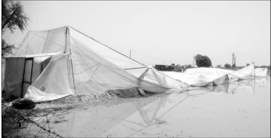
निवाड़ में आये तेज अंधड़ से नेट हाउस गिर गया।

निवाड़, (निस)। उपखण्ड मुख्यालय सहित क्षेत्र के अनेक गांवों में शनिवार की देर शाम आए भीषण अंधड़ से सैकड़ों पेड़ व विद्युत पोल धराशाही हो गए, जिससे पिछले दो दिन से ग्रामीण इलाकों में बिजली पूरी तरह गुल है और लोग अंधेरे में रहने को मजबूर हैं। बिजली संकट के कारण ग्रामीणों को भारी परेशानियों का सामना करना पड़ रहा है। तेज अंधड़ का सबसे ज्यादा असर ग्राम पंचायत सुनारा के दर्जनों गांवों में देखने को मिला, जहां पेड़ों व बिजली के खंभों के टूटने के साथ-साथ लोगों के घरों के चहर और छप्पर तक उड़ गए।