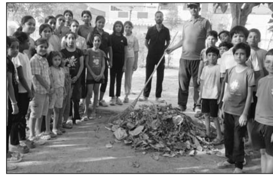
योग एवं खेलकूद संस्कार शिविर में बच्चों ने दीनदयाल पार्क में श्रमदान कर सफाई की।