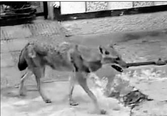
भीलवाड़ा की संजय कॉलोनी में सियार आने से दहशत फैल गई।