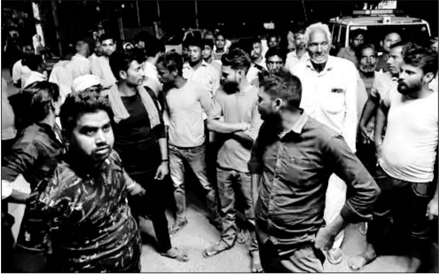
युवक के परिजन और ग्रामीणों ने अलवर सदर थाने के सामने घेराव किया।

मृतक के परिजन और ग्रामीणों ने रात को ही थाने पर हंगामा कर दिया।