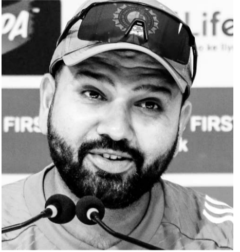
यही कारण है कि भारत द्वारा तेज गेंदबाजों मयंक यादव, हर्षित राणा, नितीश कुमार रेड्डी और प्रसिद्ध कृष्णा को

रोहित ने यहां न्यूजीलैंड के खिलाफ पहले टेस्ट की पूर्व संंध्या पर कहा, "जब बल्लेबाजी की बात आती है तो बहुत सारे विकल्प हैं। हम गेंदबाजी में भी यही करना चाहते हैं। हम बेंच स्ट्रेंथ बनाना चाहते हैं जहां अगर कल किसी को कुछ भी होता है तो हमें चिंता नहीं हो।" उन्होंने कहा, "हम कुछ खिलाड़ियों पर बहुत अधिक निर्भर नहीं रहना चाहते। ऐसा करना सही नहीं है। हम भविष्य को देखते हुए यह सुनिश्चित करने की कोशिश करना चाहते हैं कि हमें सही खिलाड़ी मिलें।"