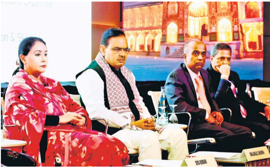
राजस्थान के मुख्यमंत्री भजनलाल ने जर्मनी यात्रा के दौरान जर्मनी के कारोबारियों से मुलाकात की। इस दौरान राज्य की उपमुख्यमंत्री दिया कुमारी भी उनके साथ थीं।

म्यूनिख में दूसरे दिन एल्बैट्रॉस, पार्टैक्स, एनवी, वेउली, टेक्निक्स और इगो शिमट्ज के साथ एम.ओ.यू.