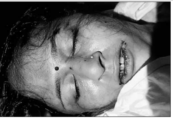
मृतक महिला के शरीर पर चोट के कई निशान थे।