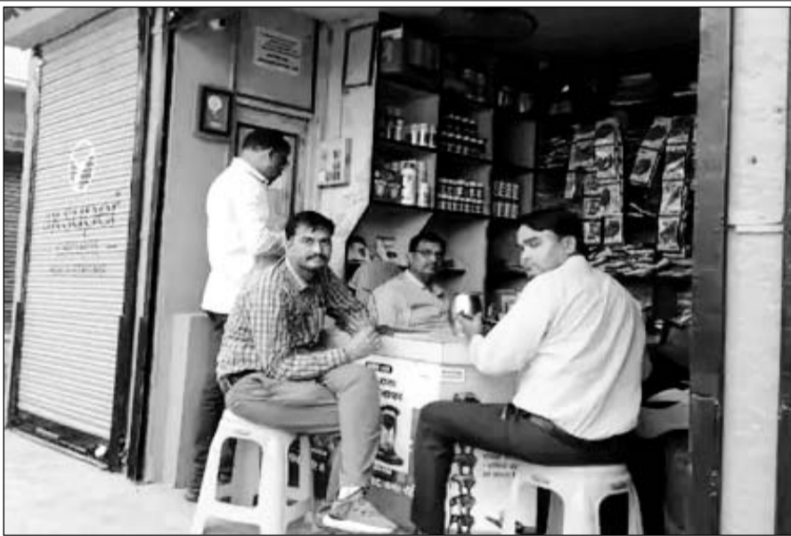
गंगापूर सिटी में खाद बीज की दुकानों का कृषि अधिकारियों की टीम ने निरीक्षण किया।

कृषि विभाग की टीम ने खाद-बीज की दुकानों पर निरीक्षण के दौरान खाद बीज के नमूने लिए