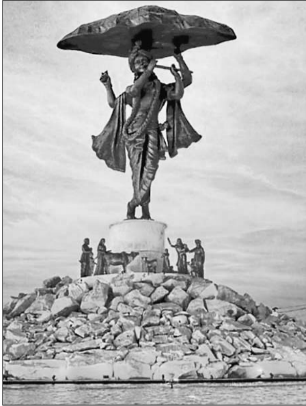
राजस्थान के ब्रज क्षेत्र में विकसित होने वाली पर्यटन नगरी में गोवर्धनधारी श्रीकृष्ण की 100 फीट ऊंची प्रतिमा स्थापित की जाएगी। आर्किटेक्ट अनूप बरतारिया ने पर्यटन नगरी के प्रेजेंटेशन के दौरान श्रीकृष्ण की वह तस्वीर प्रदर्शित की जिसके आधार पर विशाल प्रतिमा बनाई जाएगी।

डवलपमेंट भी किया जाएगा। राज्य सरकार, अप्सरा कुंड और नवल कुंड के मूल वैभव को पुनः लौटाने के साथ-साथ प्रसिद्ध श्रीनाथ जी मंदिर और नृसिंह अवतार मंदिर का भी पारंपरिक स्थापत्य कला के अनुसार सौंदर्यीकरण करेगा। पूरी तरह पर्यावरण अनुकूल इस परियोजना में नेशनल ग्रीन ट्रिब्यूनल गाइडलाइन्स का पूरी तरह से पालन किया जाएगा। परियोजना पूरी होने से राजस्थान के ब्रज क्षेत्र में भी देशी-विदेशी श्रद्धालुओं की आवक में भारी बढ़ोतरी होने का अनुमान है, जिसके कारण बढ़ने वाली आर्थिक गतिविधियों का फायदा स्थानीय लोगों को भी मिलेगा।