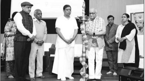
राष्ट्रीय आयुर्वेद विद्यापीठ की ओर से सोमवार को 6 दिवसीय आवासीय प्रशिक्षण कार्यक्रम 'चरकायतन' का शुभारम्भ हुआ।