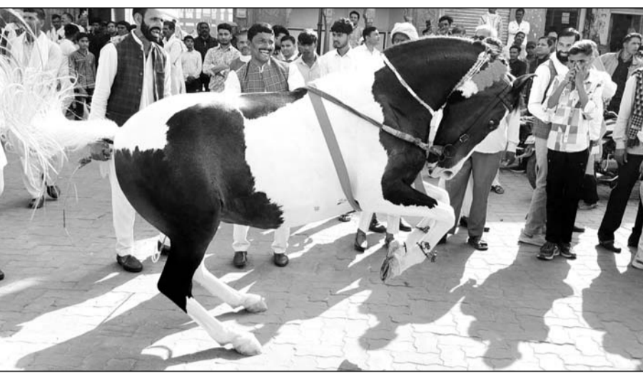
भगवान देवनारायण की रथयात्रा निकाली।