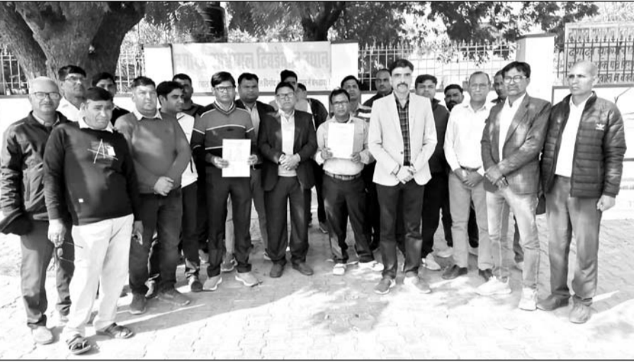
पांच सूत्री मांगों को लेकर आईटीआई संचालकों ने नारेबाजी की।