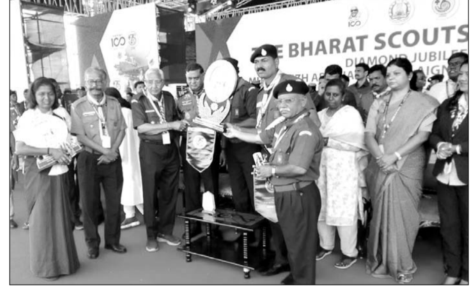
तमिलनाडु के शिक्षा मंत्री ने राजस्थान दल के पदाधिकारी को सर्वोच्च अवार्ड की शील्ड एवं पताकाएं प्रदान कर सम्मानित किया

प्रदर्शन से जंबूरी की सर्वोच्च शील्ड अपने नाम करते हुए एक बार फिर राजस्थान का परचम फहराया। राजस्थान के दल ने डायमंड जुबली जंबूरी में स्काउट विभाग की प्रथम स्थान की नेशनल कमिश्नर स्काउट शील्ड, गाइड विभाग की प्रथम स्थान की नेशनल कमिश्नर गाइड शील्ड एवं ओवरऑल प्रदर्शन में प्रथम स्थान प्राप्त करते हुए चीफ नेशनल कमिश्नर अवार्ड