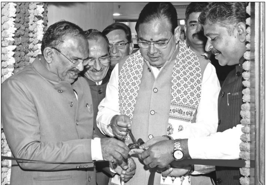
मुख्यमंत्री भजन लाल शर्मा व स्पीकर वासुदेव देवनानी ने विधानसभा में नेवा सेवा केन्द्र का उद्घाटन किया।

ई-लर्निंग कम ई-फैसिलेशन सेन्टर के रूप में कार्य करेगा नेवा सेवा केन्द्र : देवनानी