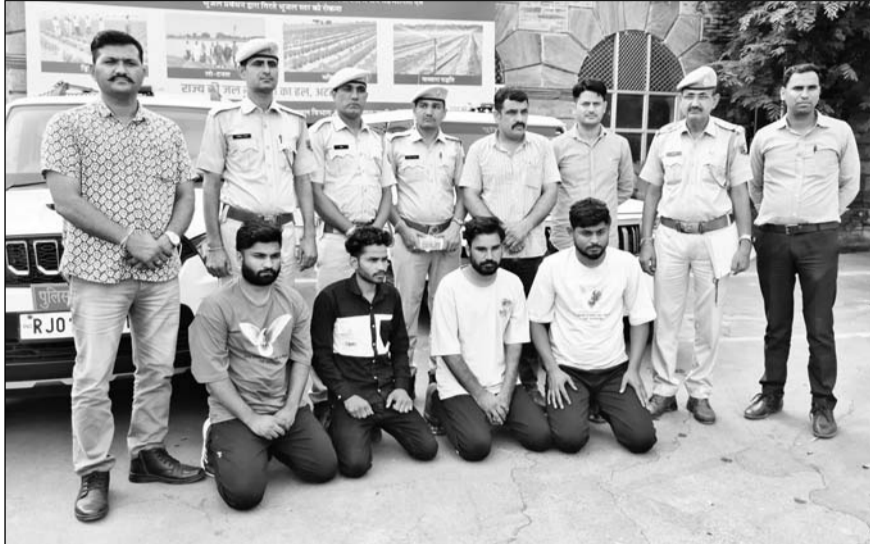
गांधीनगर थाना क्षेत्र में हुई फायरिंग मामले में चार आरोपियों को गिरफ्तार किया।