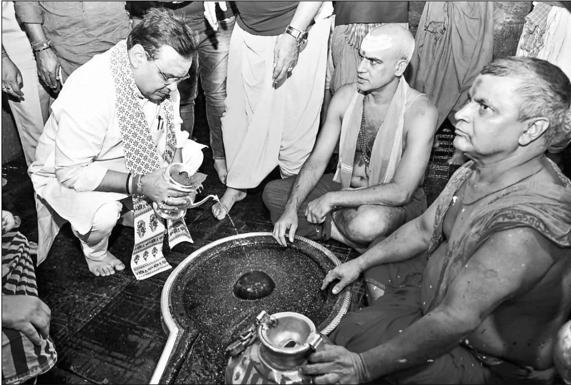
मुख्यमंत्री भजनलाल शर्मा ने अपनी झारखंड यात्रा के दौरान देवघर में वैद्यनाथ मंदिर में पूजा अर्चना की।