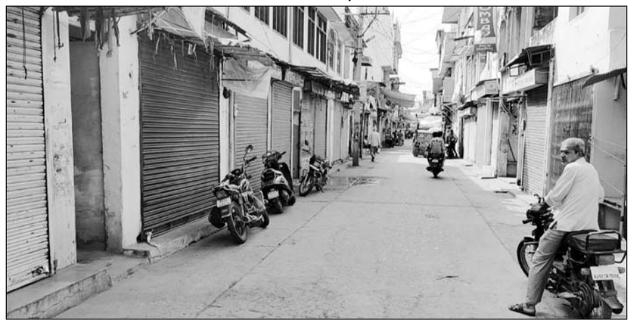
बंद के दौरान केकड़ी के बाजारों में सन्नटा पसरा रहा।

बार एसोसिएशन ने रविवार को भी केकड़ी बंद का आव्हान किया