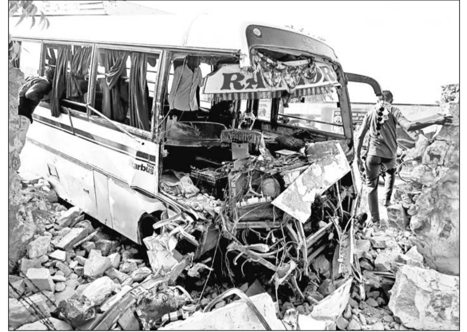
सुजानगढ़ शहर के छापार रोड पर दीवार से टकराई निजी बस।

घायलों को कैम्पर व एंबुलेंस से राजकीय बगड़िया उप जिला अस्पताल लाया गया