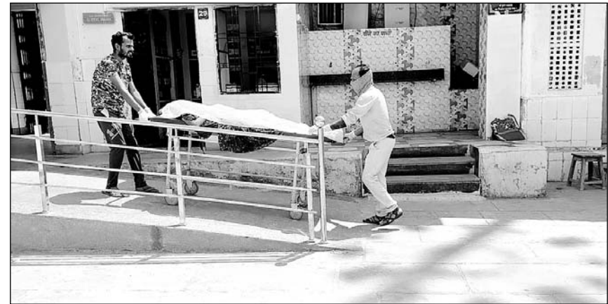
जहाजपुर थाना पुलिस ने शवों को हॉस्पिटल की मोर्चरी में रखवाया।

बाइक पर मां-बेटी व पिता देवली के राजनगर से भीलवाड़ा जा रहे थे