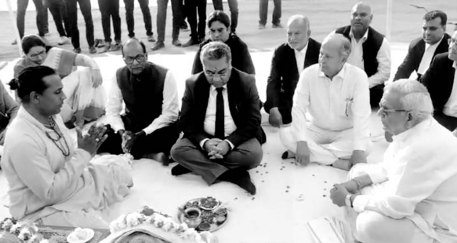
मुख्य न्यायाधीश एम.एम. श्रीवास्तव बुधवार को फैमिली कोर्ट के अलग भवन के लिए आयोजित भूमि पूजन समारोह में शामिल हुए।

सीजे श्रीवास्तव ने कहा कि वर्तमान में फैमिली विवाद के प्रकरण बढ़ रहे हैं। इसलिए अदालतों की संख्या भी बढ़ रही है। इसलिए कोर्ट के भवन का निर्माण भी