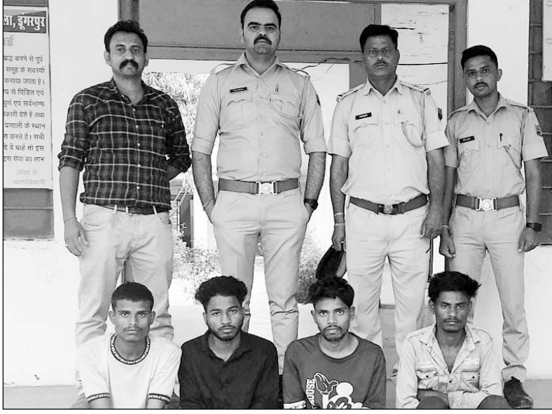
अपहरण व जानलेवा हमले के मामले में गिरफ्तार किये गए आरोपियों के साथ पुलिस दला।