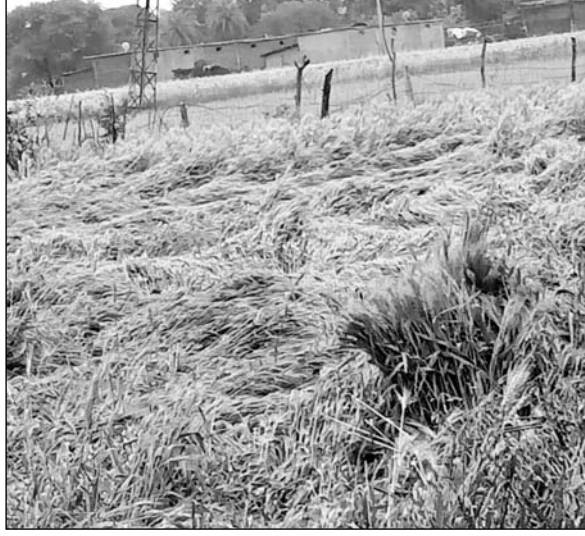
छबड़ा क्षेत्र में अतिवृष्टि से फसलों में काफी नुकसान हुआ।