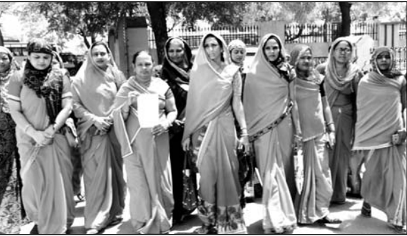
विधानसभा चुनाव में आशा सहयोगिनीयों को चुनाव ड्यूटी का मानदेय नहीं देने पर जिला कलेक्टर को ज्ञापन सौंपा।

चूरू, (कास)। विधानसभा चुनाव में आशा सहयोगिनीयों को चुनाव ड्यूटी का मानदेय नहीं देने पर मंगलवार को जिला कलेक्टर को ज्ञापन सौंपा। ज्ञापन में बताया कि विधानसभा चुनाव में आशा सहयोगिनीयों को ड्यूटी लगाई गई और सभी आशाओं ने अपना कार्य पूर्ण निष्ठा पूर्वक किया, जिसमें आंगनबाड़ी कार्यकर्ता व सहायिकाओं की ड्यूटी लगाई गई। इसके अंतर्गत आशा सहयोगिनीयों को चुनाव ड्यूटी को लेकर फरार हो जाते हैं, जिनको पकड़ने में बहुत अधिक परेशानियों का सामना करना पड़ता है। क्योंकि बहुत से वाहनों के नम्बर प्लेट नहीं हैं कुछ वाहन चालक नंबर छुपाने के लिए नंबर प्लेट पर ग्रीस लगा कर रखते हैं।