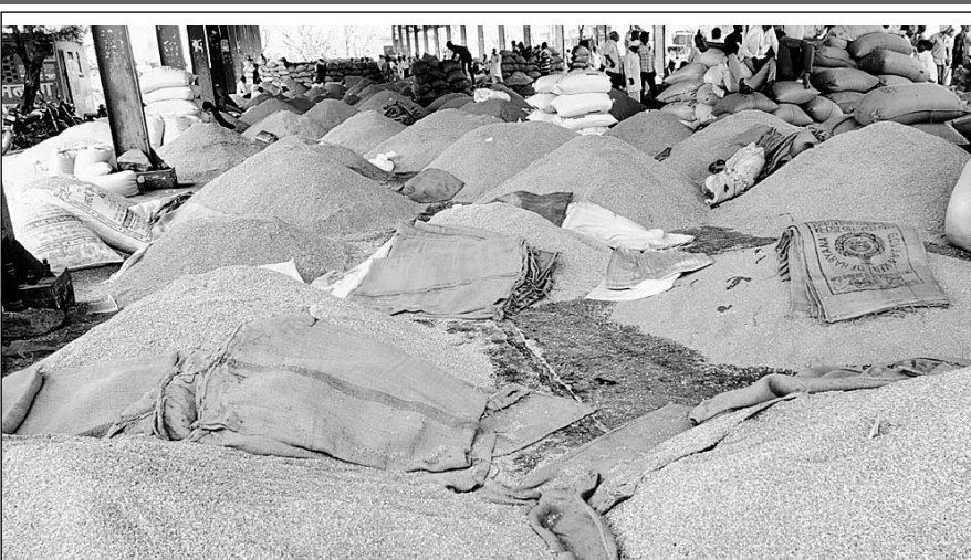
निवाड़ कृषि उपज मण्डी में नई सौंफ की व्यापारियों ने बोली लगाई।

■ मण्डी में सरसों, चना, गेहू व जौ सहित कई जिंसे भी बिकने के लिए आ रही है