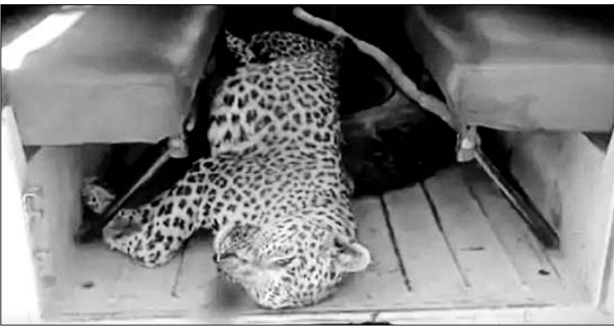
वन विभाग की टीम अंतिम संस्कार के लिए लेपर्ड के शव को सागवाड़ा वन विभाग के ऑफिस ले गई।

■ तालाब से नहाकर लौट रहे युवक पर लेपर्ड ने हमला कर घायल कर दिया था