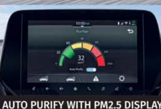
AUTO PURIFY WITH PM2.5 DISPLAY