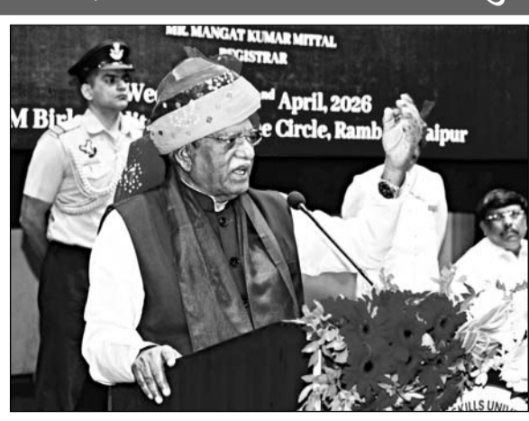
राज्यपाल हरिभाऊ बागडे ने बुधवार को विश्वकर्मा कौशल विश्वविद्यालय के द्वितीय दीक्षांत समारोह को संबोधित किया।

-कार्यालय संवाददाता- जयपुर। राज्यपाल हरिभाऊ बागडे ने कहा कि कौशल शिक्षा का उपयोग राष्ट्र के सर्वांगीण विकास के लिए होना चाहिए। उन्होंने कहा कि जिसके पास अच्छा कौशल है, उसे सभी स्थानों पर काम मिलता है, वह कभी भूखा नहीं रहता। उन्होंने कौशल शिक्षा के साथ विश्वविद्यालयों में नैतिक शिक्षा को बढ़ावा दिए जाने पर जोर दिया। उन्होंने कहा कि नैतिक मूल्यों की शिक्षा से भौतिक विकास की गुणवत्ता में वृद्धि होती है। राज्यपाल बागडे बुधवार को विश्वकर्मा कौशल विश्वविद्यालय के द्वितीय दीक्षांत समारोह में संबोधित कर रहे थे। उन्होंने विश्वविद्यालय द्वारा प्रति वर्ष दीक्षांत समारोह आयोजक रूप से किए जाने के निर्देश दिए। उन्होंने कहा कि दीक्षांत समारोह भले ही छोटे स्तर पर ही हो, परंतु नियमित होना चाहिए। जो विद्यार्थी विश्वविद्यालय में पढ़ते