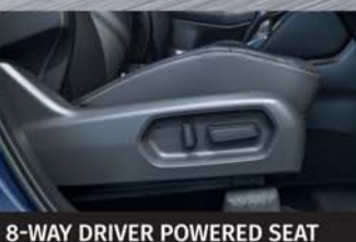
8-WAY DRIVER POWERED SEAT