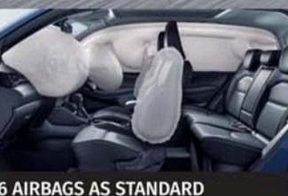
6 AIRBAGS AS STANDARD