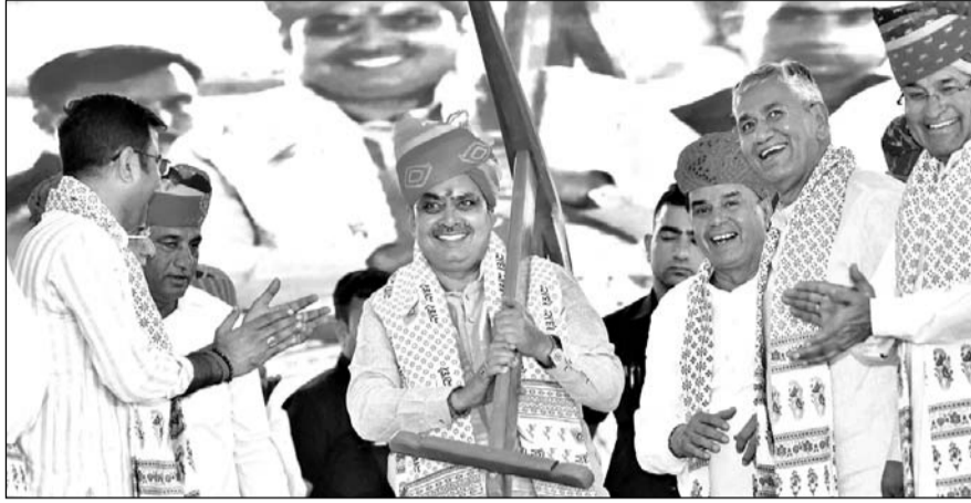
ओसियां में आयोजित कार्यक्रम में मुख्यमंत्री भजनलाल शर्मा का स्वागत किया गया।

इस अवसर पर मुख्यमंत्री ने शिक्षा, स्वास्थ्य, विद्युत, सड़क सहित विभिन्न क्षेत्रों के 416 करोड़ रुपये से अधिक विकास कार्यों का लोकार्पण और शिलान्यास किया। उन्होंने ओसियां उपखण्ड मुख्यालय पर खेल स्टेडियम के निर्माण के साथ ही नेतरा और पिचकीबेरा में 33 केवी के जीएसएस के स्थापना की घोषणा भी की। मुख्यमंत्री ने आह्वान किया कि किसान आधुनिक कृषि तकनीकों को अपनाएं और समृद्ध बनें। इसी कड़ी में