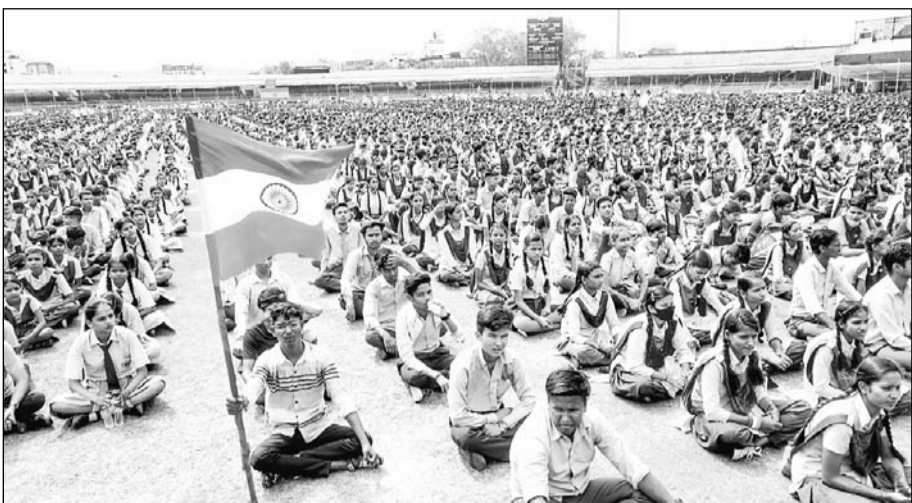
जयपुर के एसएमएस स्टेडियम सहित सभी 33 जिलों में शुक्रवार को स्कूली बच्चों और अभिभावकों, स्टाफ आदि ने एक साथ मिलकर छह देशभक्ति गीत गाए।

जयपुर, (का.प्र.)। राजस्थान ने शुक्रवार को इतिहास रचा। एक साथ 1 करोड़ 21 लाख से अधिक लोगों ने देशभक्ति गीतों को गाकर वर्ल्ड रिकॉर्ड बनाया। जयपुर के एसएमएस स्टेडियम से लेकर राजस्थान के सभी 33 जिलों में सुबह 10.15 बजे से 10.40 बजे के बीच प्रदेशभर में स्कूली बच्चों और अभिभावकों, स्टाफ आदि ने एक साथ मिलकर 6 देशभक्ति गीत गाए। इसके साथ ही राजस्थान ने वर्ल्ड रिकॉर्ड बनाकर इतिहास रच दिया। शिक्षा विभाग की ओर से जारी आंकड़ों के मुताबिक इस आयोजन में 1 करोड़ 21 लाख 76 हजार 737 लोगों ने हिस्सा लिया है। जिसमें से 1 करोड़ 24 हजार 22 विद्यार्थी शामिल हैं। देशभक्ति गीतों के गायन पर राजस्थान को वर्ल्ड बुक ऑफ रिकार्ड्स का प्रोविजनल सर्टिफिकेट मिला है। इस अवसर पर वर्ल्ड बुक ऑफ रिकार्ड्स लंदन के प्रतिनिधि