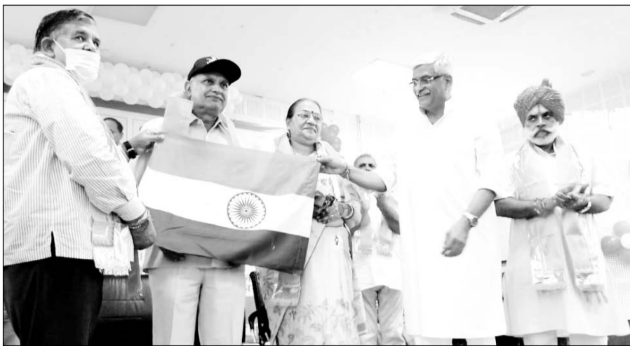
उदयपुर में शहीदों एवं स्वतंत्रता सेनानियों के परिवार जनों का सम्मान समारोह का आयोजन हुआ।

उसी श्रृंखला में उदयपुर में नगर निगम परिसर स्थित पंडित दीनदयाल उपाध्याय सभागार में केंद्रीय जल शक्ति मंत्री गजेंद्र सिंह शेखावत के मुख्य अतिथि में एवं नेता प्रतिपक्ष गुलाबचंद कटारिया के मुख्य सानिध्य में कार्यक्रम का आयोजन किया जिसमें अनेकों स्वतंत्रता सेनानियों एवं शहीदों के परिवार जनों का सम्मान एवं अभिनंदन किया। केंद्रीय मंत्री गजेंद्र सिंह ने कहा कि मेवाड़ ने स्वतंत्रता संग्राम में भारत देश को ही नहीं बल्कि समूचे विश्व को एक नई दिशा दी है। शेखावत ने बिजौलिया आंदोलन को याद करते हुए कहा कि हम उन्हें श्रद्धांजलि दें। बिजौलिया क्रांति के जनक माणिक्यलाल वर्मा के जीवन को युवाओं के लिए प्रेरणा स्रोत बताते हुए शेखावत ने कहा कि युवा पीढ़ी को माणिक्यलाल वर्मा के जीवन, व्यक्तित्व व कृतित्व से सीखना चाहिए। उन्होंने कहा कि देश के 75 लाख का कालखण्ड बहुत बड़ा और मजबूत है और इतिहास गवाह है, आजादी की लड़ाई में मेवाड़ के योगदान को भुलाया