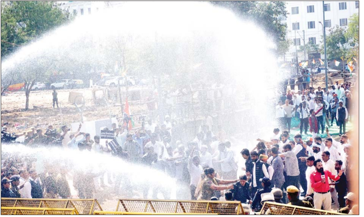
विधानसभा का घेराव करने जा रहे कांग्रेस कार्यकर्ताओं और पुलिस के बीच धक्का मुक्की हुई। इस दौरान पुलिस ने नेताओं एवं कार्यकर्ताओं पर हल्का लाठीचार्ज किया और बॉटर कैनन से पानी डालकर उन्हें रोकने का प्रयास किया।

( प्रथम पृष्ठ का शेष ) सरकार को यहाँ से अतिक्रमण हटाने को लेकर की गई कार्रवाई की प्रगति रिपोर्ट पेश करने को कहा है। जनिहत याचिका में कहा गया कि करतारपुरा नाले में जगह-जगह अतिक्रमण हो गया है और नाला पक्का भी नहीं है। मानसून में यहाँ कई लोगों की जान तक जा चुकी है। नाले की कई जगह तो चौड़ाई अतिक्रमण के चलते कुछ फीट ही रह गई है। ऐसे में इसे पक्का कर अतिक्रमण हटाया जाए।