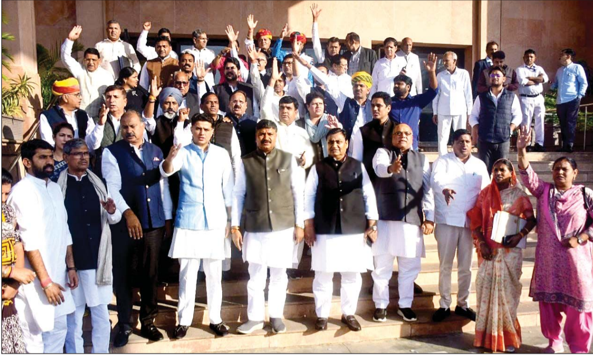
इंदिरा गांधी पर की गई विवादित टिप्पणी व छः विधायकों के निलम्बन के विरोध में प्रदर्शन कर रहे कांग्रेस विधायकों ने सदन की कार्यवाही का बायकॉट कर दिया। पूर्व उपमुख्यमंत्री सचिन पायलट सहित कांग्रेसियों ने सदन से बाहर आकर विधानसभा की सीढ़ीयों पर नारेबाजी की।