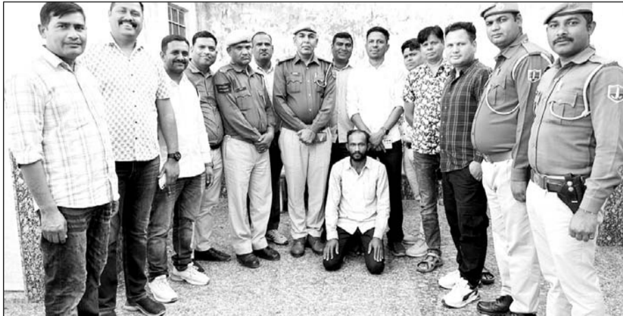
महिला की गला रेतकर निर्मम हत्या के मामले में सरवाड़ पुलिस ने आरोपी को गिरफ्तार किया।