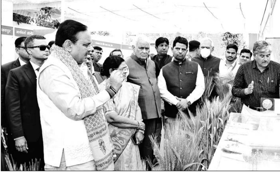
मुख्यमंत्री भजनलाल शर्मा ने राज्य कृषि प्रबंधन संस्थान में सोमवार को कृषि संबंधी विभिन्न विभागों द्वारा लगाई गई स्टॉल एवं प्रदर्शनी का अवलोकन किया।