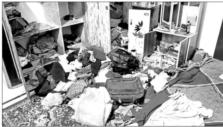
नारायणपुर कस्बे के जयपुर रोड स्थित भारत नगर में बीती रात चोरों ने एक सूने घर से चोरी की।

नारायणपुर। कस्बे के जयपुर रोड स्थित भारत नगर में बीती रात चोरों ने एक सूने घर को निशाना बनाया और लाखों रुपये के आभूषण व नकदी लेकर फरार हो गए।