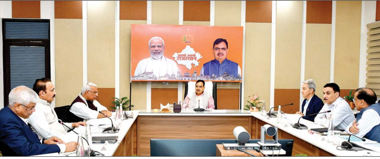
मुख्यमंत्री भजनलाल शर्मा ने भारतीय न्याय संहिता, भारतीय नागरिक सुरक्षा संहिता तथा भारतीय साक्ष्य अधिनियम के प्रदेश में क्रियान्वयन के संबंध में गृह विभाग की उच्चस्तरीय बैठक को संबोधित किया।