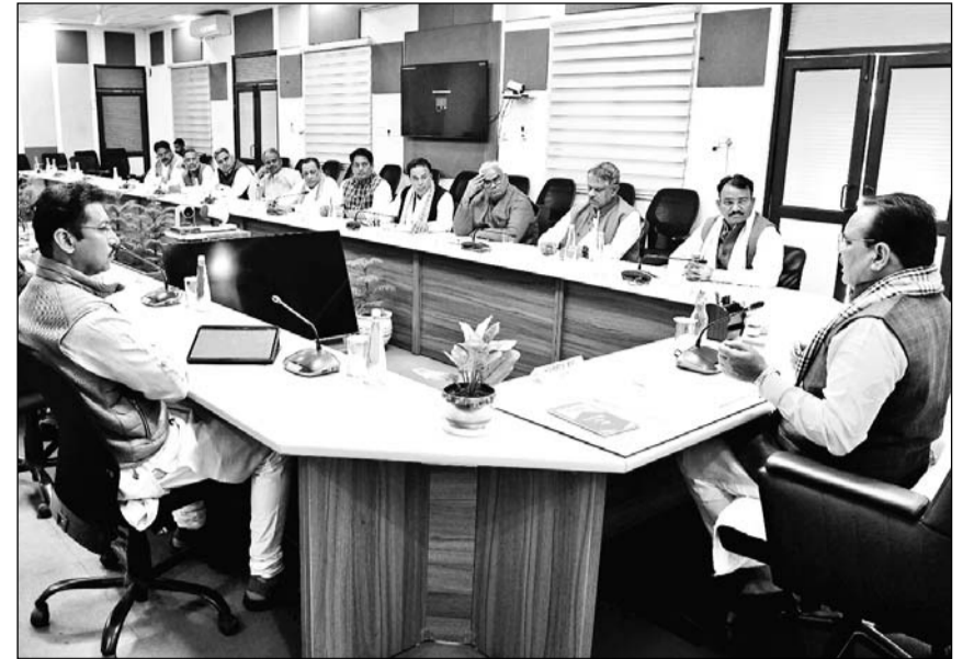
16 वीं विधानसभा के आगामी सत्र को लेकर मुख्यमंत्री भजनलाल शर्मा ने गुरुवार को मुख्यमंत्री निवास पर मंत्री-परिषद् के सदस्यों के साथ बैठक कर संवाद किया। बैठक में आगामी विधानसभा सत्र के दौरान सदन में प्रश्नों के प्रभावी जवाब प्रस्तुत करने, जनहित के मुद्दों पर राज्य सरकार की नीति-निर्णयों को मजबूती से रखने को लेकर चर्चा की गई। साथ ही, बैठक में मुख्यमंत्री ने प्रदेश के विकास कार्यों, जनकल्याणकारी पहलुओं के विषय पर भी फ़ीडबैक लिया। उल्लेखनीय है कि 16 वीं विधानसभा का तृतीय सत्र (31 जनवरी) से शुरू होगा, जिसके संबंध में मुख्यमंत्री ने मंत्री-परिषद् के सदस्यों के साथ संवाद किया।