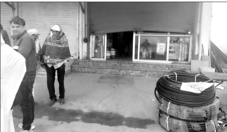
चोरी की वारदात के बाद मौके पर लोग जमा हो गए।