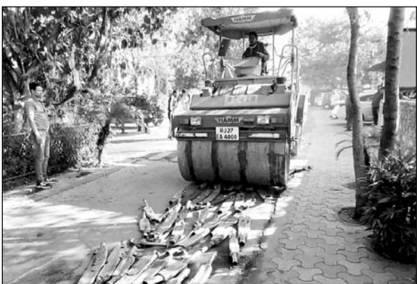
मॉडिफाई साईलेंसर्स को यातायात पुलिस ने नष्ट करवाया।