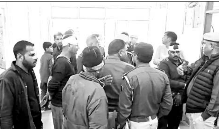
सूचना पर मौके पर पहुंची पुलिस ने घायलों को अस्पताल में भर्ती कराया।

अलवर, (निसं)। पानी की टंकी में अवैध कनेक्शन लेने को लेकर दो पक्षों में झगड़ा हो गया। इस दौरान एक पक्ष ने बुजुर्ग के सीने में गोली मार दी। गोली बुजुर्ग के फेफड़ों में फंस गई। परिजनों ने उसे आनन-फानन में अस्पताल में भर्ती कराया। इस विवाद में दोनों पक्षों के 20 लोग घायल हो गए, जिसमें दो महिलाएं भी शामिल हैं। 14 लोगों का अलवर जिला अस्पताल में इलाज चल रहा है। घटना अलवर के मालाखेड़ा थाना क्षेत्र के खेरली पंचनोत गांव में हुई। विवाद की सूचना पुलिस को दी गई। पुलिस ने घायलों के बयान दर्ज कर