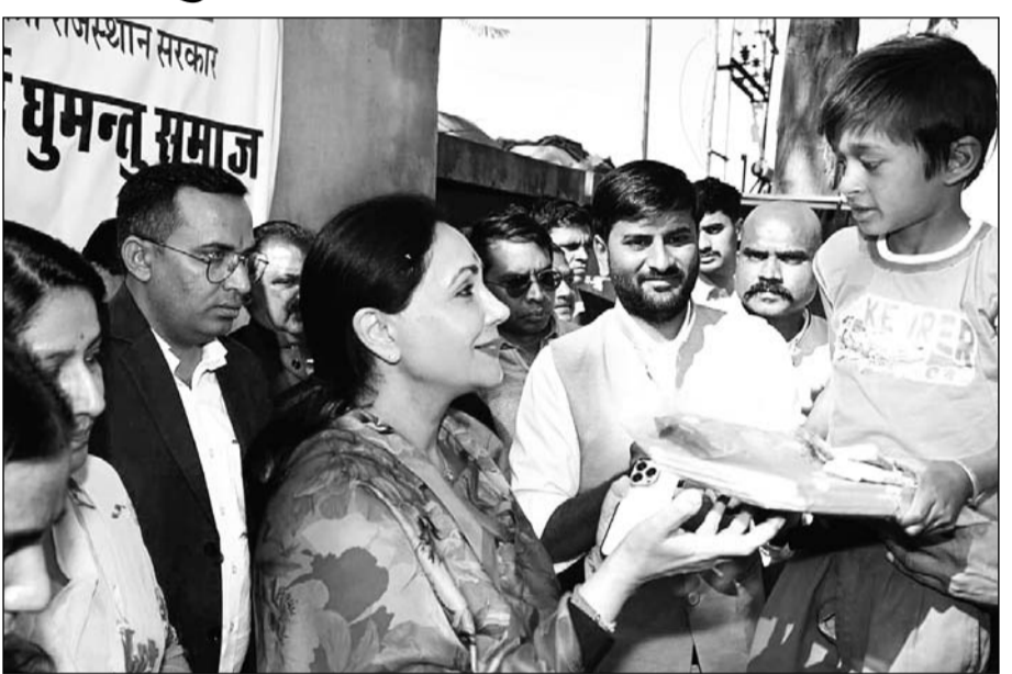
उपमुख्यमंत्री दिया कुमारी के जन्मदिन के अवसर पर किशन बाग बस्ती में भोजन वितरण किया गया।

जयपुर। प्रदेश की उपमुख्यमंत्री दिया कुमारी का जन्मदिन गुरुवार को धूमधाम से मनाया गया। उपमुख्यमंत्री के जन्मदिन के अवसर पर विभिन्न संस्थाओं और संगठनों के माध्यम से अनेक कार्यक्रम आयोजित किए गए। जिनमें दिया कुमारी को विद्याधर विधानसभा क्षेत्र, जयपुर और प्रदेश भर से हजारों की संख्या में आम जन और विशिष्ट जनों सहित विभिन्न संस्थाओं और संगठनों के जन्मदिन की हार्दिक शुभकामनायें दीं।