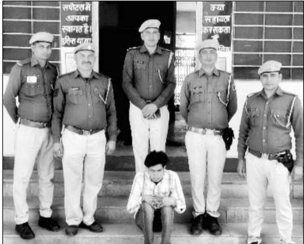
सपोटरा थाना पुलिस ने सायबर ठगी के आरोपी को गिरफ्तार किया।

सोशल मीडिया पर महिलाओं को निशाना बनाकर ब्लैकमेलिंग कर मोटी रकम की मांग करता था। पुलिस को आरोपी के बैंक खातों में लाखों रुपए का संदिग्ध लेन-देन मिला है।