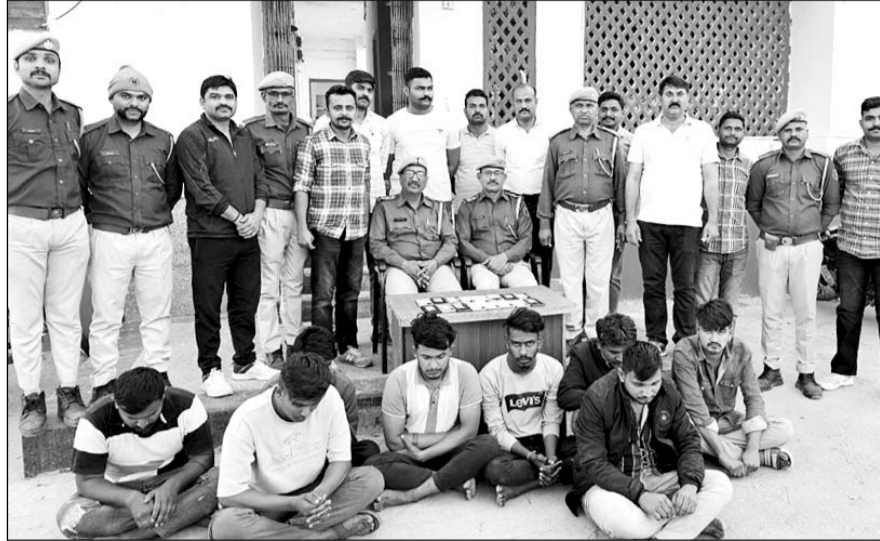
साबला पुलिस व सायबर सेल ने आठ ठगों को गिरफ्तार किया।