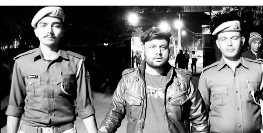
अवैध ब्लड सप्लाय के मामले में पुलिस ने सर्वाई माधोपुर ब्लड बैंक के मैनेजर को गिरफ्तार किया।

सांभरझील, (निसं)। गत दिनों मकराना में ब्लड बैंक शिविर लगाकर 255 यूनिट मानव खून की तस्करी से जुड़े मामले में पुलिस ने एक और आरोपी को गिरफ्तार किया है। गिरफ्तार आरोपी ने पूछताछ में पुलिस को सर्वाई माधोपुर ब्लड बैंक में प्रबंधक के पद पर काम करना बताया।