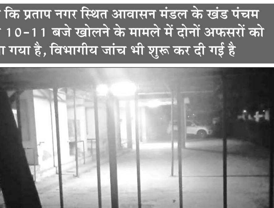
राजस्थान हाऊसिंग बोर्ड के प्रताप नगर स्थित खंड पंचम कार्यालय में मंगलवार देर रात पहुंचे दोनों सहायक लेखाधिकारी और पार्किंग में खड़ी गाड़ियों की तस्वीर।