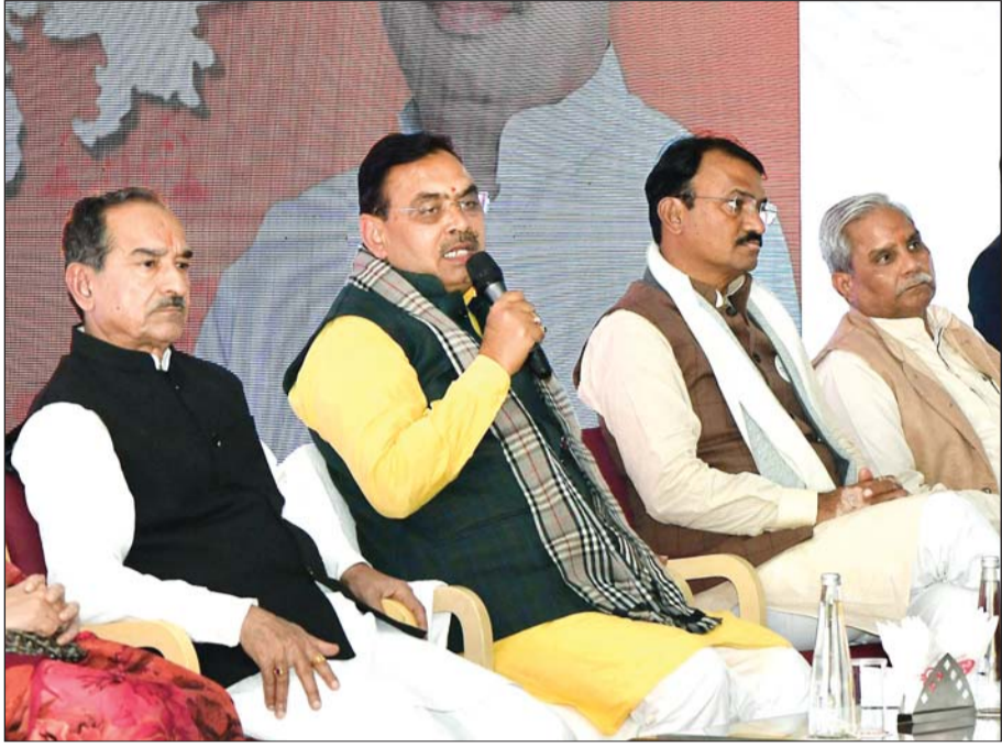
मुख्यमंत्री भजनलाल शर्मा ने भाजपा विधायक दल की बैठक की अध्यक्षता की। | विधायकों को संबोधित करते हुए उन्होंने कहा कि प्रदेशवासियों की आवश्यकताओं को पूरा करना हमारी सर्वोच्च प्राथमिकता है।

मुख्यमंत्री भजनलाल शर्मा ने कहा, सदन में नये विधायकों को मौका मिलेगा व सीनियर विधायकों के अनुभव का उपयोग होगा