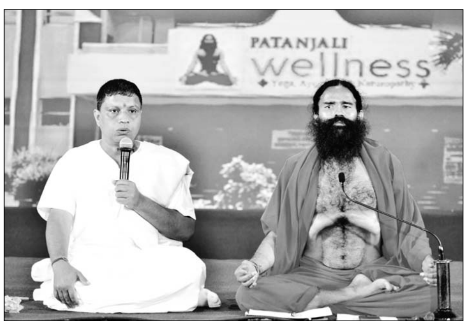
पतंजलि योगपीठ के परमाध्यक्ष स्वामी रामदेव व महामंत्री आचार्य बालकृष्ण की उपस्थिति में पतंजलि संस्थान का 30वां स्थापना दिवस पतंजलि वैलनेस, हरिद्वार स्थित योगभवन सभागार में सम्पन्न हुआ।

जयपुर/हरिद्वार। पतंजलि योगपीठ के परमाध्यक्ष स्वामी रामदेव व महामंत्री आचार्य बालकृष्ण की उपस्थिति में पतंजलि संस्थान का 30वां स्थापना दिवस पतंजलि वैलनेस, हरिद्वार स्थित योगभवन सभागार में सम्पन्न हुआ। कार्यक्रम में देशभर के पतंजलि योगपीठ संगठन के 6000 से अधिक प्रभारीगणों की उपस्थिति में स्वामी रामदेव ने विगत 30 वर्षों की सेवा, संघर्ष व साधना से परिचय कराया तथा पतंजलि योगपीठ की भावी योजनाओं पर प्रकाश डाला। उन्होंने योग क्रांति की सफलता के बाद पंच क्रांतियों का शंखनाद करते हुए कहा कि शिक्षा, चिकित्सा, आर्थिक, वैचारिक-सांस्कृतिक व रोगों-भोगों-ग्लानि-कुण्ठाओं से आजादी का बड़ा कार्य पतंजलि से प्रारंभ करना है।