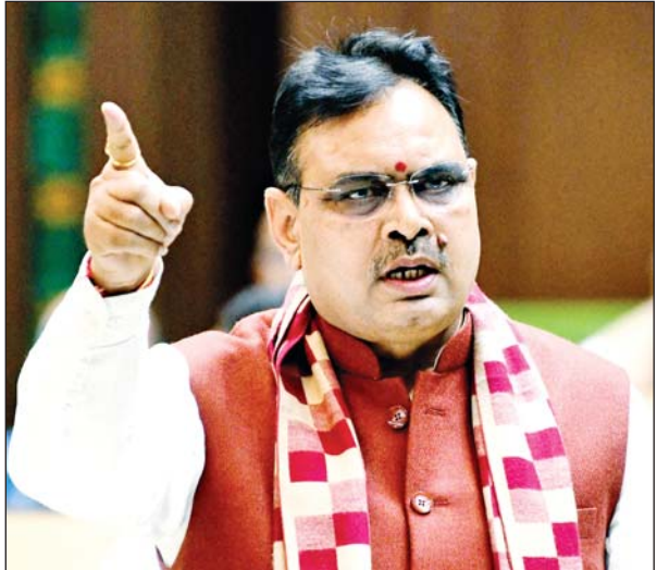
मुख्यमंत्री भजनलाल शर्मा

देने के लिए राजस्थान निवेश प्रोत्साहन योजना-2024 एवं अन्य 9 नई नीतियां भी जारी की गई हैं। राइजिंग राजस्थान समिट के तहत हुए निवेश