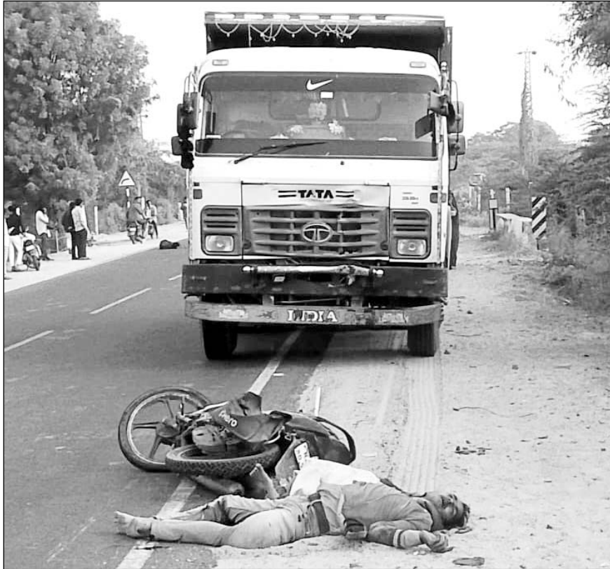
सायला पुलिस थानाक्षेत्र के उन्नडी-पोषाणा के बीच मामाजी मंदिर के पास स्टेट हाइवे पर अवैध बजरी से भरे डंपर ने एक मोटरसाइकिल पर जा रहे पति-पत्नी समेत उसके दो बच्चों को कुचल दिया।

सूचना पर सायला पुलिस मौके पर पहुंची तथा मृतकों के शवों को राजकीय सामुदायिक स्वास्थ्य केन्द्र सायला की मोर्चरी में रखवाया गया। साथ ही अवैध बजरी से भरे डंपर को जब्त किया। वहीं दुर्घटना के बाद मौके पर बड़ी संख्या में लोग