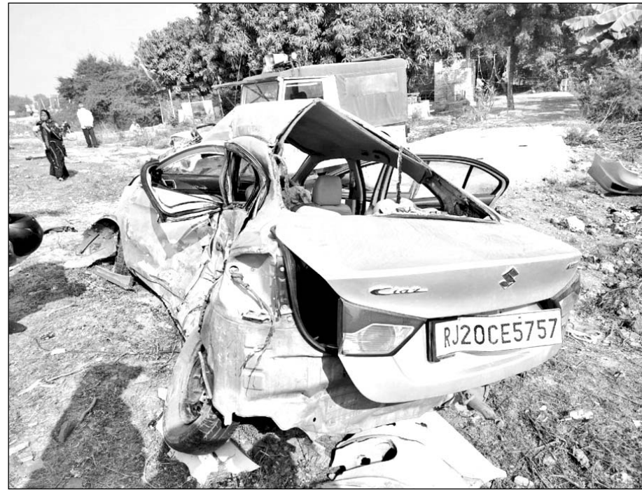
नेशनल हाईवे पर सड़क दुर्घटना में कार पूरी तरीके से क्षतिग्रस्त हो गई।

कोटा, (निस)। बूंदी जिले के तालेड़ा इलाके में नेशनल हाईवे 52 पर कोहरे के कारण एक दर्दनाक सड़क हादसा हो गया। इस हादसे में कार सवार व्यक्ति की मौत हो गई। जबकि दो अन्य गंभीर रूप से घायल हुए हैं। वहीं एक शव ज्वाइंटों में मिला है। घायलों को उपचार के लिए कोटा के एमबीएस अस्पताल में भर्ती कराया गया है। जहां उनका इलाज चल रहा है। यह घटना रविवार सुबह लगभग 3 बजे की बताई जा रही है।