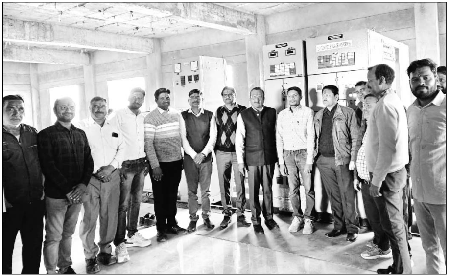
विद्युत प्रसारण निगम ने दौसा जिले में 132 केवी ग्रिड सब-स्टेशन, लवाण का संचालन शुरू किया।