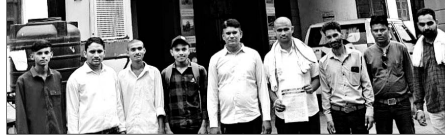
वायरल वीडियो के खिलाफ भाआपा के कार्यकर्ताओं ने कलेक्टर को ज्ञापन सौंपा।