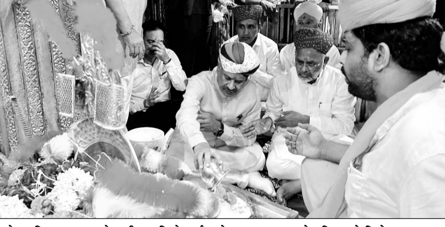
रामदेवरा स्थित बाबा रामदेव की समाधि के दर्शन लोकसभा अध्यक्ष ओम बिरला ने किये।

जैसलमेर/पोकरण, (नि.सं.)। जिले के रामदेवरा के प्रवास पर आए लोकसभा अध्यक्ष ओम बिरला ने सोमवार को बाबा रामदेव की समाधि के दर्शन किए। बिरला 1.5 कि.मी. तक पदयात्रा करते हुए बाबा के धाम पहुंचे और पूजा अर्चना कर देश में खुशहाली की कामना की। बिरला ने कहा कि राजस्थान ही नहीं बल्कि देशभर के असेंख्य श्रद्धालुओं की आस्था के केंद्र रामदेवरा में बाबा के दर्शन के लिए आना मेरे लिए सुखद क्षण है। बाबा रामदेव जी की महिमा अंपरंपार है, उनका जीवन हम सभी के लिए एक उज्ज्वल प्रेरणा है। उनका आशीर्वाद सदैव हम पर बना रहे और हम उनके आदर्शों पर चलते हुए एक बेहतर समाज का निर्माण कर सकें। सर्वधर्म सद्भाव के प्रतीक बाबा रामदेव जी ने सामाजिक भेदभाव का विरोध