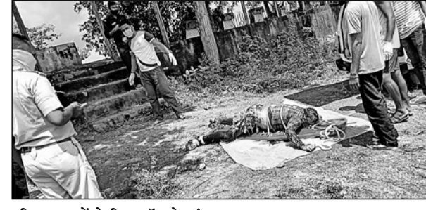
भीलवाड़ा में पेटेजी शॉप के संचालक का शव बरामद हुआ।