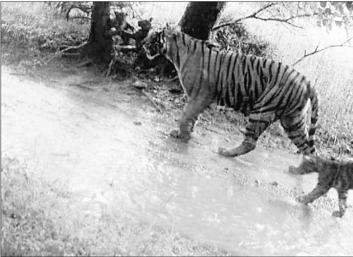
सवाईमाधोपुर के रणथम्भौर में वन विभाग की ओर से बाघिन टी-125 सिद्धि की फोटो ट्रेप की गई।

फिलहाल वन विभाग की द्वारा बाघिन व शावकों को मॉनिटरिंग और ट्रेकिंग शुरू कर दी गई है। बाघिन सिद्धि को उम्र करीब साढ़े छह साल है। यह बाघिन सिद्धि टी-125 रणथम्भौर की मशहूर बाघिन एरोहेड टी-84 की बेटा है और