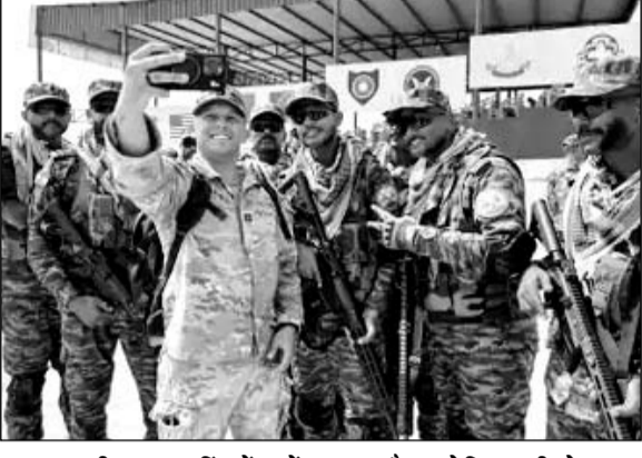
महाजन फील्ड फायरिंग रेंज में भारत और अमेरिका की सेना का संयुक्त युद्धाभ्यास शुरू होने के अवसर पर सेल्फी लेते सैनिक।

महाजन फील्ड फायरिंग रेंज में यह अब तक का सबसे बड़ा युद्धाभ्यास है। इसमें भारत-अमेरिका के कुल 1200 सैनिक हिस्सा ले रहे हैं। दोनों देशों के जवान मिलकर 15 दिन तक दुश्मन को घेरकर मारने सहित कई रणनीतियों का अभ्यास करेंगे। इस दौरान एयरबोर्न और हेलीबोर्न ऑपरेशन को अंजाम दिया जाएगा। गांव में छिपे आर्टिकियों को खोजकर मारने के अलावा ड्रोन हमलों से बचाव का भी