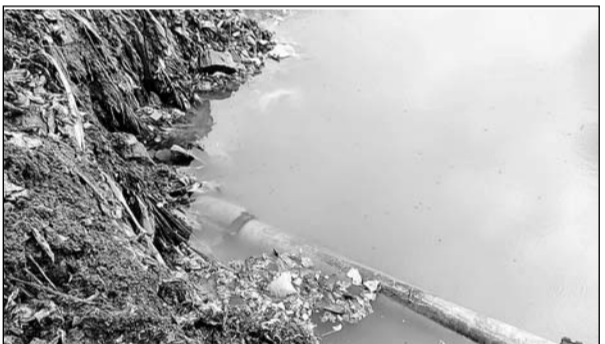
प्रमुख लाइन के क्षतिग्रस्त होने से पानी की समस्या हो गई।

चाकसू, (निस)। कस्बे के मनोहर तालाब की टूटी हुई पाल की तरफ से गुजर रही पुलिस थाने की पानी की टंकी की मैन लाइन क्षतिग्रस्त होने के चलते आधा चाकसू चार दिनों से पेयजल सप्लाई को तब रूक रहा है। गत 5 सितंबर गुरुवार रात्रि को मनोहर तालाब की पाल टूटने के बाद तालाब का पानी कच्ची बस्ती की ओर चला गया था। इसी दौरान प्रशासन की ओर से टूटी हुई पाल को दुरुस्त करने के दौरान यहां से गुजर रही मैन सप्लाई की लाइन टूट गई थी जिससे क्षेत्र के मामोडियां का मोहल्ला, बागवानियां का मोहल्ला, शिवाली का मोहल्ला, डोबलों का मोहल्ला, नागोरी का मोहल्ला, आजाद कृषि फार्म इलाके, सूर्य कालोनी सूरजकुंड सहित लगभग आधा चाकसू चार दिनों से पेजल सप्लाई नहीं पहुंच पा रही है। चार दिनों में भी पाइपलाइन के सही नहीं होने से यहां के लोग काफी