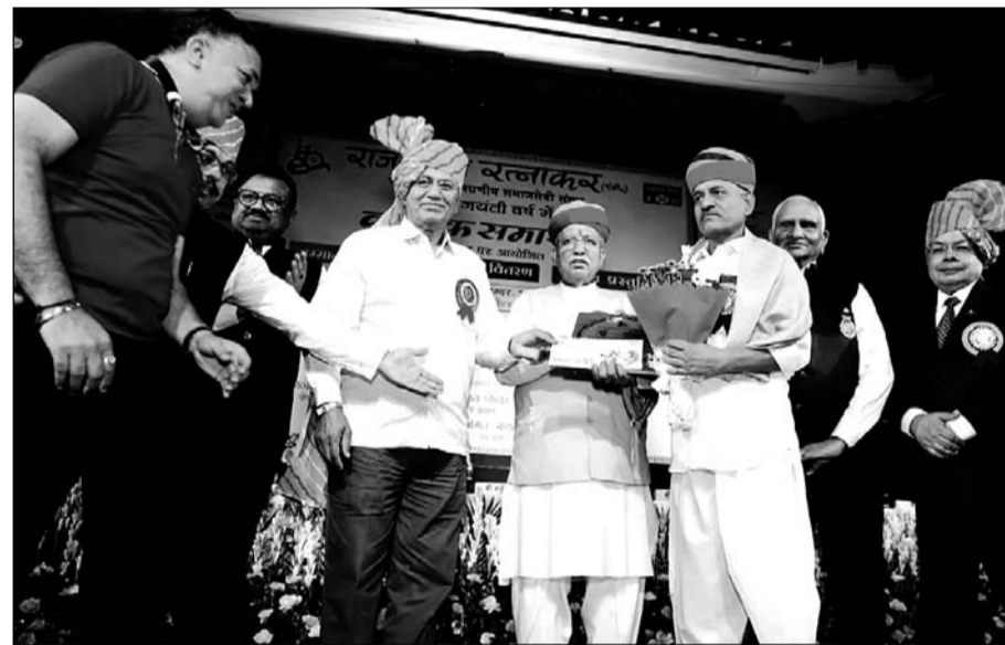
राजस्थान रत्नाकर के स्वर्ण जयंती वर्ष समारोह में राजस्थानी साहित्यकारों को सम्मानित किया।

नई दिल्ली। केन्द्रीय संस्कृति और पर्यटन मंत्री गजेन्द्र सिंह शेखावत ने कहा कि भारतीय संस्कृति दुनिया में सबसे श्रेष्ठ संस्कृति है। इसमें भी राजस्थान संस्कृति सबसे बेहतर है। उन्होंने कहा कि प्रधानमंत्री नरेन्द्र मोदी भारत के सांस्कृतिक दूत बन पुरी दुनिया में भारत को गौरवान्वित कर रहे हैं। शेखावत रविवार को दिल्ली की प्रमुख समाज सेवी संस्था राजस्थान रत्नाकर के स्वर्ण जयंती वर्ष में नई दिल्ली के इण्डिया हैबिटेड सेंटर में आयोजित वार्षिक समारोह में बोल रहे थे। शेखावत ने कहा कि राजस्थान रत्नाकर जैसी संस्थाएँ पिछले 50 वर्षों से इस संस्कृति को संजोये हुए हैं। उन्होंने कहा कि दिल्ली जैसे महानगर में अपने प्रदेश की संस्कृति को जियदा रख राजस्थान रत्नाकर प्रेरणादायक और अनुकरणीय कार्य कर रही हैं। समारोह में केन्द्रीय विधि और न्याय मंत्री अर्जुन राम मेघवाल ने कहा कि प्रवासी राजस्थानी जहां कहीं भी रहते हैं वहां वे राजस्थानी और भारतीय संस्कृति