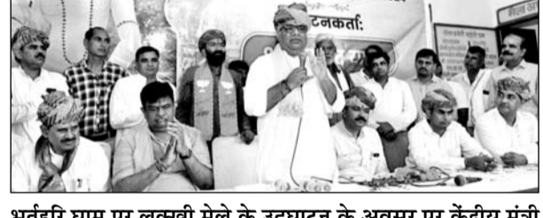
भर्तृहरि धाम पर लक्ष्मी मेले के उद्घाटन के अवसर पर केंद्रीय मंत्री भूपेंद्र यादव ने सम्बोधित किया।

केंद्रीय मंत्री भूपेंद्र यादव ने कहा भर्तृहरि धाम जन-जन की आस्था का केंद्र है। महाराजा भर्तृहरि जी तीन अलग-अलग कितारों लिखी हैं जिसमें एक कितार में आदमी सामाजिक जीवन जीना चाहिए दूसरी राजनीतिक आदमी कैसा हो इस पर लिखी है और तीसरी कितार जो है ईश्वर को कैसे पाया जाता है यह उन्होंने वैराग्य में लिखा है। इसलिए राजनीति से ऊपर उठकर कम करें क्योंकि सबका मालिक एक है और इसके आगे हम सब सेवक हैं। भूपेंद्र यादव ने कहा जन-जन की आस्था का केंद्र भर्तृहरि धाम को विकसित करने के लिए राजस्थान सरकार ने बजट में अपने