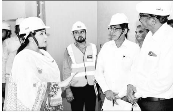
दिया कुमारी ने सोमवार को दिल्ली में निर्माणधीन राजस्थान हाउस का निरीक्षण किया।

नई दिल्ली। उपमुख्यमंत्री और सार्वजनिक निर्माण विभाग और पर्यटन मंत्री दिया कुमारी ने सोमवार को नई दिल्ली में निर्माणधीन राजस्थान हाउस का निरीक्षण करके हाउस के निर्माण की कार्य प्रगति का जायजा लिया। इस दौरान उन्होंने अधिकारियों के साथ मीटिंग भी की जिसमें इंजीनियरों ने राजस्थान हाउस को लेकर प्रेजेंटेशन दिया कि कहां तक कार्य हो चुका है और आगे क्या कुछ करना है। बैठक में उप मुख्यमंत्री ने अधिकारियों से चर्चा के दौरान निर्माणधीन हाउस के पूरे ब्लूप्रिंट को समझते हुए उन्होंने अधिकारियों से साफ तौर पर कहा कि इस निर्माणधीन भवन के तैयार होने के बाद जब यहां पर लोग आए, इसके अंदर जब लोग पहुंचने तो आगंतुकों को लगे कि हम राजस्थान आ गए हैं। यहां की सारी व्यवस्थाएं राजस्थानी कल्चर से मेल खाते हुए डेवलप होने चाहिए। उन्होंने कहा कि आर लोग एक रिच्यू मीटिंग भी बुलाए और रिच्यू मीटिंग करके हमें जरूरत पड़ेगी तो इसमें जरूरी बदलाव भी किए जाएंगे। उपमुख्यमंत्री ने कहा कि दिल्ली में बनकर तैयार होने वाला यह भवन सिर्फ एक बिल्डिंग मात्र नहीं बल्कि राजस्थान का दर्पण होना चाहिए। निरीक्षण के दौरान दिया कुमारी ने