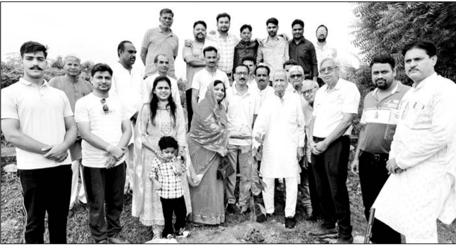
मुख्यमंत्री वृक्षारोपण महाभियान के तहत वृक्षारोपण कार्यक्रम आयोजित हुआ।