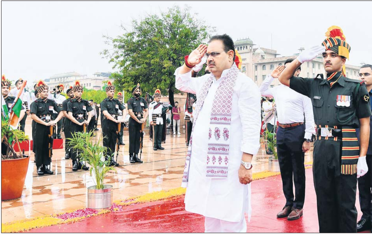
मुख्यमंत्री भजनलाल शर्मा ने कारगिल विजय दिवस की रजत जयंती पर अमर जवान ज्योति स्मारक पर शहीदों को श्रद्धांजलि अर्पित की। इस अवसर पर आयोजित समारोह में कर्नल राज्यवर्धन सिंह राठौड़ भी उनके साथ मौजूद रहे।