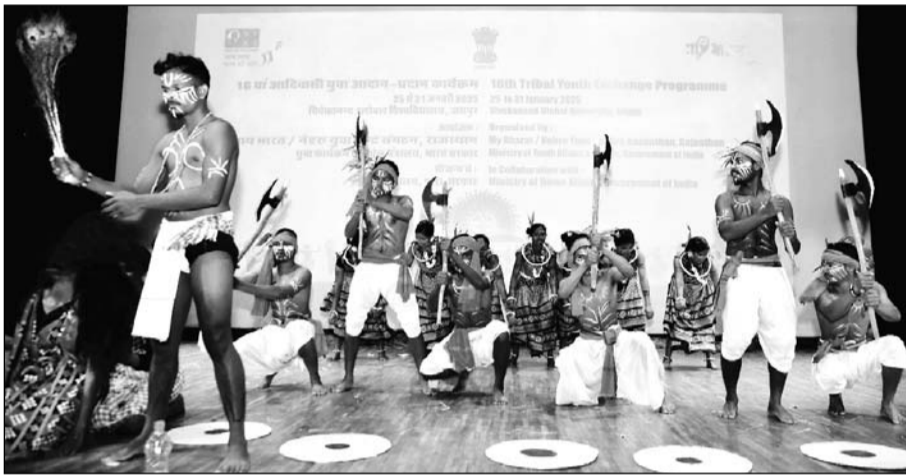
आरएफएफ कैंप, लालवास में आयोजित सांस्कृतिक संध्या में विभिन्न राज्यों के आदिवासी कलाकारों ने अपनी पारंपरिक प्रस्तुतियों से दर्शकों को मंत्रमुग्ध कर दिया

जयपुर। आरएफएफ कैंप, लालवास में आयोजित सांस्कृतिक संध्या में विभिन्न राज्यों के आदिवासी कलाकारों ने अपनी पारंपरिक प्रस्तुतियों से दर्शकों को मंत्रमुग्ध कर दिया। कार्यक्रम भारत सरकार के नेहरू युवा संगठन द्वारा गृह मंत्रालय के सौजन्य से आदिवासी युवा आदान-प्रदान कार्यक्रम के तहत आयोजित किया गया। झारखंड, ओडिशा और छत्तीसगढ़ के लोक कलाकारों ने अपने-अपने क्षेत्रीय नृत्य प्रस्तुत किए, जिनमें कृषि, प्रकृति, पारंपरिक आस्था और सामाजिक संदेश झलकते दिखे।