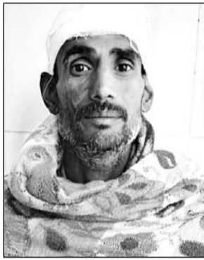
हमले में घायल युवक।