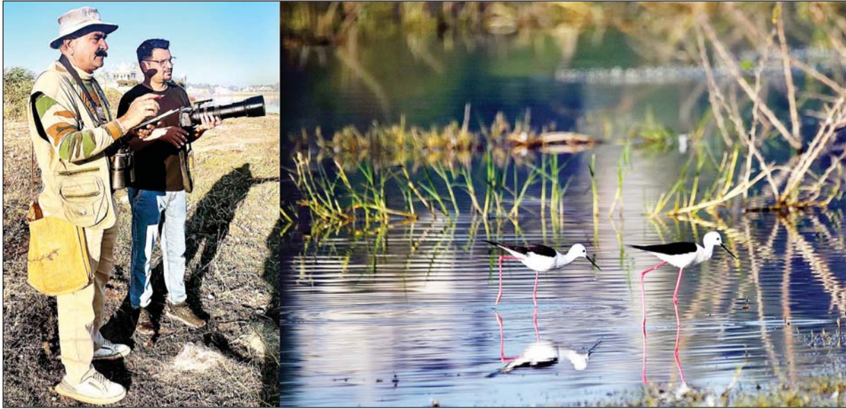
गेपसागर झील पर वन विभाग की ओर से दो दिवसीय मध्य शीतकालीन पक्षी गणना की गई। गणना में पिछले वर्षों के मुकाबले काफी कम पक्षी दिखाई दिए।