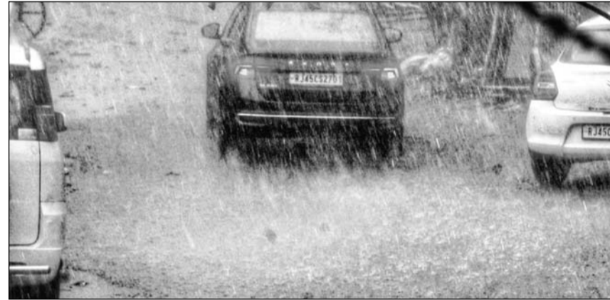
राजधानी जयपुर में शुक्रवार शाम तेज बारिश के साथ ओले भी गिरे।