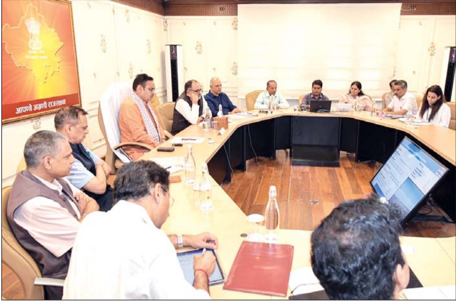
मुख्यमंत्री भजनलाल शर्मा ने शुक्रवार को मुख्यमंत्री कार्यालय में राष्ट्रीय जलमार्ग-48 को लेकर अहम बैठक की।

■ मुख्यमंत्री भजनलाल शर्मा ने भारतीय अंतर्देशीय जल मार्ग प्राधिकरण एवं आईआईटी मद्रास को प्रोजेक्ट के तकनीकी व वित्तीय आंकलन तथा जहाजों के अनुमानित ट्रैफिक की तुलनात्मक व अध्ययन रिपोर्ट तैयार करने के भी निर्देश दिए।