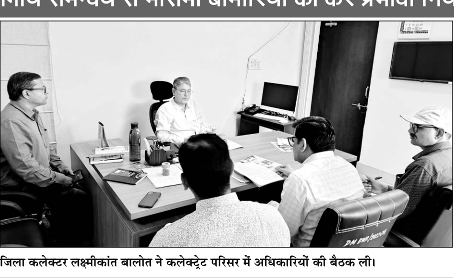
जिला कलेक्टर लक्ष्मीकांत बालोत ने कलेक्ट्रेट परिसर में अधिकारियों की बैठक ली।

ब्यावर, (निसं)। प्रदेश में वर्तमान समय में मच्छर जनित रोगों डेंगू, मलेरिया के प्रसार की स्थिति देखी जा रही है। जिससे आशंका प्रतीत होती है की बारिश के समय इन रोगों का अत्यधिक प्रसार हो सकता है। जिला कलेक्टर उत्सव कौशल ने जिले के अधिकारियों को मानसून से पूर्व मच्छरों के घनत्व को कम कर बारिश में इन रोगों के अपेक्षित प्रसार को कम करके प्रभावी बचाव एवं नियंत्रण की कार्रवाई करने के निर्देश दिए। जिला कलेक्टर लक्ष्मीकांत बालोत ने सोमवार को कलेक्ट्रेट परिसर में चिकित्सा सहित मौसमी बीमारियों से जुड़े विभिन्न विभागों के अधिकारियों की बैठक ली।