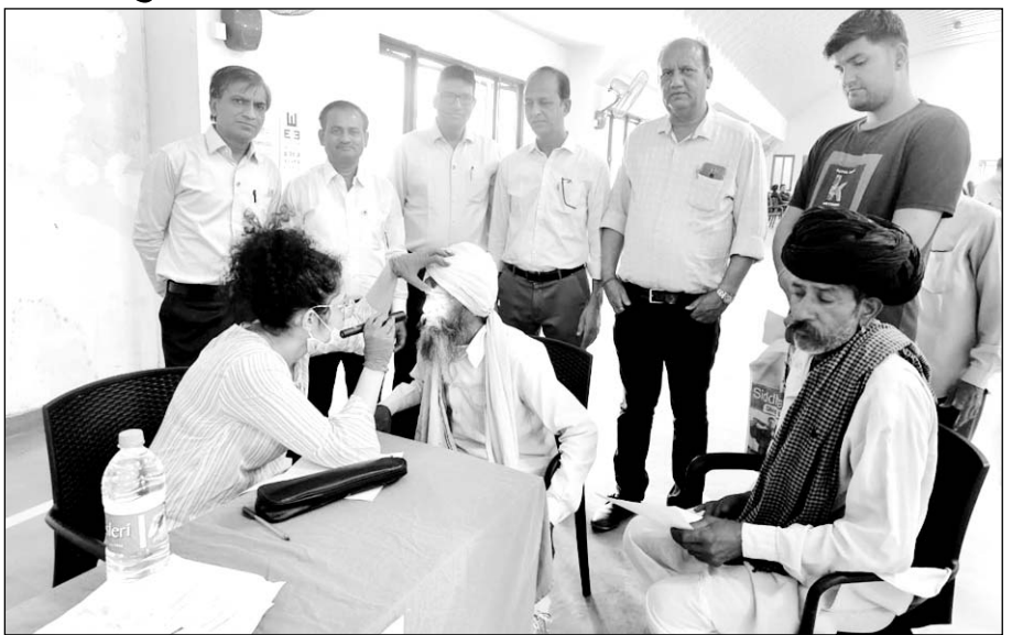
आर के मार्बल ग्रुप के आर्थिक सहयोग से निःशुल्क नेत्र जांच शिविर का आयोजन किया गया।

मदनराज-किशनगढ़, (निसं)। लायंस क्लब किशनगढ़ क्लासिक को और से जिला अंधता निवारण समिति