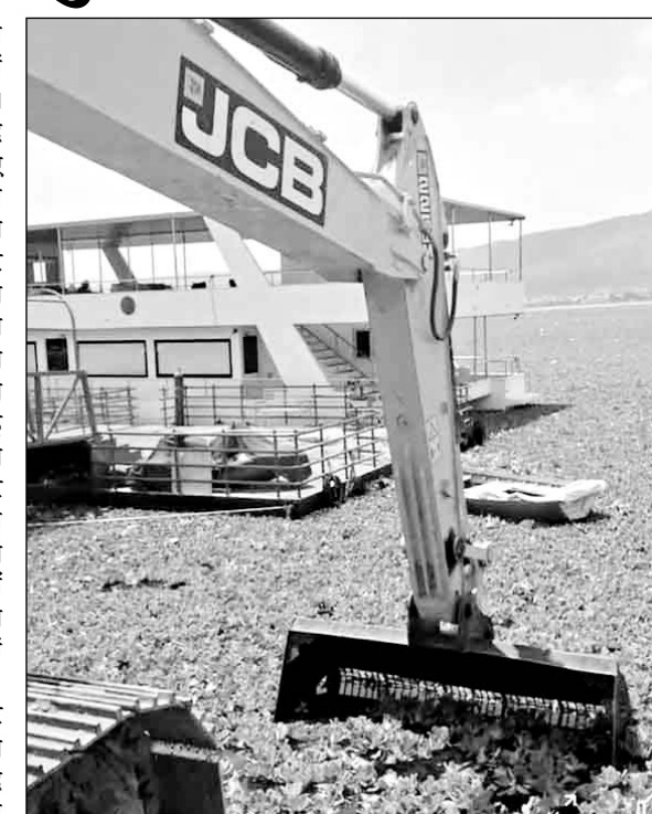
आनासागर झील से मशीनों से जलकुंभी निकली जा रही है।

अजमेर, (कास)। अजमेर की ऐतिहासिक आनासागर झील इन दिनों में सबसे खराब दौर से गुजर रही है। शहर की खूबसूरती में चार-चांद लगाने वाली और पर्यटकों के लिए आकर्षण का केंद्र रही झील को जलकुंभी ने अपनी चपेट में ले रखा है। निगम प्रशासन द्वारा हर स्तर पर जलकुंभी निकालने का काम किया जा रहा है, लेकिन समस्या जस की तस बनी हुई है। वहीं जलकुंभी की दुर्गंध से आस-पास की कॉलोनियों सहित अन्य क्षेत्रों में बीमारी का खतरा भी बढ़ रहा है। साथ ही रामप्रसाद घाट के पास डाली जा रही जलकुंभी के पानी से गिर रहे वाहन चालकों की परेशानी को देखते हुए कच्ची नाली बनाकर गंदा पानी नाले में डाला जा रहा है। वहीं नगर निगम द्वारा नई डी-बीडिंग मशीन भी खरीदी गई, पिछले कुछ दिनों में पूरी झील में जलकुंभी फैल गई। शहर की ऐतिहासिक आनासागर झील में फैली जलकुंभी को नगर निगम द्वारा निकाल कर झील के रामप्रसाद घाट के सामने खाली भूमि पर डाली जा रही है, जिसके कारण जलकुंभी से रिसाव होकर सड़क पर आ रहे पानी से वाहन चालकों और राहगीरों को परेशानी का सामना करना पड़ रहा है।