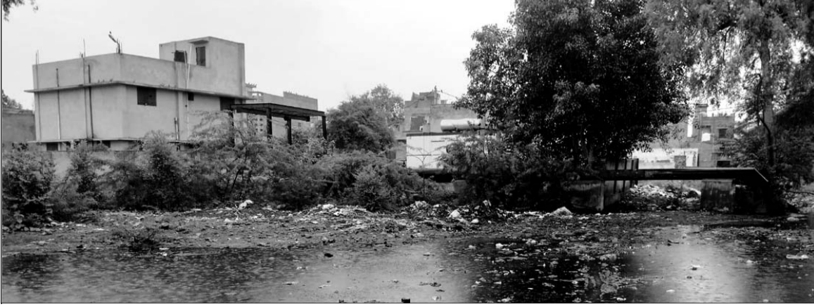
गंगाशहर के चांदमल बाग के आसपास फैला गन्दा पानी ।

शुद्ध पानी की बाडिया जिसमें विभिन्न प्रकार की सब्जियां उगाई जाती है वह पूरी तरह से डूब चुकी है लोगों के आजीविका का साधन खत्म हो गया है