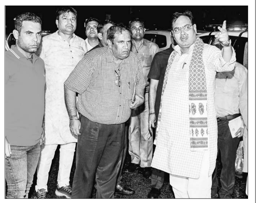
मुख्यमंत्री भजनलाल शर्मा ने सोमवार शाम को जयपुर शहर में हुई तेज बारिश के दौरान जवाहर सर्किल, मालवीय नगर अंडर पास, सांगानेर क्षेत्र, चामूं पुलिसिया, ढेर के बालाजी चौराहा, 9 नंबर और 14 नंबर चौराहे का जायजा लिया।

सिफारिश करने आए व्यक्ति ने रौब जताना शुरू कर दिया था। अभद्रता करने पर उसके खिलाफ भी रोजनामचे में रपट डालकर कार्रवाई की गई। मेरे जाने के बाद किन पुलिसकर्मियों से उसकी कहासुनी-मारपीट हुई, इस बारे में मुझे पता नहीं है।