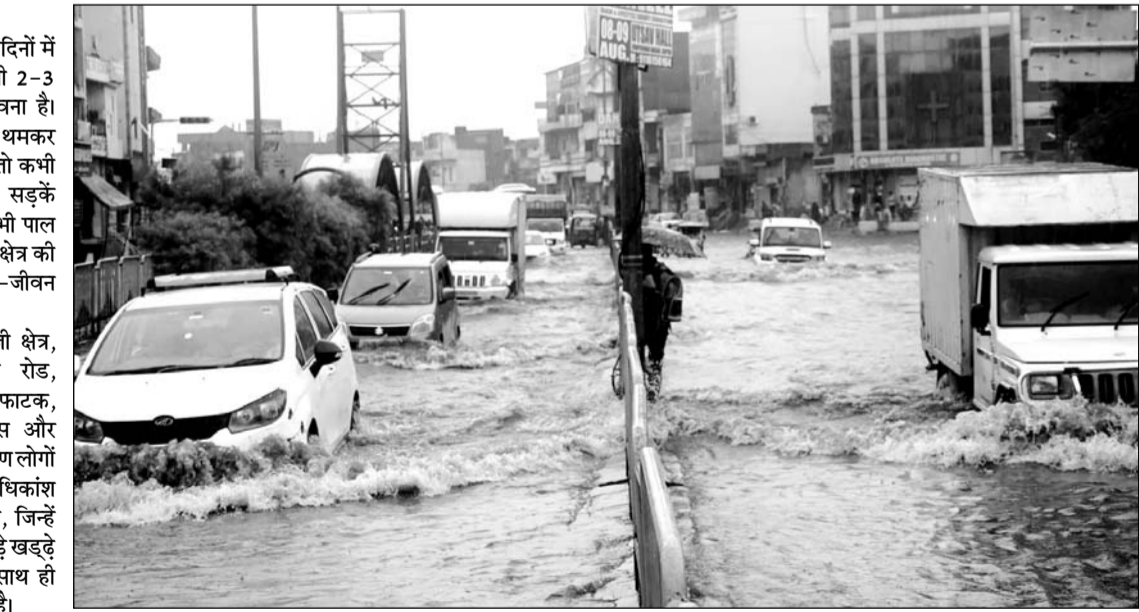
सोमवार को लगातार तीसरे दिन तेज बारिश के कारण सीकर रोड स्थित ढेहर के बालाजी क्षेत्र में मुख्य सड़क पर 3 फीट तक पानी भरा रहा। इस दौरान यहां से गुजरने वाले वाहन चालकों को भारी परेशानियां झेलनी पड़ी।

सीकर रोड पर ढेहर के बालाजी क्षेत्र, एम.आई.रोड, परकोटा, कालवाड़ रोड, सिरसी रोड, कनकपुरा-खिरणी फाटक, मालवीय नगर में नंदपुरी अंडरपास और ब्रह्मपुरी नाले के पास जलभराव के कारण लोगों को परेशानी झेलनी पड़ी। शहर की अधिकांश सड़कें बारिश के कारण टूट चुकी हैं, जिन्हें दुरुस्त नहीं किए जाने के कारण बड़े-बड़े खड़े लोगों के लिए मुसीबत बन रहे हैं। साथ ही ट्रेफिक जाम की समस्या भी बढ़ गई है।