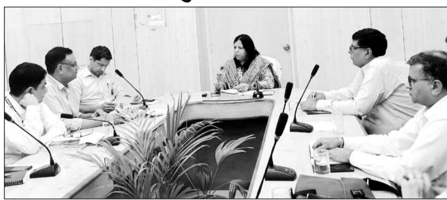
संभागीय आयुक्त वंदना सिंघवी ने मौसमी बीमारियों की रोकथाम के लिए चिकित्साविभाग व अन्य विभागों की बैठक ली

बीकानेर, 12 अगस्त। संभागीय आयुक्त श्रीमती वंदना सिंघवी ने मौसमी बीमारियों की रोकथाम के लिए चिकित्सा एवं स्वास्थ्य विभाग को आईईसी.एंटी लार्वल गतिविधियां तथा फॉगिंग आदि साधन रूप से करने के निर्देश दिए हैं। श्रीमती सिंघवी ने सोमवार को विभिन्न विभागों के साथ आयोजित बैठक में कहा कि मानसून के दौरान संभांग के विभिन्न शहरों और नगरीय निकालों में जलभराव वाले स्थानों पर मच्छर ना पनपे इसकी रोकथाम के लिए संबंधित विभाग आवश्यक समन्वय करते हुए सघन मॉनिटरिंग करें। आईईसी गतिविधियां जारी रखने के साथ-साथ डोर टू डोर सर्वे करवाया जाए। उन्होंने उल्टी दस्त आदि की रोकथाम के लिए फ्यूड सैफ्टिंग बढ़ाने के भी निर्देश दिए। बिजली आपूर्ति से जुड़े कार्यों की समीक्षा करते हुए संभागीय आयुक्त ने कहा कि ढीले तार कसवाने, टूटे पोल बदलवाने और ट्रांसफार्मर बदलवाने की कार्रवाई प्राथमिकता से संचालित करावाई जाए। आमजन को अपने छोटी-छोटी शिकायतों के निस्तारण के लिए अनावश्यक चक्कर न लगाने पड़े, यह सुनिश्चित किया जाए। श्रीमती सिंघवी ने कहा कि ऐसे विभाग जहां नियंत्रण कक्ष संचालित हैं वहां दर्ज शिकायत निस्तारण कार्यवाही का समुचित रिकार्ड