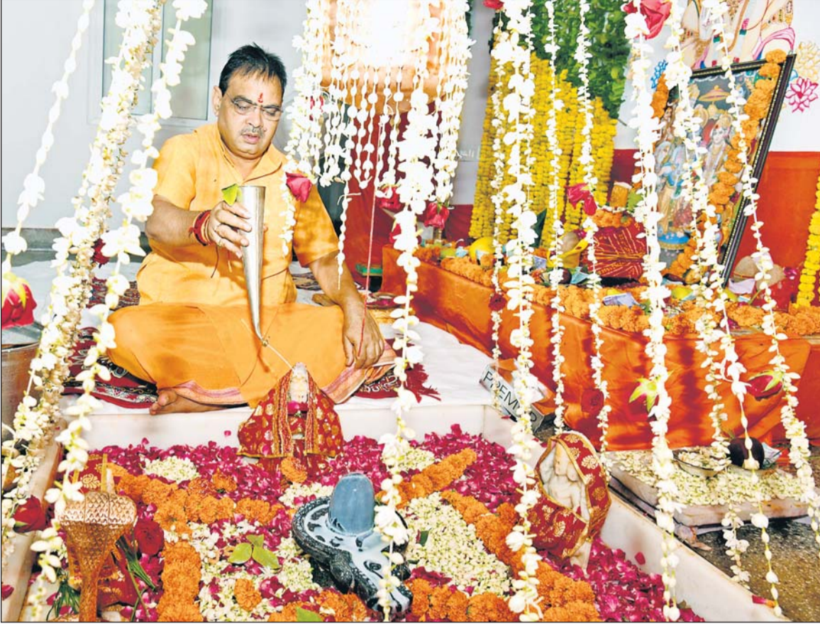
पवित्र माह श्रावण मास के चौथे सोमवार को मुख्यमंत्री भजनलाल शर्मा ने मुख्यमंत्री आवास परिसर में स्थित शिव मंदिर में भगवान महादेव की विधिवत् पूजा-अर्चना कर प्रदेशवासियों के मंगल व खुशहाल जीवन की कामना की।