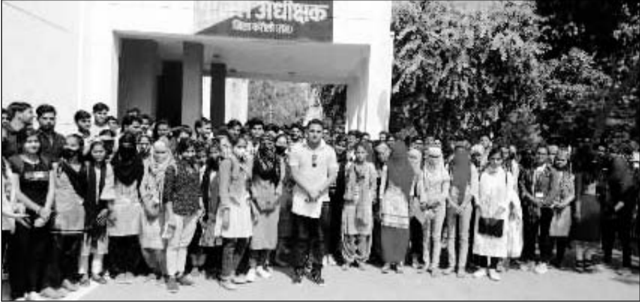
कॉलेज के विद्यार्थियों ने करौली पुलिस अधीक्षक को ज्ञापन सौंपा।

परेशानियों का सामना करना पड़ रहा है। उन्होंने ज्ञापन के माध्यम से बताए गए स्थानों पर पुलिस गस्त करवाने की मांग की इसके अलावा विद्यार्थियों ने जिला कलेक्टर को ज्ञापन पेशकर बताया कि जिला मुख्यालय हो या उपखंड मुख्यालय या किसी के घर पर