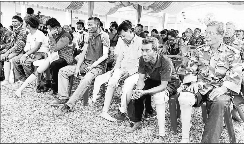
भारत सरकार के विदेश मंत्रालय से सहयोग से विश्व प्रसिद्ध जयपुर फुट का शिविर कम्बोडिया के बान्तीए भीनचे राज्य में शुरू हुआ।