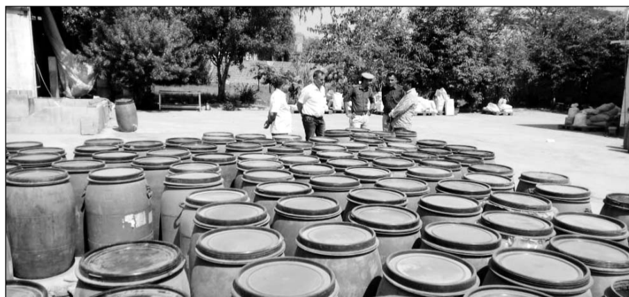
सुमेरपुर कस्बे में चिकित्सा विभाग की टीम ने फैक्ट्री में आचार जब्त करने की कार्रवाई की।