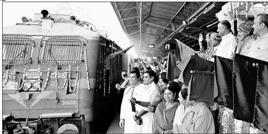
उदयपुर में जयपुर स्पेशल रेलसेवा की शुरूआत उदयपुर सिटी रेलवे स्टेशन पर जनप्रतिनिधियों ने हरी झंडी दिखाकर की।

जयपुर एक्सप्रेस ट्रेन का इंतजार किया जा रहा था। शुक्रवार से यह ट्रेन रूट पर चलेगी। गुरुवार को इसका विधिवत शुभारंभ उदयपुर सिटी रेलवे स्टेशन पर जनप्रतिनिधियों की मौजूदगी में हुआ। इस ट्रेन के साथ ही इस रूट पर इंदौर-उदयपुर-इंदौर ट्रेन का भी असारवा तक विस्तार कर दिया गया है। वहीं कोटा से भी असारवा के लिए एक ट्रेन चलाई गई है जो सप्ताह में दो दिन चलेगी। इन दोनों ट्रेनों की