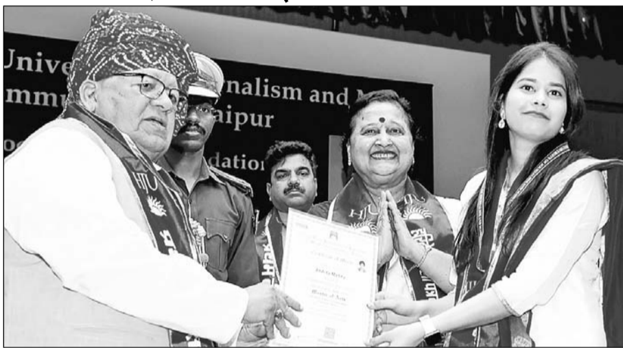
राज्यपाल एवं कुलाधिपति कलराज मिश्र ( बायें ) ने हरिदेव जोशी पत्रकारिता एवं जनसंचार विश्वविद्यालय के पहले दीक्षांत समारोह में उपाधियां प्रदान कीं।

जयपुर, (का.सं.)। राज्यपाल एवं कुलाधिपति कलराज मिश्र ने आव्हान किया है कि मीडिया स्व-निर्मित आचार संहिता के आधार पर पत्रकारिता के स्वस्थ मूल्यों का निर्वहन करते हुए जनहितकारी पत्रकारिता की मिसाल पेश करे।