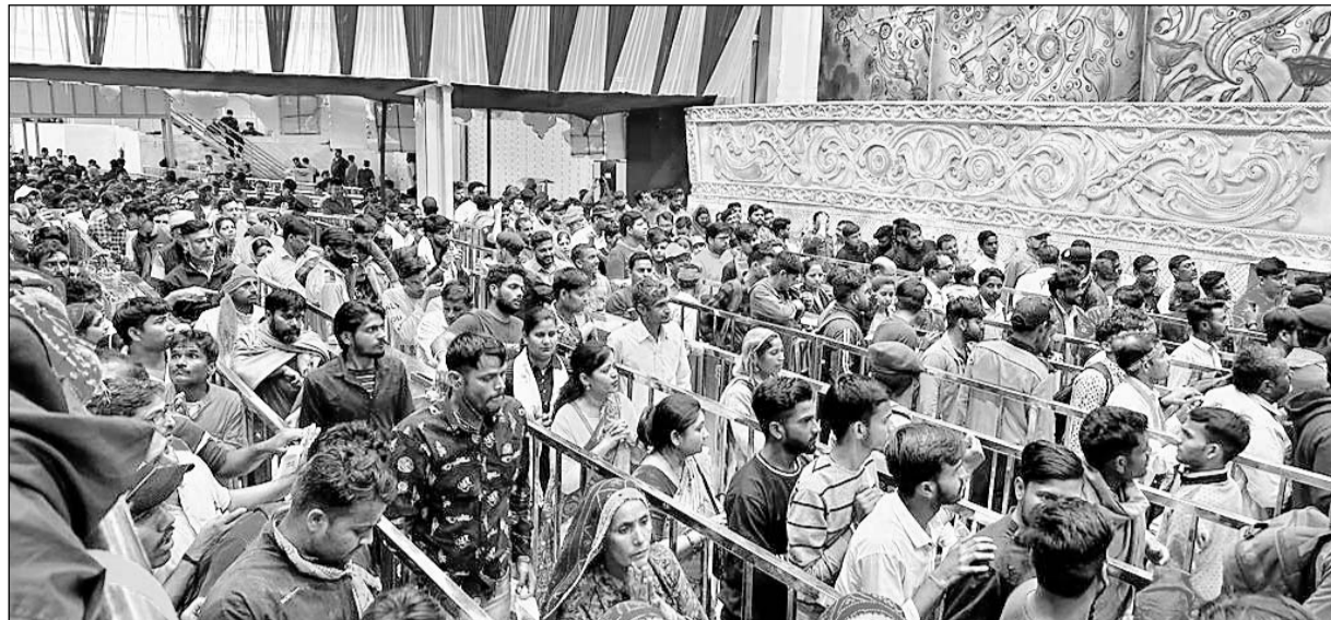
खाटू नगरी में बाबा श्याम के जयकारे दशमी के दिन दिनभर गूंजते रहे।

ने दिन भर कतारबद्ध होकर दर्शन किये। कोई पैदल चलकर, कोई हाथों में निशान लेकर तो कोई दंडवत करता हुआ बाबा के दरबार में हाजिरी लगाने के लिए पहुंचा। रींग से लेकर खाटूश्यामजी तक दर्शनार्थियों की कतारें लगी लगीं। बाबा श्याम के दरबार 24 घंटे भक्तों के लिए खुले हैं। जिससे लगातार बाबा श्याम के दर्शन करने के लिए भक्त खाटू नगरी में पहुंच रहे हैं। खाटूश्यामजी में इस बार निशान रखने के लिए श्री श्याम मंदिर कमेटी ने अलग से व्यवस्था की है। श्री श्याम मंदिर कमेटी द्वारा बनाई गई व्यवस्था में पूरा पंडाल निशानों से अटा हुआ है। बाबा श्याम की लक्ष्मी मेले में