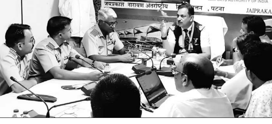
सारण सांसद एवं पूर्व नागरिक विमानन मंत्री राजीव प्रताप रूडी, जो इस ऐतिहासिक आयोजन के मुख्य संयोजक हैं, ने एयरपोर्ट अथॉरिटी के अधिकारियों से बैठक की।

जयपुर। बिहार में पहली बार भारतीय वायुसेना की सूर्य किरण एरोबेटिक टीम का रोमांचक हवाई प्रदर्शन होने जा रहा है। यह आयोजन 23 अप्रैल को वीर कुंवर सिंह शौर्य जयंती के अवसर पर गंगा पथ पर किया जाएगा। इस अभूतपूर्व आयोजन की तैयारियों को अंतिम रूप देने के लिए 1 अप्रैल को पटना जिला पदाधिकारी की अध्यक्षता में एक उच्चस्तरीय समन्वय बैठक पटना सामाहणालय में आयोजित की जाएगी। इस बैठक में वायुसेना, नगर निगम, जिला प्रशासन, यातायात पुलिस, एयरपोर्ट अथॉरिटी, और विभिन्न विभागों के वरिष्ठ अधिकारी उपस्थित रहेंगे। बैठक में सूर्य किरण एरोबेटिक टीम के प्रदर्शन को सुचारू रूप से संचालित करने और सुरक्षा-व्यवस्था को चाक-चौबंद रखने पर विस्तृत चर्चा होगी। सारण सांसद एवं पूर्व नागरिक विमानन मंत्री राजीव प्रताप रूडी, जो इस ऐतिहासिक आयोजन के मुख्य संयोजक हैं, ने बताया कि यह कार्यक्रम बिहार के लिए अत्यंत गौरवशाली क्षण होगा। उन्होंने कहा कि उनके विशेष आग्रह पर रक्षा मंत्री राजनाथ सिंह ने इस आयोजन को स्वीकृति प्रदान की है। यह पहली बार होगा जब बिहार में इस स्तर का हवाई प्रदर्शन आयोजित किया जा रहा है। रूडी ने जानकारी दी कि इस प्रदर्शन में भारतीय वायुसेना के नौ विमान बिहटा एयरफोर्स स्टेशन से उड़ान भरकर गंगा पथ के ऊपर हवाई करतब प्रस्तुत करेंगे। इस दौरान विभिन्न प्रकार के एरोबेटिक मूवमेंट्स किए जाएंगे, जो युवाओं के लिए प्रेरणादायक होंगे और वीर कुंवर सिंह की वीरता को श्रद्धांजलि देंगे। बैठक में आयोजन के दौरान सुरक्षा और भीड़ नियंत्रण की विशेष तैयारियों पर चर्चा होगी। जिला प्रशासन ने यातायात नियंत्रण, पार्किंग व्यवस्था और भीड़ प्रबंधन के लिए विस्तृत कार्ययोजना तैयार की है। रूडी ने बताया कि मुख्यमंत्री नीतीश कुमार को इस