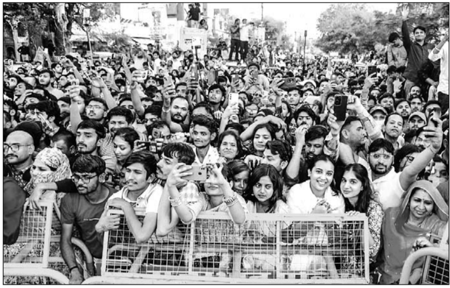
गणगौर माता की सवारी को देखने के लिये जयपुर शहर के परकोटे में श्रद्धालुओं की भीड़ उमड़ पड़ी।

जयपुर। राजस्थान की शाही परंपरा, लोक संस्कृति और आस्था का प्रतीक गणगौर महोत्सव 2025 इस बार और भी भव्यता के साथ मनाया गया। त्रिपोलिया गेट से शाही लवाजमे के साथ निकली गणगौर माता की सवारी ने समूचे शहर को उत्सवमय बना दिया। देशी-विदेशी पर्यटकों की भारी भीड़ इस ऐतिहासिक सवारी को देखने के लिए उमड़ी और राजस्थान की समृद्ध सांस्कृतिक विरासत को नजदीक से अनुभव किया।