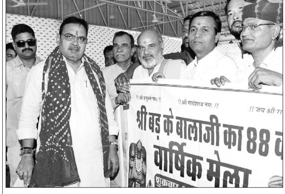
मुख्यमंत्री भजनलाल शर्मा ने सोमवार को उनके निवास पर श्री बड़ के बालाजी के 88वें वार्षिक मेले के पोस्टर का विमोचन भी किया।