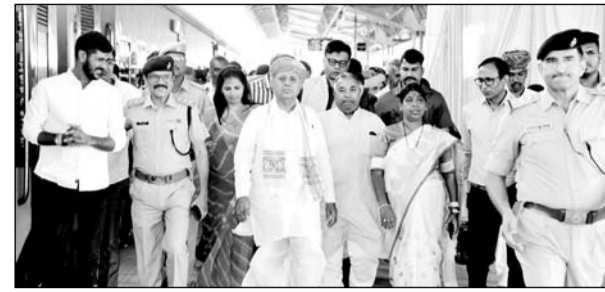
रेल यात्रियों को सोगात की कड़ी में नई रेल सेवा का शुभारंभ विधायक अजमेर (दक्षिण) अनिता भदेल की उपस्थिति में हुआ।

अजमेर, (कासं)। रेल यात्रियों को सोगात की कड़ी में गाड़ी संख्या 15091/15092, दौराई-टनकपुर-दौराई नई रेल सेवा का शुभारंभ दिनांक 31 मार्च 2025 को मुख्य अतिथि माननीय केंद्रीय कृषि एवं किसान कल्याण राज्य मंत्री भारत सरकार भागीरथ चौधरी द्वारा माननीया विधायक अजमेर (दक्षिण) अनिता भदेल की गरिमामयी उपस्थिति में दौराई स्टेशन पर किया गया। वरिष्ठ मंडल वाणिज्य प्रबंधक बीसीएस चौधरी के अनुसार दौराई स्टेशन पर आयोजित इस कार्यक्रम के अंतर्गत फूलों से सुसज्जित गाड़ी संख्या 15091 दौराई- टनकपुर को अतिथियों द्वारा मंडल रेल प्रबंधक राजू भूतड़ा सहित अन्य रेल अधिकारियों, कर्मचारियों व आमजन की उपस्थिति में 16.05 बजे हरी झंडी दिखाकर रवाना किया गया। इस अवसर पर माननीय केंद्रीय कृषि एवं किसान