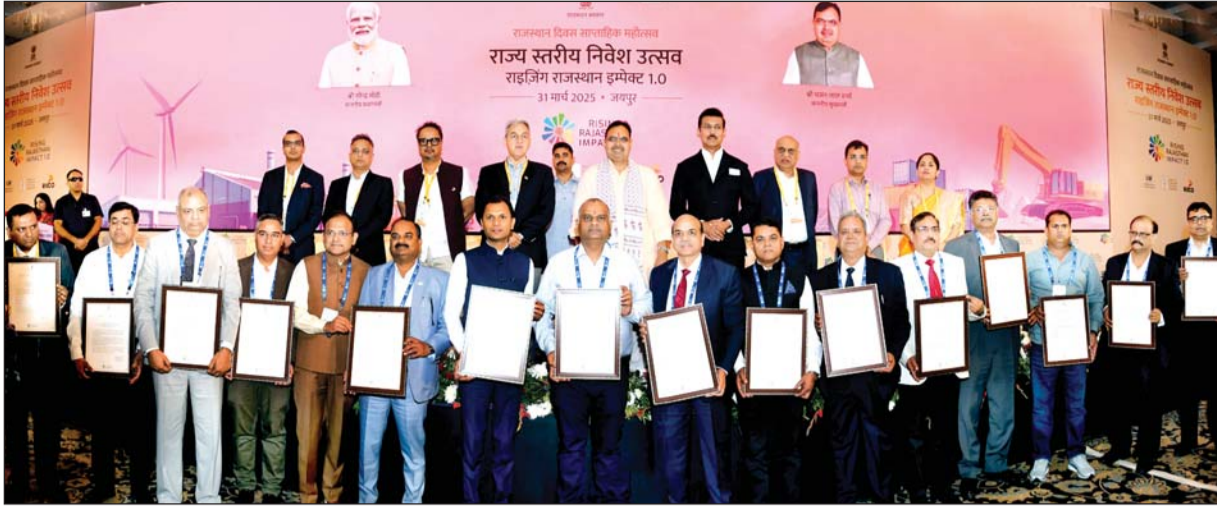
मुख्यमंत्री भजनलाल शर्मा ने जयपुर में निवेश उत्सव कार्यक्रम को संबोधित किया और बताया कि 3 लाख करोड़ से ज्यादा के निवेश प्रस्तावों पर काम शुरू हो गया है।