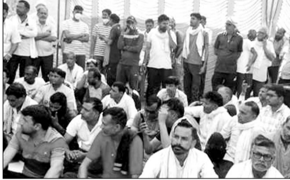
हड़ताल पर बैठे रोड़वेज कर्मचारी।

करौली, (निं.सं.)। कैलादेवी मे चल रहे चैत्र नवरात्रि मेले के दौरान राजस्थान रोड़वेज कि बस सेवा पूरी तरह से ठप हो गई है। रोड़वेज कर्मचारियों ने ओवरटाइम और ड्यूटी भत्ते में कटौती के विरोध में हड़ताल शुरू कर दी जिससे पुलिस और प्रशासन के अधिकारियों ने हडकंप मच गया वही जिला प्रशासन,रोड़वेज प्रबंधन जयपुर से आये अधिकारियों कि समझाईश के बाद चालक परिचालक मान गये और 6 घंटे बाद पुनः बसों का संचालन शुरू कर दिया।