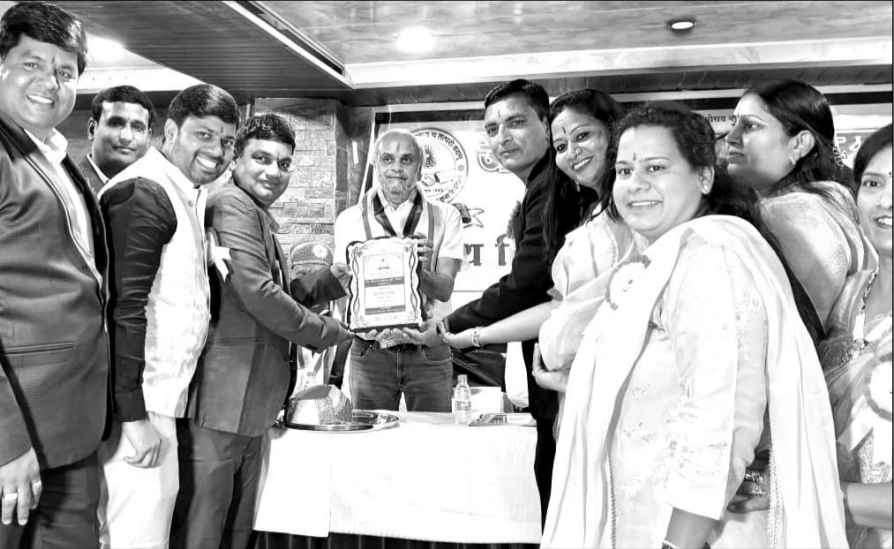
सनातन नववर्ष, चैत्र नवरात्रि पर आयोजित कार्यक्रम में गणमान्य नागरिक व प्रतिभावन जनो का सम्मान किया।