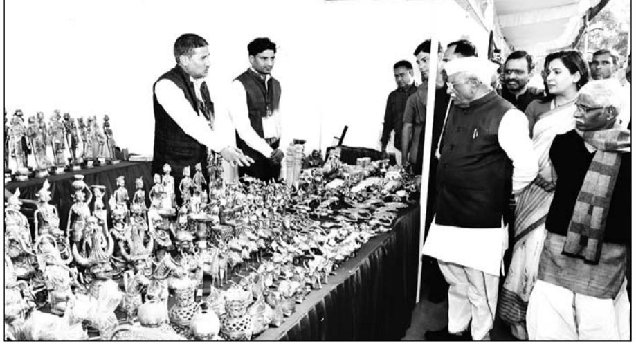
राज्यपाल हरिभाऊ किसनराव बागडे ने जवाहर कला केंद्र के शिल्प ग्राम में जनजातीय कार्य मंत्रालय, भारत सरकार, ट्राइफेड द्वारा आयोजित “आदि महोत्सव” का शुभारम्भ किया।

राज्यपाल ने आदिवासी परंपराओं के संरक्षण पर जोर देते हुए प्रकृति पोषण से जुड़े उनके कार्य अपनाए जाने की आवश्यकता जताई। उन्होंने जनजातियों के समग्र विकास के लिये उनसे जुड़े क्षेत्र की आवश्यकताओं को ध्यान में रखकर उनके आजीविका के अधिकाधिक अवसर प्रदान करने की आवश्यकता जताई। उन्होंने कहा कि देश की गरीबी तभी कम होगी जब राष्ट्र