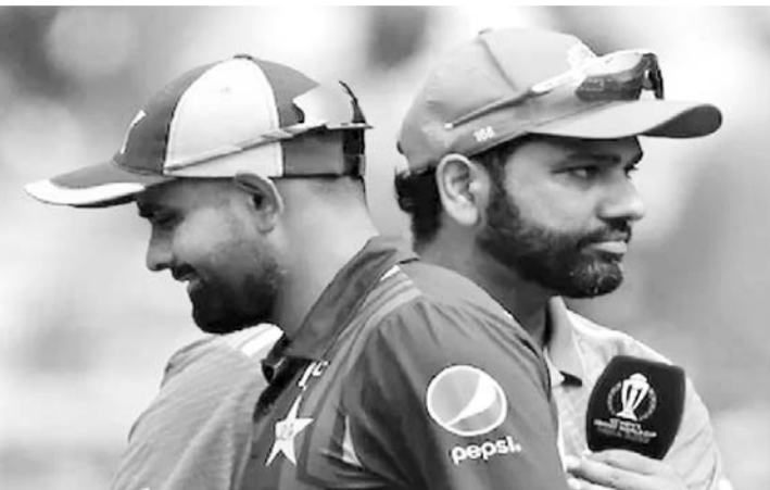
बोर्ड के अनुसार, पाकिस्तान में सुरक्षा के संबंधित दिक्कतें हैं, इसलिए टीम पाकिस्तान को लंबे समय से प्रतीक्षित कार्यक्रम को लेकर मुख्य चर्चा करने वाली है तो दूसरी ओर भारत सरकार की ओर से पहली बार पूरे मामले पर बयान आया है। चैम्पियंस ट्रॉफी की मेजबानी पाकिस्तान के पास है और बीसीसीआई ने आईसीसी को बता दिया है कि वह टीम को पाकिस्तान नहीं भेजेगा।

नई दिल्ली, 29 नवम्बर। चैम्पियंस ट्रॉफी को लेकर आईसीसी की आज अहम बैठक कर रही है। जिसमें अगले साल होने वाली चैम्पियंस ट्रॉफी के लंबे समय से प्रतीक्षित कार्यक्रम को लेकर मुख्य चर्चा करने वाली है तो दूसरी ओर भारत सरकार की ओर से पहली बार पूरे मामले पर बयान आया है। चैम्पियंस ट्रॉफी की मेजबानी पाकिस्तान के पास है और बीसीसीआई ने आईसीसी को बता दिया है कि वह टीम को पाकिस्तान नहीं भेजेगा। पाकिस्तान दूसरी तरफ टूर्नामेंट को हाइब्रिड मॉडल के तहत आयोजित नहीं करने पर अड़ा हुआ है। आईसीसी बोर्ड की बैठक वरुअल तरीके से होगी और इसमें चैम्पियंस ट्रॉफी के कार्यक्रम को लेकर कोई हल निकलने की संभावना है। आईसीसी के फैसले से ठीक पहले भारत के विदेश मंत्रालय के प्रवक्ता रणधीर जयसवाल ने एक लाइन में बड़ा बयान दिया है। उन्होंने साफ-साफ लहजे में कहा कि, बीसीसीआई ने बयान जारी किया है।