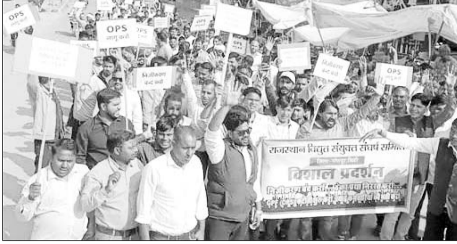
निजीकरण के विरोध में रैली निकालते बिजली कर्मचारी ।