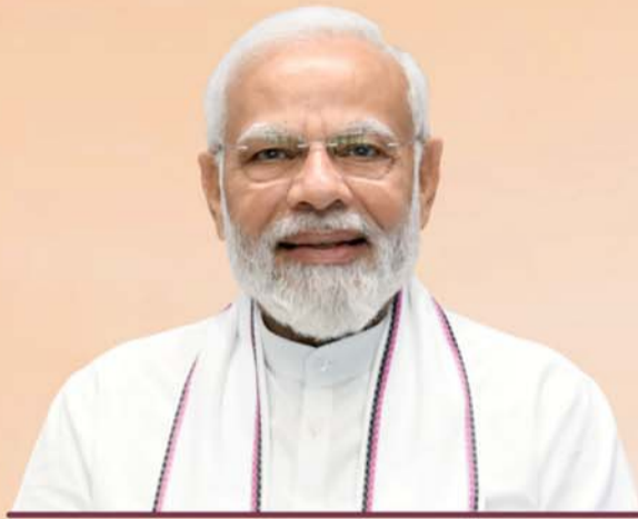
श्री नरेन्द्र मोदी माननीय प्रधानमंत्री