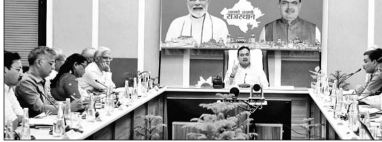
मुख्यमंत्री भजनलाल शर्मा ने सोमवार को उनके निवास पर राजस्थान दिवस के उपलक्ष्य पर आयोजित होने वाले कार्यक्रमों के संबंध में समीक्षा बैठक को संबोधित किया।

जयपुर। मुख्यमंत्री भजनलाल शर्मा ने कहा कि प्रधानमंत्री नरेंद्र मोदी की मंशानुरूप राज्य सरकार चार जातियों किसान, युवा, महिला एवं गरीब के कल्याण एवं उत्थान एवं आमजन के लिए एजेंड गवर्नेंस के क्रम में राजस्थान दिवस (30 मार्च, चैत्र शुक्ल प्रतिपदा) बृहद् स्तर पर मना रही है। उन्होंने कहा कि प्रदेश का प्रत्येक नागरिक राजस्थान दिवस के कार्यक्रमों में उत्साह एवं उमंग के साथ भाग ले और राजस्थान को विकसित प्रदेश बनाने के लिए समर्पण एवं सेवा-भाव से कार्य करें।