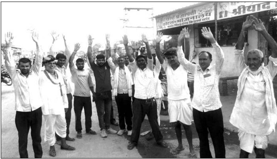
आसींद रघुनाथपुर की ढाणी में ग्राइंडिंग मिनरल से निकलने वाले धूल से परेशान ग्रामीणों ने विरोध प्रदर्शन किया।

आसीन्द, (निंसें)। आसींद थाना क्षेत्र के आमली खेड़ा अजीतपुरा रघुनाथपुरा की ढाणी में लगभग 10 से 12 ग्राइंडिंग मिनरल से निकलने वाली धूल के कारण ग्रामीणों को खासी परेशानी का सामना करना पड़ रहा है।