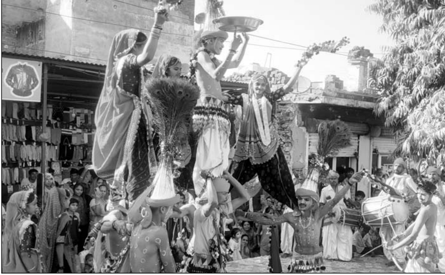
बाबा खाटू श्याम के जन्मोत्सव पर निशान यात्रा के दौरान लोक कलाकार प्रस्तुतियां देते।

कलाकारों के साथ सेल्फी लेने की होड़ मची रही। निशान यात्रा के दौरान मुख्य मार्ग में जगह-जगह आकर्षक रंगोली सजावटी गयी। निशान यात्रा के स्वागत के लिए मार्ग में जगह-जगह तोरण द्वार बनाए गए नागरिकों ने यात्रा पर पुष्प वर्षा की। बाबा श्री खाटू श्याम के विग्रह स्वरूप की श्रद्धालुओं ने पूजा अर्चना कर सभी के लिए सुख समृद्धि की कामना की। मुख्य बाजारों में लोक कलाकारों के प्रदर्शन के लिये स्टेज बनाये गये जिस पर कलाकारी द्वारा मोहक प्रस्तुतियां दी गई जिसे देखने के लिए भीड़ उमड़ पड़ी। शहर के प्रमुख मार्गों से नगर भ्रमण करते हुए शाम को निशान यात्रा के तेजा चौक पहुंची। श्री लखदातार सेवा मित्र मंडल के द्वारा 2.51 किलो मावे का केक काटा गया केक के प्रसाद को श्रद्धालुओं में वितरित किया गया। इस अवसर पर आकर्षक आतिशबाजी की गई।