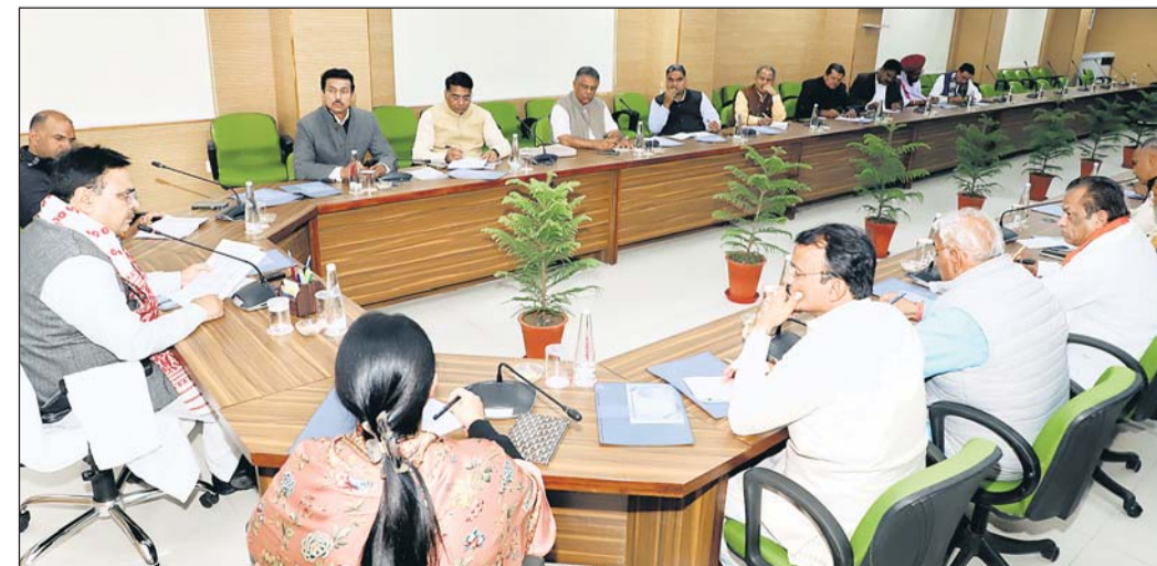
मुख्यमंत्री भजनलाल शर्मा ने अपने मंत्रिमंडल के सदस्यों को लंच दिया। लंच से पहले उन्होंने मंत्रिमंडल की अनौपचारिक बैठक भी ली।