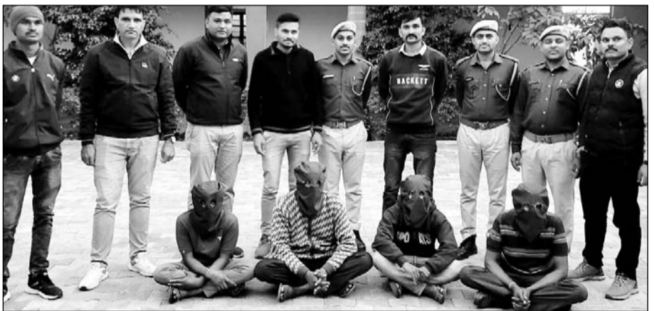
ठगी व लूट की वारदात करने वाली अंतर्राज्यीय गैंग को सदस्यों को पुलिस ने गिरफ्तार किया।

■ बांसवाड़ा, (निर्स)। बांसवाड़ा व डूंगरपुर जिलों में असली नोट के बदले से तीन गुना नकली नोट देने वाले अंतर्राज्यीय गैंग का पर्दाफाश करते हुए पुलिस ने डूंगरपुर जिले के दो होमगार्ड जवानों सहित पांच जनों को गिरफ्तार किया है।