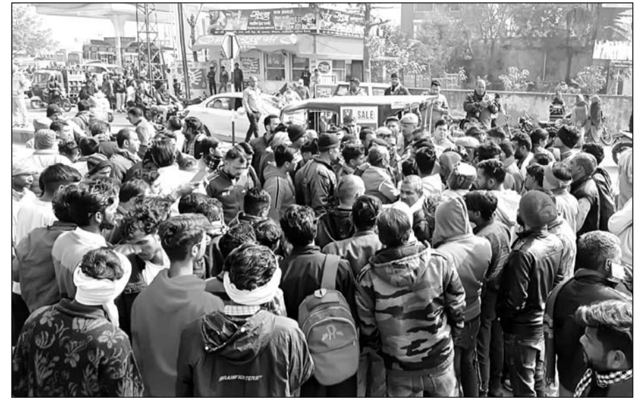
मांगों को लेकर लोगों ने शव के साथ प्रदर्शन किया।

गुस्साये माली समाज के लोगों ने शव के साथ प्रदर्शन करते हुये रोड जाम कर दिया