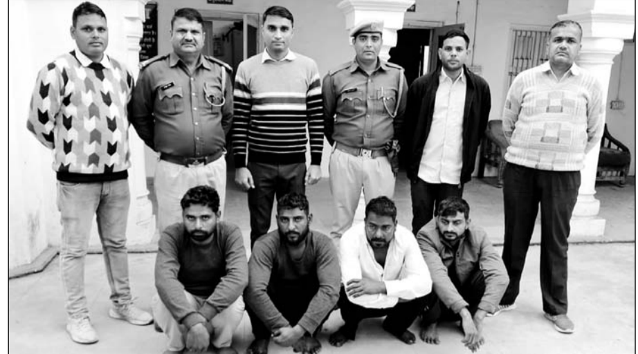
कोटपूतली पुलिस ने ए.टी.एम. लूट के चार आरोपियों को गिरफ्तार किया।

अन्तर्राज्यीय गैंग के चार शातिर बदमाश गिरफ्तार