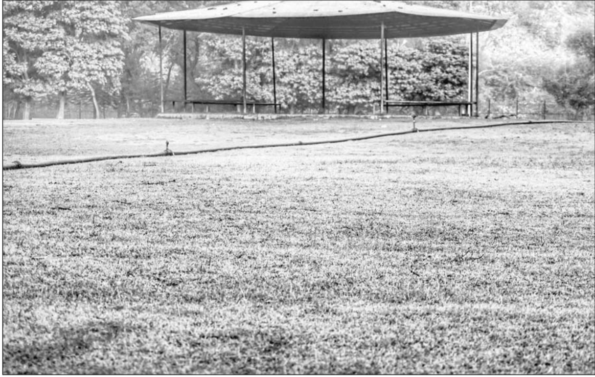
जयपुर में रविवार को जब कोहरा हटा तो विद्याधर नगर के स्वर्ण जयंती पार्क में ओस की बूंदें जमी हुई नजर आईं।

पश्चिमी विक्षोभ सक्रिय होने से मौसम विभाग ने जारी किया अलर्ट