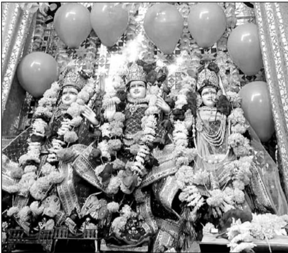
दातापति हनुमान मन्दिर में श्रृंगारित राम दरबार।