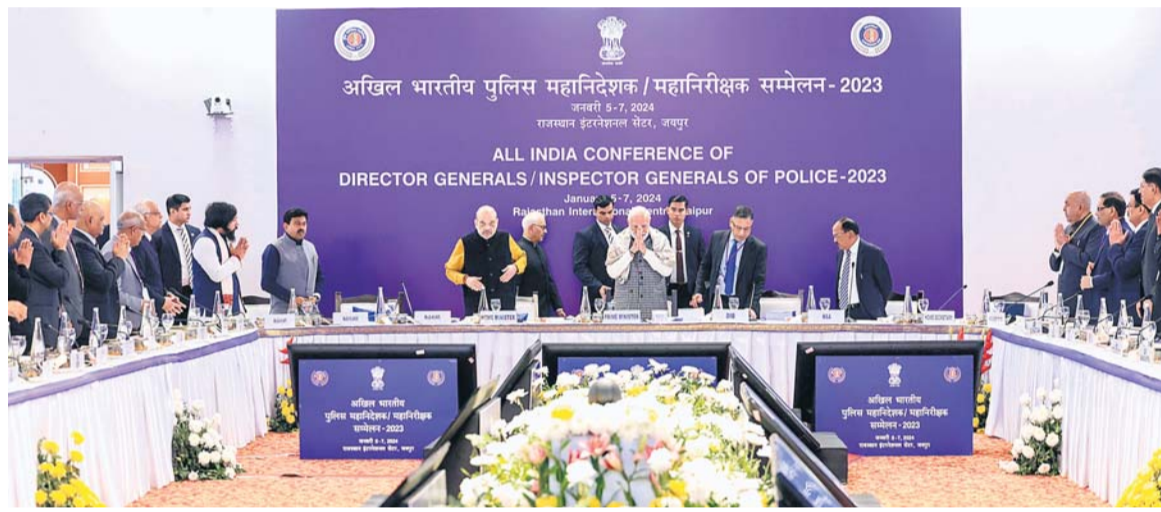
प्रधानमंत्री नरेन्द्र मोदी ने 58वीं डीजी-आईजी कॉन्फ्रेंस के समापन समारोह को संबोधित किया।

प्रधानमंत्री मोदी ने जयपुर के झालाना स्थित राजस्थान इंटरनेशनल सेंटर में आयोजित तीन दिवसीय 58 वीं डीजी-आईजी कॉन्फ्रेंस के समापन समारोह को संबोधित किया