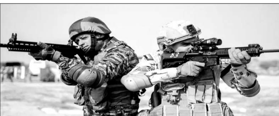
भारत व यूएई के सैनिकों ने एशिया की सबसे बड़ी युद्धाभ्यास स्थली महाजन फील्ड फायरिंग रेंज में संयुक्त युद्धाभ्यास किया।

काफी समय से चल रहे रूस-यूक्रेन और हमास-इजरायल युद्ध से सामने आई रणक्षेत्र की नई चुनौतियों को लेकर इस संयुक्त युद्धाभ्यास में धोरों में यह अभ्यास होता है। कई बार यह अगस्त-सितम्बर के गर्मी के मौसम में भी अभ्यास करते हैं। एशिया की सबसे बड़ी युद्धाभ्यास नोड महाजन फील्ड फायरिंग रेंज है। करीब 3.37 लाख एकड़ में फैली रेंज को गाँवों को खाली कर बनाया गया था। इसमें बने पुराने बने मकान आदि अभ्यास में काम आते हैं। भारत और यूएई की सेना संयुक्त युद्धाभ्यास डेजर्ट साइकलोन 2 से 15 जनवरी तक महाजन रेंज में चल रहा है। यूएई की जायेद फर्स्ट ब्रिगेड के 45 सैनिक और भारत की