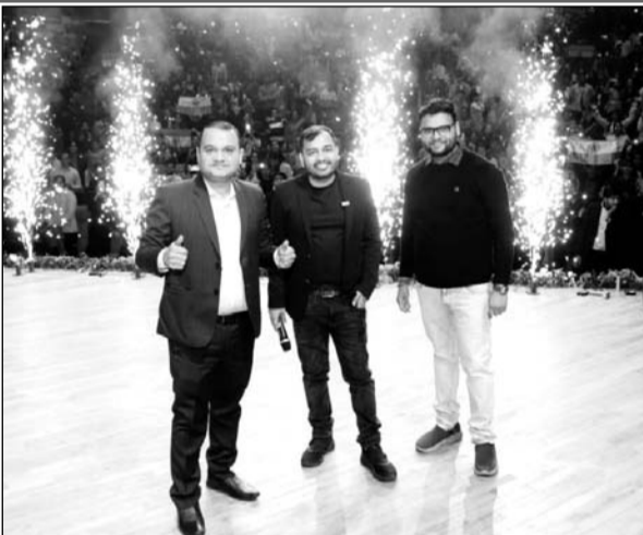
फिजिक्सवाला-विद्यापीठ जोधपुर पाँवडंबाय उत्कर्ष क्लासेस द्वारा मीट-अप कार्यक्रम आयोजित हुआ।