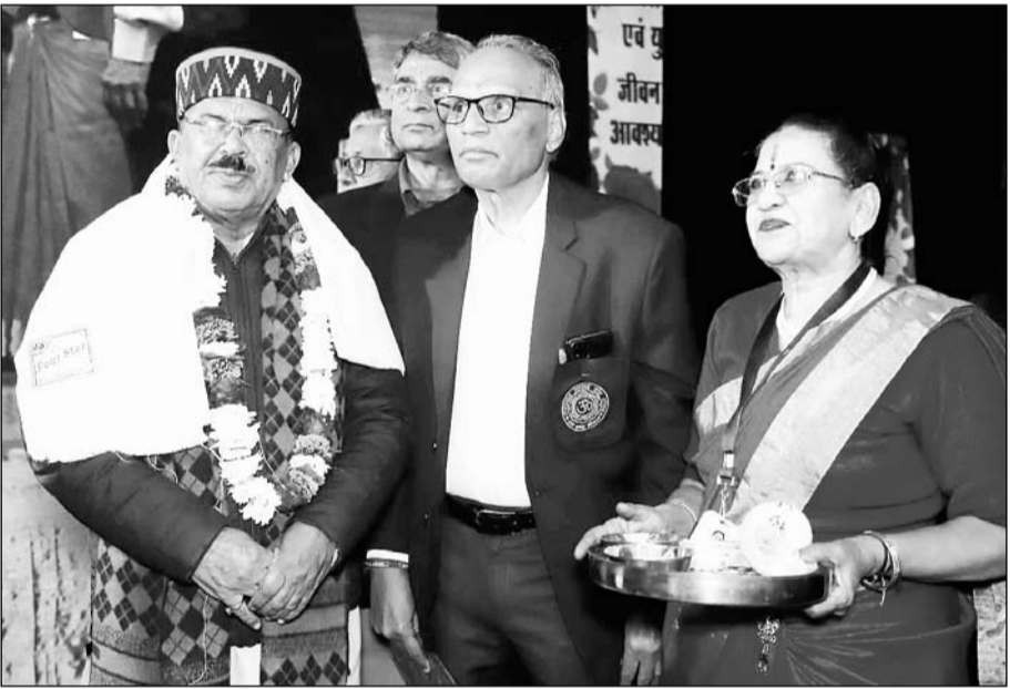
विधानसभा अध्यक्ष देवनानी का रविवार को जयपुर के राष्ट्रीय आयुर्वेद संस्थान में आयोजित यज्ञ, योग एवं युक्ताहार नववर्ष सम्मेलन में स्वागत किया गया।

देवनानी ने बताया कि भारत विश्व गुरु है व भारत की परंपराएं समृद्ध और वैज्ञानिक दृष्टि से सही हैं। उन्होंने कहा कि सांस्कृतिक, आध्यात्मिक दृष्टि से राष्ट्र समृद्ध है। हम सभी लोगों को निरोगी राष्ट्र बनाने के लिए योग, यज्ञ और संतुलित आहार को अपनाना होगा। योग स्वास्थ्य के लिए आवश्यक है और इसे जीवन का अंग बनाने कि आवश्यकता है। भारत का जीवन आदर्श है इसलिए