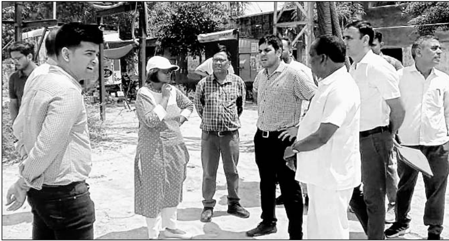
बीकानेर कलेक्टर नम्रता वृष्णि ने अधिकारियों के साथ सर्कल्स, चौराहों और मुख्य मार्गों का अवलोकन किया।

साथ ही व्यास कॉलोनी स्थित डाउनसायर पार्क का अवलोकन भी किया। उन्होंने कहा कि शहर के ऐसे सार्वजनिक उद्यानों के प्रतिनिधियों की बैठक बुलाई जाए तथा इन उद्यानों को