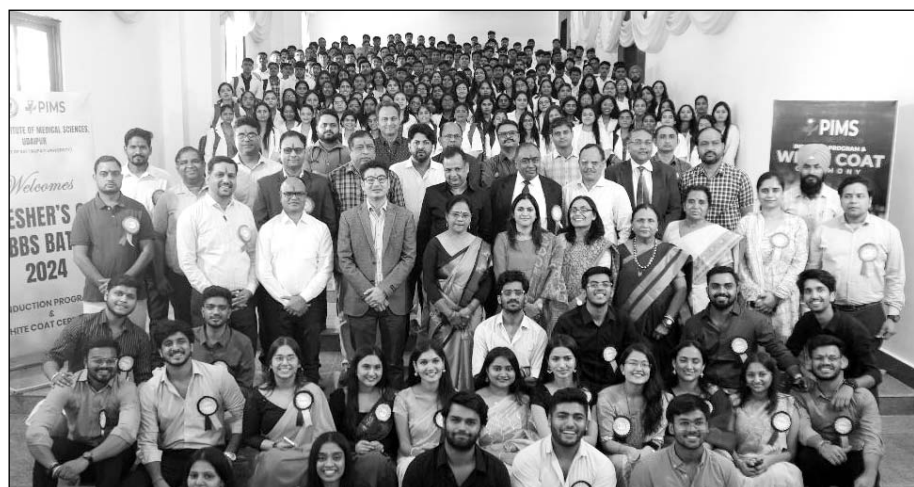
पेसिफिक में एम.बी.बी.एस. विद्यार्थियों का स्वागत एवं वाइट कोट सेरेमनी में उपस्थित विद्यार्थी।

उदयपुर, (कास)। पेसिफिक इंस्टिट्यूट ऑफ मेडिकल साइंसेस, उमरडा में नये एम.बी.बी.एस. विद्यार्थी 2024 का प्रेरण कार्यक्रम और वाइट कोट समारोह का सफलतापूर्वक आयोजन किया गया। पेसिफिक इंस्टिट्यूट ऑफ मेडिकल साइंसेस में अभी तक 150 एम.बी.बी.एस. विद्यार्थी प्रतिवर्ष भर्ती होते थे। इस वर्ष एम.सी. द्वारा एम.बी.बी.एस. में 200 सीटें दी गयीं हैं। यह संस्थान के लिये गर्व का विषय है।