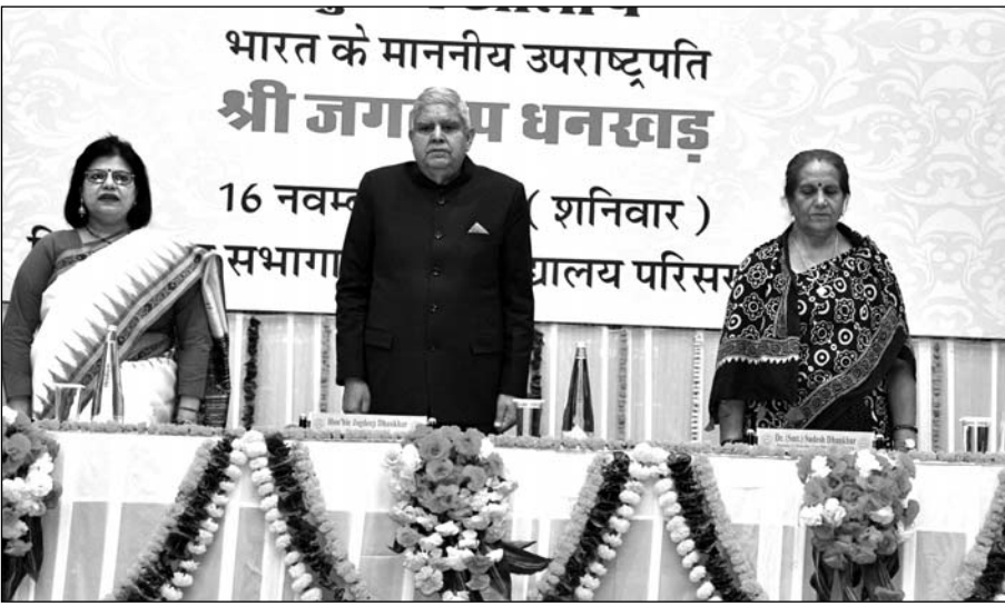
सुखाड़िया विश्वविद्यालय में आयोजित कार्यक्रम में उपस्थित विद्यार्थियों को संबोधन दिया।

उन्होंने कहा कि शिक्षक ही किसी संस्थान की रीढ़ होते हैं और उन्हीं की वजह से उन संस्थानों का नाम भी होता है। युवा विद्यार्थियों का आव्हान करते हुए उन्होंने कहा कि वे देश के असली कर्णधार हैं। भविष्य के निर्माता हैं। इसलिए सकारात्मक ऊर्जा के साथ नवाचारों और तकनीक के साथ आगे बढ़ें। उन्होंने कहा कि भारत चार टिलीयन डॉलर की इकोनॉमी के साथ विश्व की पाँचवीं बड़ी अर्थव्यवस्था बन गया है जहाँ 8 प्रतिशत की प्रोथेरेट है। वैश्विक संस्थानों की गुणवत्ता और तकनीकी उन्नति के साथ बढ़ते डिजिटलइजेशन का जिम्मा करते हुए उन्होंने कहा कि अब हम आर्थिक महाशक्ति बनने की ओर अग्रसर हो रहे हैं। क्योंकि बीते एक दशक में भारतीय अर्थव्यवस्था विश्व की सशक्त अर्थ व्यवस्था बनकर उभरी है, जहाँ पर हर साल 8 नए एयरपोर्ट एं हर 2 साल में तीन चार ईंधन मेट्रो, प्रतिदिन 28 किलोमीटर हाईवे और बारह किलोमीटर नया रेलवे ट्रैक बिछाया जा रहा है। बिजली उत्पादन, सौर ऊर्जा, गैस हर क्षेत्र में आत्मनिर्भरता बढ़ रही है। अच्छे स्वास्थ्य और अफोर्टेबल घरों का निर्माण अब सपना नहीं रहा है। हर व्यक्ति को सुविधाएँ प्राप्त हो रही हैं और मानवीय मूल्यों के साथ संसाधनों का समुचित इस्तेमाल करके ही हम सशक्त बन रहे हैं।