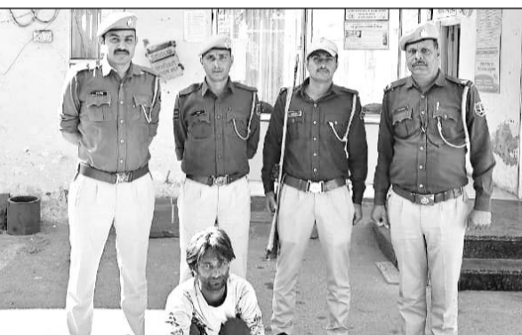
व्यापारी के बैग से रुपये चोरी करने के मामले में आरोपी को पकड़ा