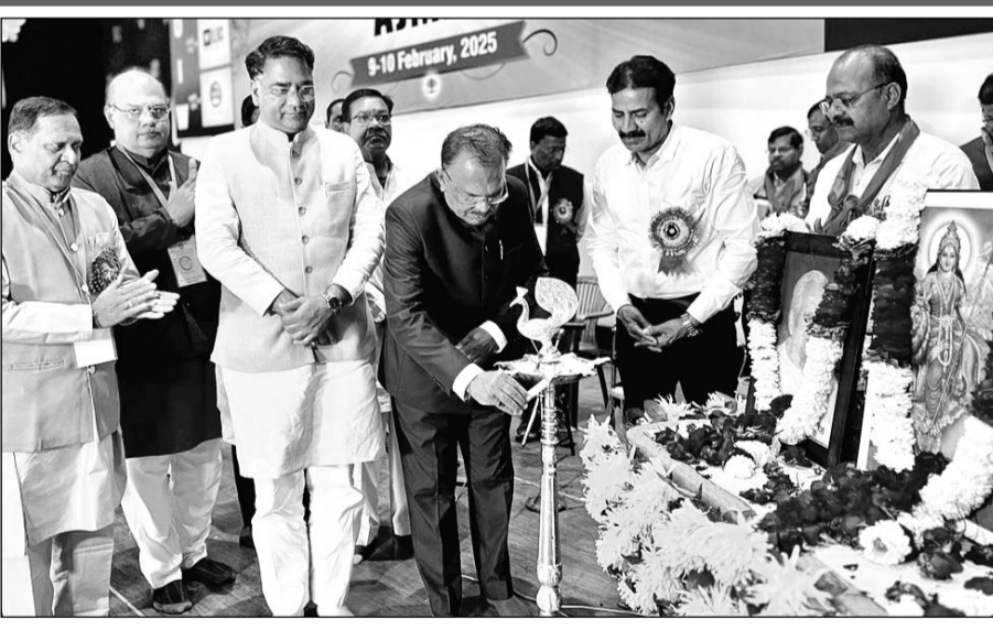
राजस्थान विधानसभा अध्यक्ष वासुदेव देवनानी ने नेशनल ऑर्गेनाइजेशन ऑफ इंड्योरेंस वर्कर्स की 19वीं त्रैवार्षिकी ऑल इण्डिया कॉन्फ्रेंस का शुभारंभ किया।

जयपुर। विधानसभा अध्यक्ष वासुदेव देवनानी ने कहा है कि आज का भारत एक वृहद दृष्टिकोण के साथ आगे बढ़ रहा है। हम विश्वगुरु थे और रहेंगे। प्रधानमंत्री नरेन्द्र मोदी के नेतृत्व में आज पूरे विश्व में भारत की अलग पहचान है। वर्ष 2047 तक हम निश्चित रूप से विकसित भारत बन जाएंगे। नेशनल ऑर्गेनाइजेशन ऑफ इंड्योरेंस वर्कर्स की 19वीं त्रैवार्षिकी ऑल इण्डिया कॉन्फ्रेंस अजमेर में आयोजित हुई। इसमें पूरे देश के भारतीय जीवन बीमा निगम के कार्मिकों ने भाग लिया। अधिवेशन को सम्बोधित करते हुए विधानसभा अध्यक्ष वासुदेव देवनानी ने कहा कि देश एक वृहद विजन के साथ आगे बढ़ रहा है। वर्ष 2047 तक हम निश्चित रूप से एक विकसित राष्ट्र बन जाएंगे। प्रधानमंत्री नरेन्द्र मोदी ने देश को जो सशक्त बनाया है वह हमें पूरी दुनिया में सबसे मजबूत और शक्तिशाली बना रहा है। उन्होंने एलआईसी कार्मिकों का आवाहन किया