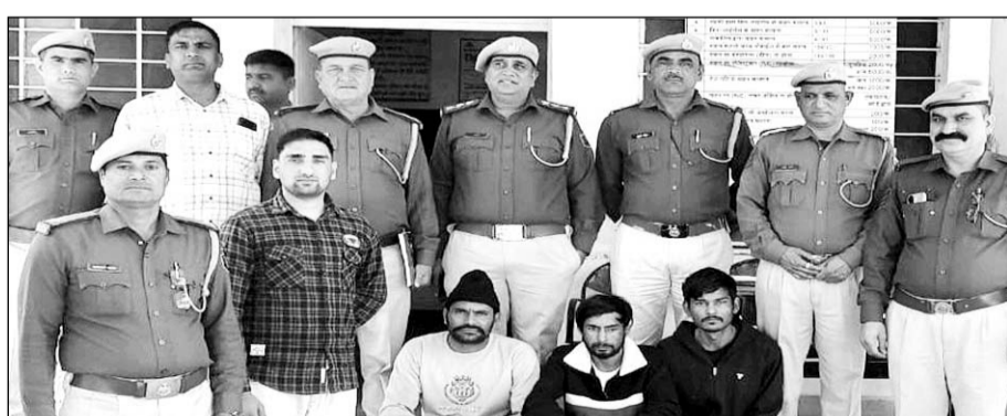
झालावाड़ जिले में कोतवाली थाना पुलिस ने आरोपियों को गिरफ्तार किया।