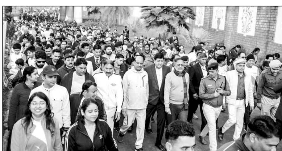
"वॉक-ओ-रन 2025" में लोकसभा अध्यक्ष ओम बिरला सहित अधिकारी व आमजन शामिल हुए।

कोटा, (निर्स)। कोटा शहर में रविवार के दिन दो अलग-अलग दौड़ का आयोजन किया गया। रविवार की सुबह का सूरज एक अलग ऊर्जा लेकर उदय हुआ। इस ऊर्जा में अपने और अपने परिवार की सेहत के प्रति जागरूकता थी तो देशभर से कोटा में आकर पढ़ने वाले कोचिंग स्टूडेंट्स की सेवा के लिए समर्पण शामिल था। इसके साथ ही एक दौड़ पुरुष के सम्मान में भी आयोजित की गई। टीम हार्टवाईज द्वारा हेल्थ और हेप्पीनेस के संकल्प के साथ देश का सबसे बड़ा इवेंट "वॉक-ओ-रन 2025" सुबह हुआ, जिसमें देश-विदेश से मैराथन रनर्स के साथ 40 हजार से अधिक शहरवासी शामिल हुए।