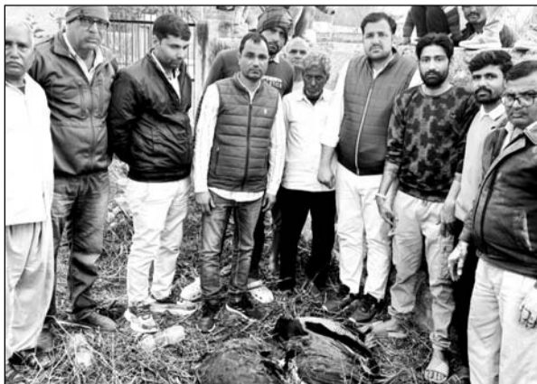
मृत मोर मिलने पर लोगों ने आक्रोश जताया।