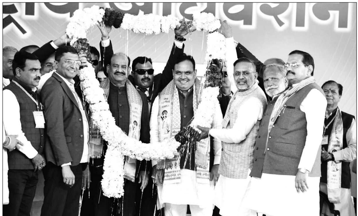
कोटा में लोकसभा अध्यक्ष ओम बिरला और मुख्यमंत्री भजनलाल शर्मा के मुख्य आतिथ्य में धाकड़ समाज का दो दिवसीय खुला अधिवेशन आयोजित हुआ। धाकड़ महासभा के राष्ट्रीय अध्यक्ष रोडमल नागर ने कार्यक्रम की अध्यक्षता की।

इस अवसर पर लोकसभा स्पीकर ओम बिरला ने कहा कि भारत को आगे