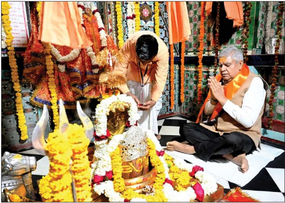
उपराष्ट्रपति डॉ. जगदीप धनखड़ ने चित्तौड़गढ़ में अखिल मेवाड़ क्षेत्र जाट समाज महासभा संस्थान के मातृकुंडिया धाम में महादेव के नवीन मंदिर प्रतिष्ठा महोत्सव में भाग लिया और पूजा-अर्चना की।

उपराष्ट्रपति धनखड़ ने मातृकुंडिया में महादेव के नये मंदिर के प्राण प्रतिष्ठा महोत्सव में भाग लिया