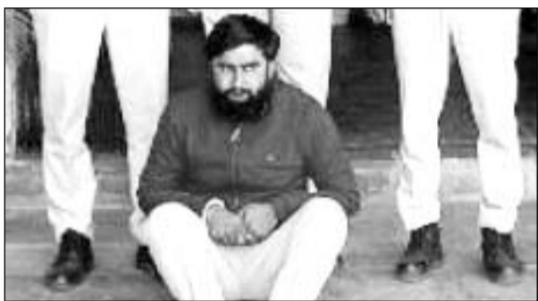
दूध में मिलावट के मामले में पुलिस ने एक जने को गिरफ्तार किया।

ली थी। उन्होंने आमजन से अपील की थी कि क्षेत्र में किसी भी प्रकार का कोई अपराध घटित होता है तो उसकी सूचना तुरन्त पुलिस को दें।