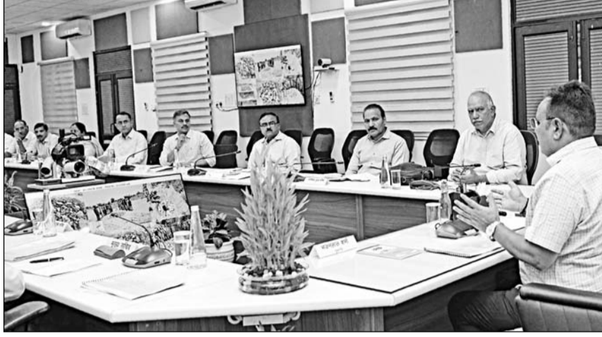
मुख्यमंत्री भजनलाल शर्मा ने वंदे गंगा जल संरक्षण-जन अभियान, जल संचय जन भागीदारी 2.0 और कर्मभूमि से मातृभूमि अभियान को लेकर रविवार को उच्च स्तरीय बैठक ली।

-कार्यालय संवाददाता- जयपुर। मुख्यमंत्री भजनलाल शर्मा ने कहा कि वंदे गंगा जल संरक्षण जन अभियान को केवल सरकारी कार्यक्रम तक सीमित न रखकर गांव-गांव तक पहुंचाया जाए और जन आंदोलन बनाया जाए। उन्होंने कहा कि जल संचय को बढ़ावा देने में यह अभियान महत्वपूर्ण कड़ी है। इसलिए शहरों से लेकर ग्राम स्तर तक आमजन एवं प्रशासन की भागीदारी इस अभियान में सुनिश्चित की जाए। मुख्यमंत्री ने रविवार को मुख्यमंत्री निवास पर वंदे गंगा जल संरक्षण-जन अभियान, जल संचय जन भागीदारी 2.0 और कर्मभूमि से मातृभूमि अभियान को लेकर उच्च स्तरीय बैठक ली।