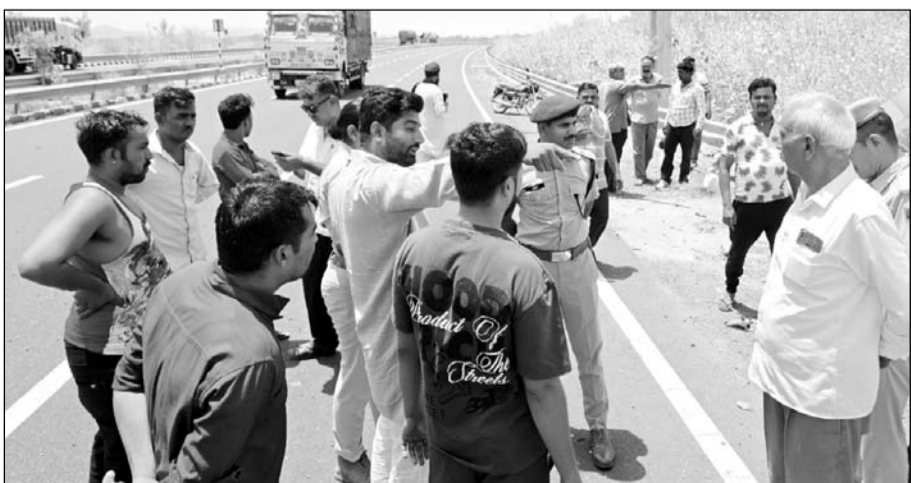
पुलिस टीम ने मौके पर जाकर घटना की जानकारी ली।

जसोल थाना क्षेत्र में आसोतरा के पास भारतमाला एक्सप्रेस-वे पर हुआ हादसा