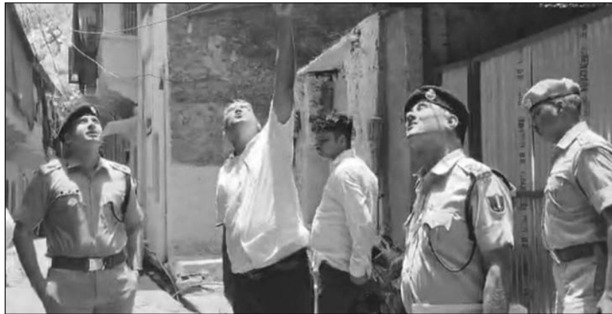
लूट की वारदात के बाद पुलिस टीम ने घटना स्थल का जायजा लिया।

■ बदमाश घर में रखे सोने-चांदी के जेवरत से भरे 7 से 8 पीपे और करीब 10 लाख रुपए की नकदी ले गये