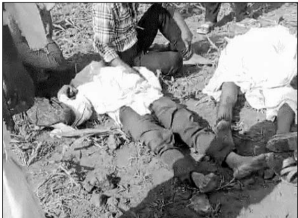
नगरफोर्ट थाना क्षेत्र में खेत पर चारा काटते समय करंट लगने से पिता-पुत्र की मौत हो गई।

करीब एक घंटे बाद मृतक की पत्नी खेत पर चारा लेने पहुंची तो उसने पति और बेटे को जमीन पर बेसुध पड़ा देखा। चिल्लाने की आवाज सुनकर