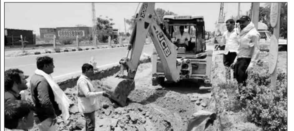
सूचना मिलते ही एस्केएन गैस कंपनी की इमरजेंसी टीम घटनास्थल पर पहुंची।

नाला खुदाई करते समय हुई घटना, इमरजेंसी टीम घटनास्थल पहुंची, स्थिति नियंत्रित