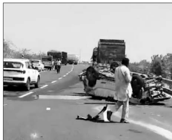
भारतमाला एक्सप्रेस-वे पर हुये हादसे में कार पलटी खा गई।