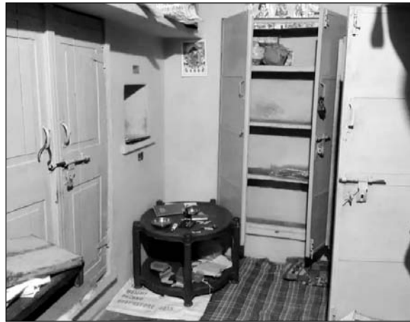
घर को निशाना बनाकर लूट की वारदात को अंजाम दिया गया।

पत्नी छत से नीचे पहुंचे तो अंदर से गेट बंद मिला। काफी मशक्कत के बाद गेट तोड़कर अंदर पहुंचे, तब तक बदमाश सामान लेकर भाग रहे थे। परिवार ने बदमाशों को हाथों में पीपे लेकर भागते हुए देखा। बताया जा रहा है कि बदमाशों ने आसपास के कुछ मकानों के ताले भी तोड़ दिए, जिससे पूरे कस्बे में भय का माहौल बन गया। घटना की सूचना