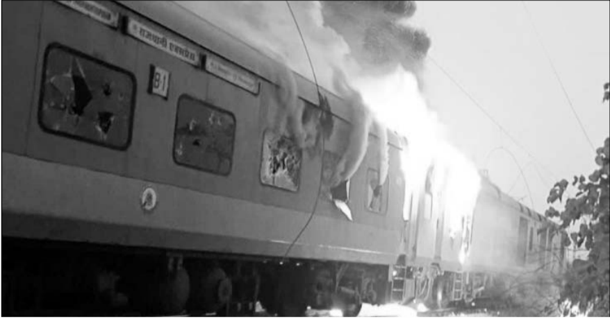
ट्रेन का थर्ड एसी और एएसएलआर कोच जलकर पूरी तरह खाक हो गए।