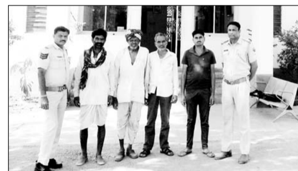
जिला पुलिस की गिरफ्त में फरार आरोपी।