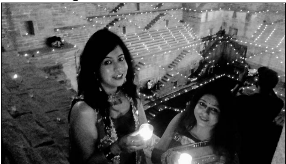
दीपोत्सव को लेकर जोधपुर शहर में दीपकों से आकर्षक रोशनी की बड़ी

गोवर्धन पूजा 14 नवंबर को की जाएगी और इसके बाद भैयादूज का पर्व 15 नवंबर को मनाया जाएगा। गोवर्धन पूजा साथ ही शहर के मंदिरों में अत्रकृत महात्सव शुरू हो जाएंगे। वहीं भाई दूज पर बहनें अपने भाइयों के माथे पर तिलक लगाकर उनकी लंबी आयु और सुख-समृद्धि की कामना करेंगी। भविष्य पुराण में वर्णन है कि इस दिन यमुना ने अपने भाई यम को अपने घर पर भोजन करने के लिए आमंत्रित किया था। तभी से यह परंपरा चली आ रही है।