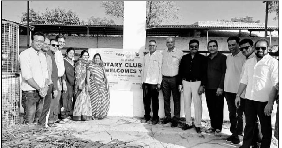
पाली की पिंजरापोल गौशाला में गौवंश को लापसी, चारा एवं कबूतरों को बाजरी, मक्की दाना खिलाया।

पाली, (निंसं)। रोटी क्लब द्वारा दीपोत्सव के अवसर पर शनिवार को शहर की विभिन्न स्वयंसेवी संस्थाओं में मीठा भोजन कराया गया।