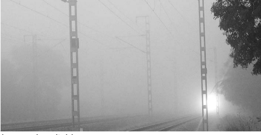
रोड पर चल रहे साधनों को हेडलाइट जलाकर चलना पड़ा।

निवाई में गुलाबी ठण्ड ने अपना असर दिखाना शुरू किया :- दीपावली के रश्मन ही गुलाबी ठण्ड ने अपना असर दिखाना शुरू कर दिया है। रात के तापमान में लगातार