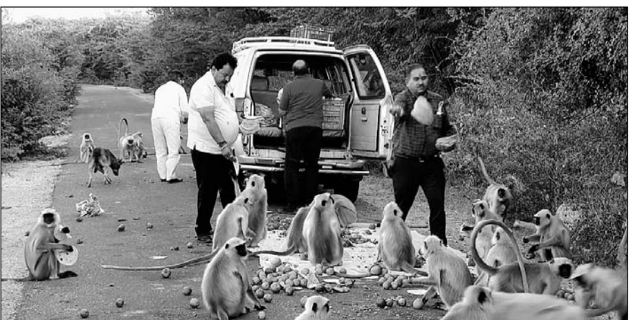
पाली जिले में जीव दया का कार्य कर रहे रोटी बैंक के सदस्यों ने बंदरों को फल, मीठा भोजन करवाया।