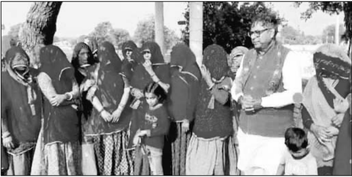
उपनेता प्रतिपक्ष डॉ. सतीश पूनियां शनिवार को जब जनसम्पर्क करने आमेर पहुंचे तो स्थानीय महिलाओं ने मंगत गीत गाकर उनका स्वागत किया।

बता दें कि आमेर विधानसभा क्षेत्र में प्रतिनी दौरे कर सघन जनसम्पर्क कर रहे सतीश