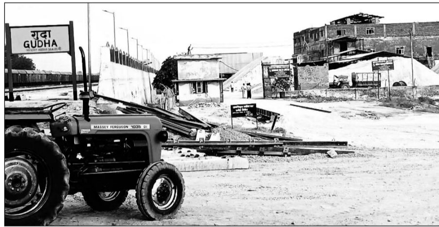
गुढ़ा में एक साल से बंद पड़ी रिफायनरी।

इसके बाद से रिफाइनरी में लगी आधुनिक तकनीक से निर्मित बॉयलर, नमक निर्माण के लिए चलने वाली विभिन्न प्रकार की मशीनें बंद पड़ी हैं। बताया गया है कि अब गांव सहित आसपास के सैंकड़ों लोगों को नई सरकारी रिफाइनरी की सौगात मिलने वाली है, लाखों रूपए की लागत से बनने वाली इस नई ईमारत का नया लुक कुछ दिनों बाद दिखने लगेगा। दिवावली के पश्चात निर्माण कार्य शुरू होने की खबर सुनकर ग्रामीणों में हर्ष की लहर है। कई दिनों से बेरोजगार हुए श्रमिकों और कर्मचारियों को रोजगार उपलब्ध हो सकेगा। बिजली आपूर्ति के