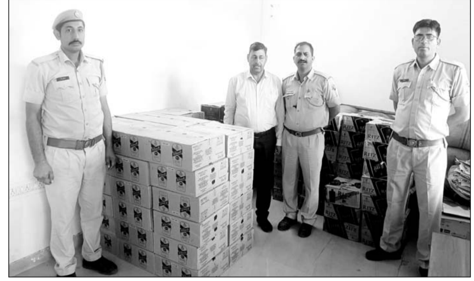
निम्बाहेड़ा थाना पुलिस ने गश्त के दौरान खेत पर बनी झोंपड़ी से अवैध अंग्रेजी शराब जब्त की।

चित्तौड़गढ़, (निर्स)। जिले की सदर निम्बाहेड़ा थाना पुलिस ने गश्त के दौरान खेत पर बनी झोंपड़ी से अवैध अंग्रेजी शराब के 96 कार्टन में भरे 4608 पक्के जप्त किये। अवैध अंग्रेजी शराब को रखने के आरोपी के बारे में जांच की जा रही है। जब्त शराब की कीमत करीब 12 लाख रुपये है।