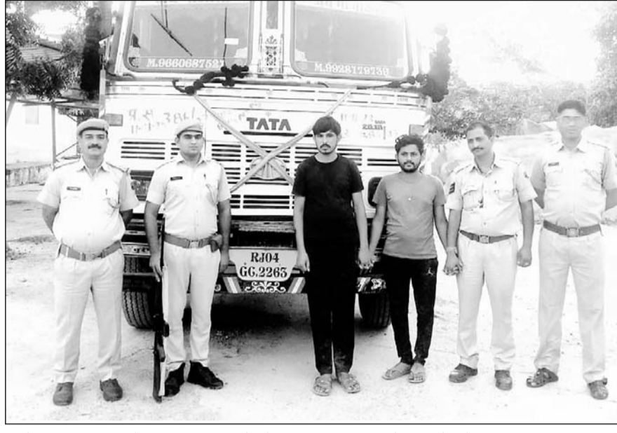
जिले की सदर निम्बाहेड़ा थाना पुलिस ने डोडा-चूरा जब्त कर दो तस्करो को गिरफ्तार किया।