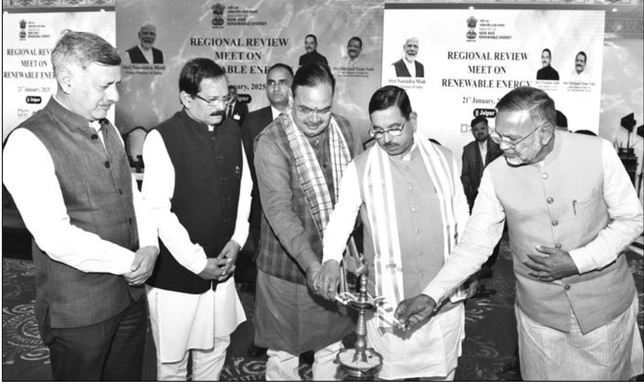
केन्द्रीय नवीकरणीय ऊर्जा मंत्री प्रहलाद जोशी, मुख्यमंत्री भजनलाल शर्मा ने नवीकरणीय ऊर्जा पर आयोजित क्षेत्रीय समीक्षा बैठक को सम्बोधित किया। इस अवसर पर केन्द्रीय नवीकरणीय ऊर्जा राज्यमंत्री श्रीपद नाइक, राजस्थान के ऊर्जा राज्य मंत्री हीरालाल नागर भी मौजूद थे।

आवश्यकता का 50 प्रतिशत पूरा करने तथा वर्ष 2070 तक देश को नेट जीरो कार्बन उत्सर्जन तक ले जाने के प्रति अपनी प्रतिबद्धता व्यक्त की है। जोशी मंगलवार को जयपुर के एक होटल में आयोजित नवीकरणीय ऊर्जा पर क्षेत्रीय समीक्षा बैठक को सम्बोधित कर रहे थे। मुख्यमंत्री ने कहा कि राज्य सरकार