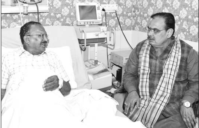
मुख्यमंत्री भजनलाल शर्मा ने मंगलवार को एस.एम.एस. अस्पताल में विधानसभा अध्यक्ष वासुदेव देवनानी से मुलाकात कर उनके शीर्ष स्वास्थ्य लाभ की कामना की।

जयपुर। मुख्यमंत्री भजनलाल शर्मा मंगलवार को एसएमएस अस्पताल पहुंचे। उन्होंने वहां विधानसभा अध्यक्ष वासुदेव देवनानी से मुलाकात कर उनकी कुशलक्षेम जानी। इस दौरान मुख्यमंत्री ने देवनानी के शीर्ष स्वास्थ्य लाभ को कामना की। देवनानी ने उन्हें स्वास्थ्य लाभ हेतु मिली अपार शुभकामनाओं के लिए सभी लोगों का आभार ज्ञापित किया है। देवनानी का हाल जानने के लिए एसएमएस अस्पताल में दिनभर जनप्रतिनिधि और आमजन का तांता लगा रहा। देवनानी ने कहा कि पटना (बिहार) में आयोजित 85वे पीठासन अधिकारियों के सम्मेलन के दौरान सोमवार 20 जनवरी को उन्हें एंथिडिटी के कारण अशहजता महसूस हुई थी। पटना में प्राथमिक उपचार के बाद सोमवार को ही सांघ विशेष विमान से जयपुर पहुंचकर सर्वाइ मानसिंह चिकित्सालय, जयपुर के वरिष्ठ एवं विशेषज्ञ चिकित्सकों द्वारा विशेष गये उपचार के दौरान उनकी सभी आवश्यक मेडिकल जांच सामान्य आई है। विधानसभाध्यक्ष ने कहा है कि अब उनके स्वास्थ्य में सुधार है। वे स्वयं को स्वस्थ महसूस