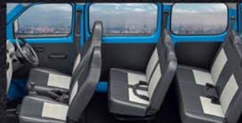
AVAILABLE IN 5 AND 7 SEATER