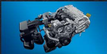
1.2L ADVANCED K-SERIES DUAL JET, DUAL VVT ENGINE