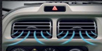
POWERFUL AIR CONDITIONER WITH HEATER