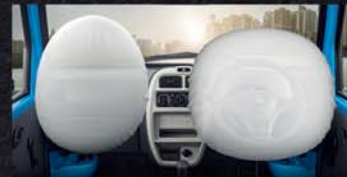
11+ SAFETY FEATURES WITH DUAL AIRBAGS