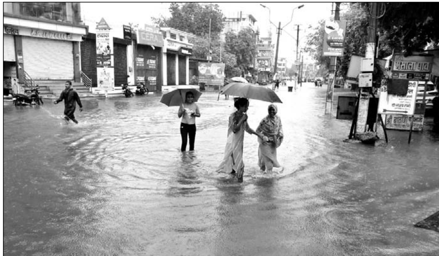
पाली जिले में रविवार देर रात शुरू हुई बारिश के बाद कई इलाकों में बाढ़ के हालात हो गये।

नया गांव स्थित सरकारी स्कूल पानी से डूब गया। स्कूल के प्रिंसिपल