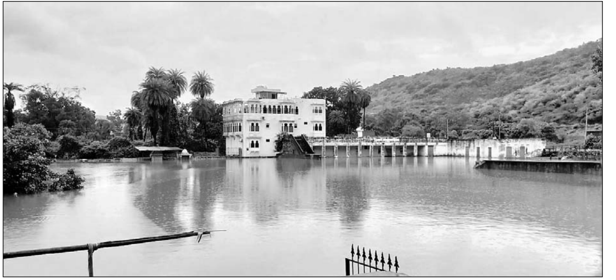
बूंदी में तेज बारिश के बाद नवल सागर झील लबालब भर गई।

प्रशासन ने नवलसागर झील पर एस.डी.आर.एफ. की टीम तैनात की