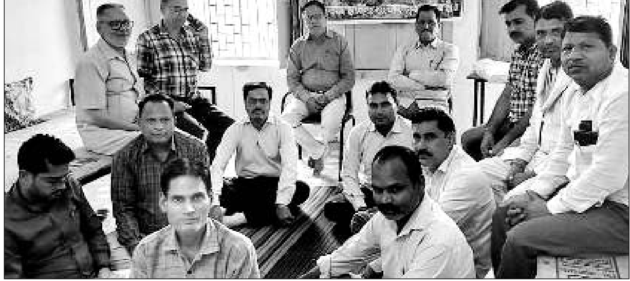
करौली जिला कार्यकारणी की बैठक मंगलवार को राजकीय उच्च माध्यमिक विद्यालय टूक यूनियन करौली में आयोजित की गई।

करौली (नि.स.)। राजस्थान शिक्षक संघ राष्ट्रीय की करौली जिला कार्यकारणी की बैठक मंगलवार को राजकीय उच्च माध्यमिक विद्यालय टूक यूनियन करौली में आयोजित की गई।