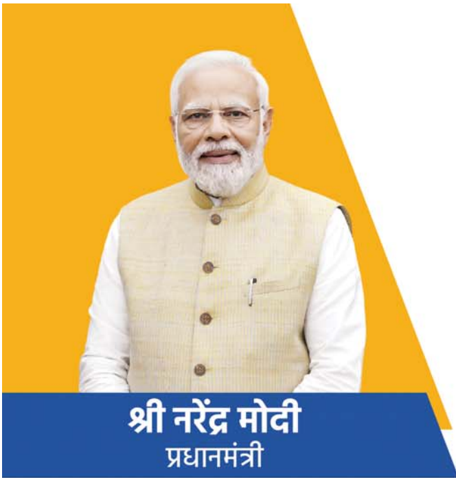
श्री नरेंद्र मोदी प्रधानमंत्री

अर्थ है ट्रम्प और हैरिस दोनों में से किसी को भी स्पष्ट जीत नहीं मिलेगी। अगर ऐसा हुआ तो अमेरिकन संविधान के बारहवें संशोधन के अनुसार हाउस ऑफ रिप्रेजेंटेटिव्स प्रतिनिधि सभा, विजेता का निर्णय करेगा। ऐसी स्थिति में एक प्रत्याशी को जीतने के लिए सदन का बहुमत (शेष अंतिम पृष्ठ पर)