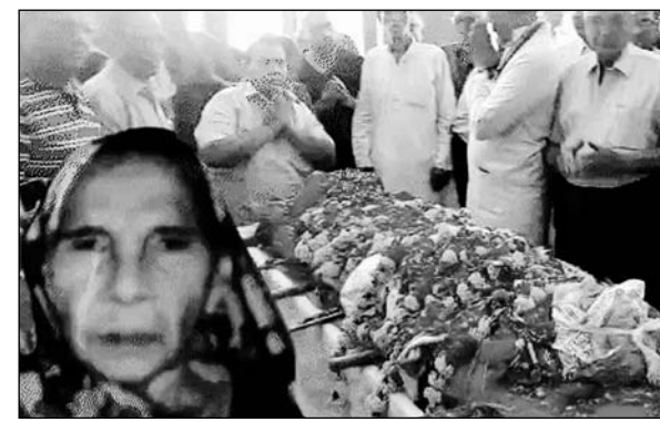
देह को मेडिकल कॉलेज प्रबंधन को सौंपते हुए तथा मां की फाइल फोटो।