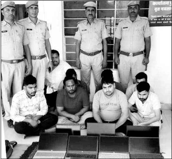
एजीटीएफ व नवलगढ़ पुलिस ने ऑनलाइन सट्टा कारोबारियों पर कार्रवाई कर आठ जनों को गिरफ्तार किया।

नवलगढ़, (निसं)। एजीटीएफ व नवलगढ़ पुलिस ने संयुक्त रूप से नवलगढ़ में ऑनलाइन सट्टा कारोबारियों पर बड़ी कार्रवाई की। पुलिस ने मौके से सट्टा सामग्री के रूप में सात लैपटॉप, 99 मोबाइल फोन, सात माउस, सात की बोर्ड, पांच फोटोन नेट कनेक्टर, आठ लेपटॉप अडेप्टर, आठ चेक बुक-पासबुक, 47 अलग-अलग बैंक के एटीएम कार्ड, एक केलकुलेटर, 13 मोबाइल चार्जर जब्त किए गए। साथ ही ऑनलाइन तीन गेमिंग एप पर आईडी से करोड़ों रुपए का लेखा-जोखा का हिसाब मिला।