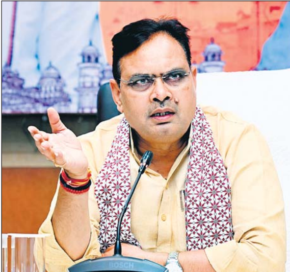
मुख्यमंत्री भजनलाल शर्मा

समिट का मुख्य उद्देश्य, शिक्षा क्षेत्र में नवाचार, डिजिटल तकनीकों का उपयोग और निवेश की संभावनाओं पर गहन चर्चा करना है। प्री-समिट की