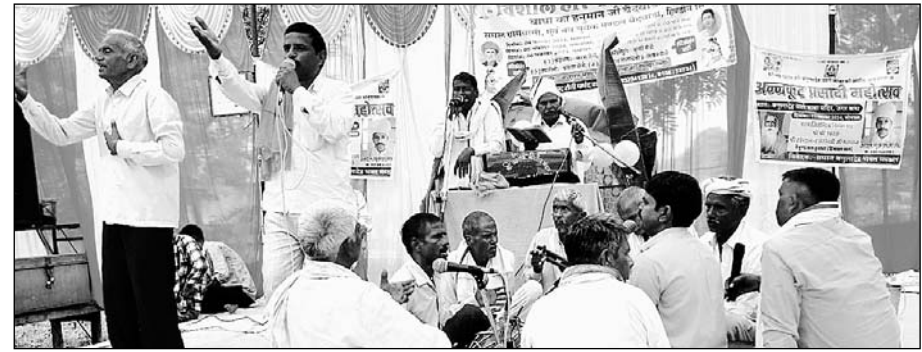
हरि कीर्तन दंगल कार्यक्रम उद्घाटन समारोह से शुरू हुआ।

हिण्डौन सिटी। विशाल हरि कीर्तन दंगल का आयोजन बाधा का हनुमान जी वैधवाडा में मंगलवार को। उद्घाटन समारोह के साथ शुरू हुआ। जानकारी के