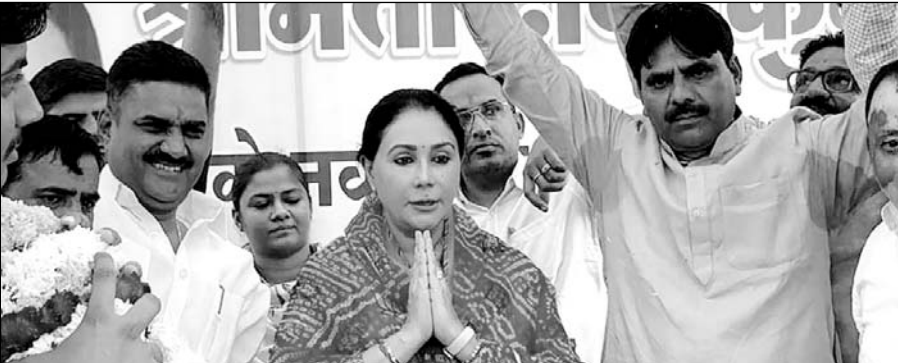
उपमुख्यमंत्री दिया कुमारी का झुंझुनू पहुंचने पर भाजपा के कार्यकर्ताओं ने स्वागत किया।

झुंझुनू। उपमुख्यमंत्री दिया कुमारी ने कांग्रेस पर हमला करते हुए कहा कि झुंझुनू विधानसभा में जनता को झूठ के अलावा कुछ नहीं मिला। दिया कुमारी चावों सती मंदिर हॉल, बगड़ में एक सभा को संबोधित कर रही थीं। दिया कुमारी ने देश के सैन्य इतिहास में झुंझुनू के बलिदान को याद करते हुए कहा कि एक सैनिक की बेटी के रूप में शेखावाटी के वीर सपूतों को श्रद्धांजलि अर्पित करती हूँ।