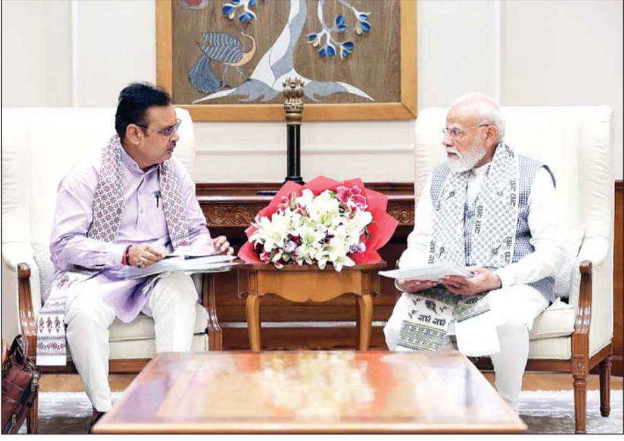
मुख्यमंत्री भजनलाल शर्मा ने सोमवार को नई दिल्ली में प्रधानमंत्री नरेन्द्र मोदी से उनके निवास पर शिष्टाचार भेंट की।

उन्होंने प्रधानमंत्री के साथ विकास, सुशासन व जन कल्याण से जुड़े विषयों पर गहन चर्चा की