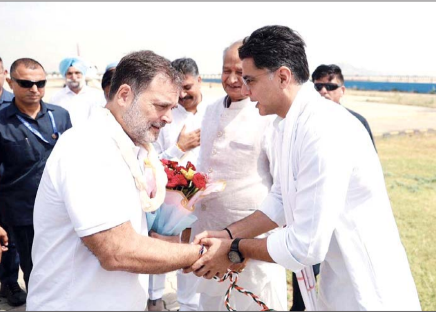
लोकसभा के नेता प्रतिपक्ष राहुल गांधी पुष्कर में नवनिर्वाचित जिलाध्यक्षों के प्रशिक्षण शिविर के समापन सत्र में पहुंचे। इस दौरान कांग्रेस महासचिव सचिन पायलट व नेता प्रतिपक्ष टीकाराम जूली ने किशनगढ़ एयरपोर्ट पर उनका स्वागत किया।

उन्होंने राजस्थान में कांग्रेस प्रदेशाध्यक्ष गोविंद सिंह डोटासरा और नेता प्रतिपक्ष टीकाराम जूली की जोड़ी को "जय-वीरू" की जोड़ी जैसी बताते हुए तारीफ की। उन्होंने कहा कि यह