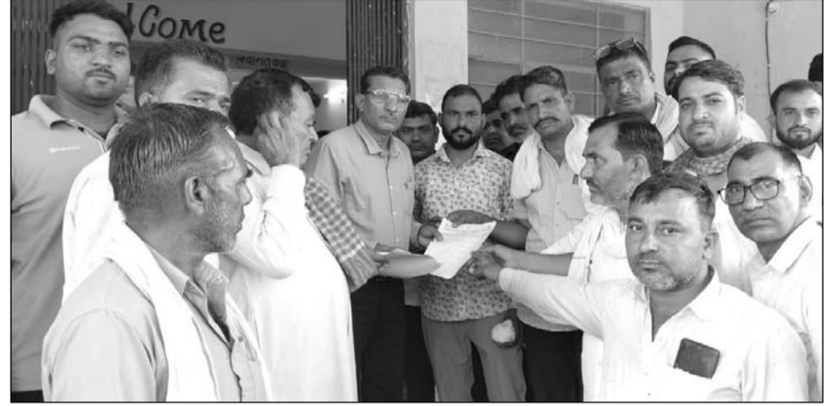
ग्रामीणों ने मुख्यमंत्री के नाम तहसीलदार को ज्ञापन सौंपकर शीघ्र समस्या समाधान की मांग की।

राजलदेसर, (निसं)। राजलदेसर कस्बे के निकटवर्ती ग्राम पंचायत बिनादेसर में दो वर्ष से जारी पेयजल संकट को लेकर सोमवार को ग्रामीणों और किसानों का आक्रोश खुलकर सामने आया। लंबे समय से पानी की समस्या से जूझ रहे ग्रामीणों ने तहसील कार्यालय पहुंचकर प्रदर्शन किया और मुख्यमंत्री के नाम तहसीलदार को ज्ञापन सौंपकर शीघ्र समस्या समाधान की मांग की।