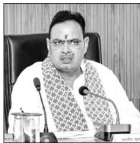
मुख्यमंत्री भजनलाल शर्मा

विशेषज्ञों का मानना है कि इन परियोजनाओं के पूरा होने के बाद राजस्थान निवेश, उद्योग, पर्यटन और व्यापार के क्षेत्र में देश के अग्रणी राज्यों में शामिल हो सकता है।