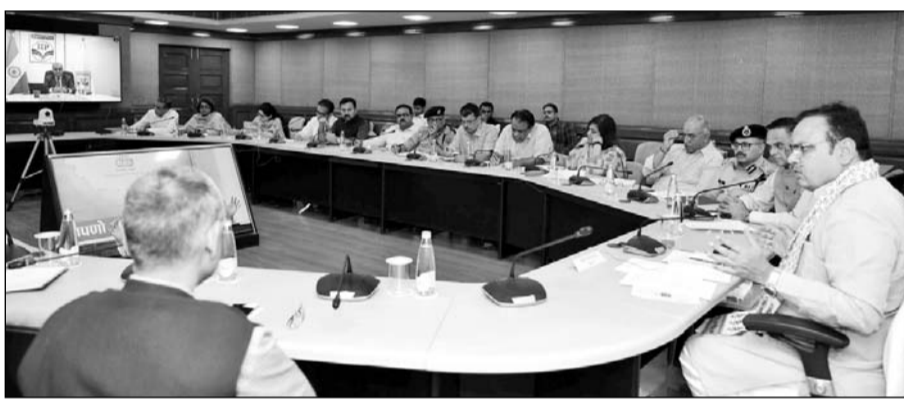
मुख्यमंत्री भजनलाल शर्मा ने पीएम मोदी के दौरे को लेकर बैठक ली और अधिकारियों को निर्देश दिये।

मुख्यमंत्री ने आयोजन स्थल पर आगंतुकों के बैठने की व्यवस्था, पौष्टिक, चिकित्सा, विद्युत आपूर्ति, पार्किंग, यातायात, सुरक्षा सहित अन्य महत्वपूर्ण व्यवस्थाओं के लिए अधिकारियों को निर्देश दिए। उन्होंने ने कहा कि एचआरआरएल रिफाइनी में पेट्रोल और डीजल के साथ-साथ