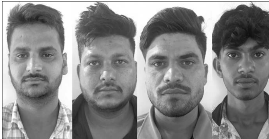
बरोनी पुलिस ने अपहरण करने के आरोपियों को गिरफ्तार किया।