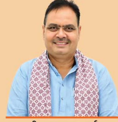
श्री भजनलाल शर्मा माननीय मुख्यमंत्री