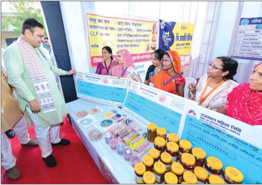
मुख्यमंत्री भजनलाल शर्मा ने शुक्रवार को भीलवाड़ा के खारी का लाम्बा गाँव में ग्राम विकास चौपाल कार्यक्रम में भाग लिया। इस अवसर पर उन्होंने विभिन्न योजनाओं के लाभार्थियों को चैक सौंपे।

मुख्यमंत्री ने कहा कि लखपति दीदी योजना से महिलाएं आर्थिक रूप से सशक्त और सक्षम बन रही हैं। हमारी सरकार ने इस योजना में ऋण सीमा बढ़ाकर डेढ़ लाख रुपये एवं ब्याज घटाकर 1.5 प्रतिशत किया है। उन्होंने कहा कि प्रधानमंत्री ने लोकसभा और विधानसभाओं में महिला प्रतिनिधित्व के लिए नारी शक्ति बंदन अधिनियम जैसा महत्वपूर्ण कदम उठाया है। इससे पहले, मुख्यमंत्री ने चौपाल