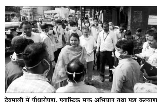
देवमाली में पौधारोपण, प्लास्टिक मुक्त अभियान तथा पशु कल्याण गतिविधियों का आयोजन किया