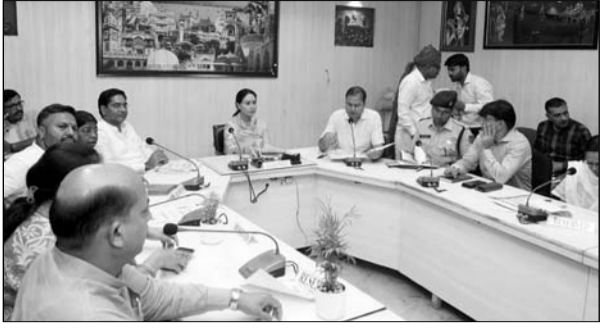
उप मुख्यमंत्री एवं जिले की प्रभारी मंत्री दिया कुमारी की अध्यक्षता में शुक्रवार को जिला स्तरीय समीक्षा बैठक आयोजित हुई।