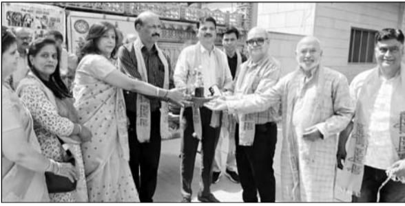
कार्यक्रम के तहत कीर्ति स्तंभ के बाहर राहगीरों को पक्षियों के लिए पर्रिडे व पौधे वितरित किए।

अजमेर, (कासं)। विश्व पर्यावरण दिवस के अवसर पर जैन मिलन आदिवास्य द्वारा पर्यावरण संरक्षण एवं जीव दया को समर्पित कार्यक्रम आयोजित किया गया। कार्यक्रम के तहत फव्वारा सफाई स्थित कीर्ति स्तंभ के बाहर राहगीरों को पक्षियों के लिए पर्रिडे तथा पौधे वितरित किए गए और पर्यावरण संरक्षण की शपथ दिलाई गई। कार्यक्रम में टीटी कॉलेज के प्राध्यापक