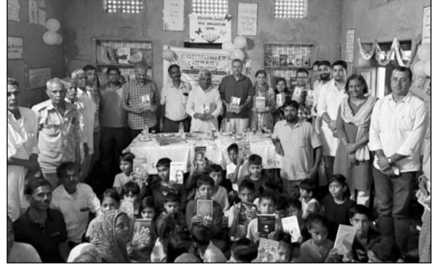
राजस्थान केंद्रीय विश्वविद्यालय का बांदरसिंदरी स्थित रेगर समुदाय में सामुदायिक पुस्तकालय का शुभारंभ किया।