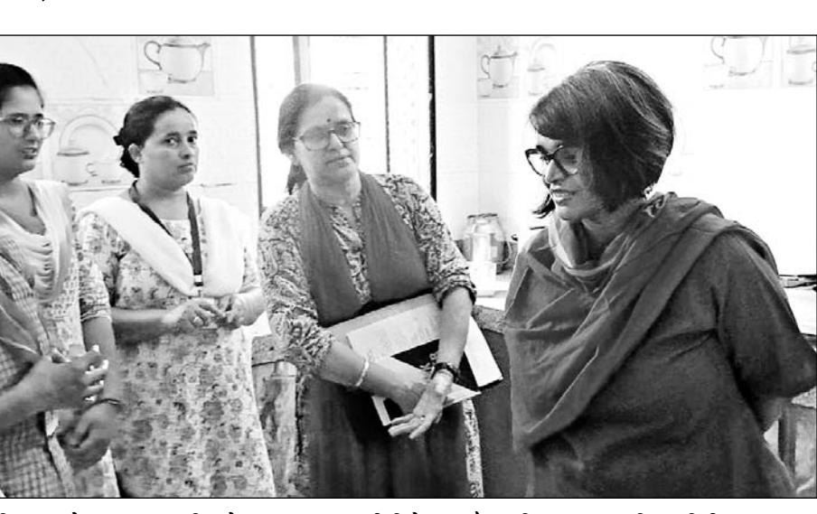
जिला कलेक्टर नम्रता वृष्णि ने उड़ान सदन, नारी निकेतन और बालिका गृह का किया निरीक्षण

बीकानेर, (कासं)। जिला कलेक्टर नम्रता वृष्णि ने मंगलवार को नारी निकेतन, बालिका गृह एवं उड़ान सदन का निरीक्षण किया। उन्होंने उड़ान सदन में माफ-सफाई, भोजन, रक्षक, अध्ययन सामग्री, मनोरंजन कक्ष सहित अन्य व्यवस्थाओं का जायजा लिया। उन्होंने यहां स्वच्छ एवं गरम जैसा वातावरण बनाए रखने को कहा, जिससे बालिकाओं की बैठक ली।