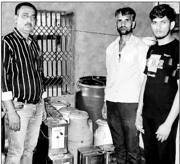
जालौर शहर के निकट सारणेश्वर डेयरी पर खाद्य सुरक्षा टीम ने दुध व घी के सेम्पल भरे गये।