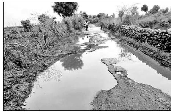
छबड़ा से कडैयानोहर को जोड़ने वाली संपर्क सड़क का हाल खस्ता होने के कारण लोग जान जोखिम में डालकर वाहन चलाने को मजबूर हैं।

स्कूल आने-जाने वाले बच्चों को परेशानी:- ग्रामीणों के अनुसार बारिश के सीजन में स्कूल आते-जाते समय इस क्षतिग्रस्त सड़क से गुजरने वाले विद्यार्थी कीचड़ में फिसल कर अनेकों बार गिर चुके हैं। उनकी न्यूनीफार्म तक खराब हो जाती है। मार्ग में पानी जमा होने व दलदल की वजह से विद्यार्थी स्कूल नहीं जा पाते, जिससे उनकी