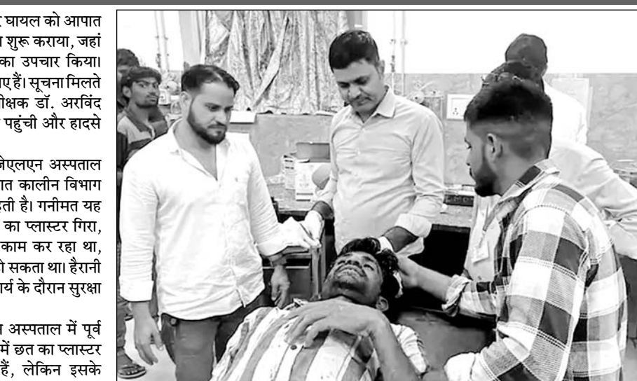
घायल मजदूर का इलाज करते चिकित्सक।

मालूम है कि जेएलएन अस्पताल में पूर्व में भी कई वाडों सहित पोच में छत का प्लास्टर गिरने से हादसे हो चुके हैं, लेकिन इसके बावजूद भी अस्पताल प्रशासन ने अभी तक कोई सुध नहीं ली है।