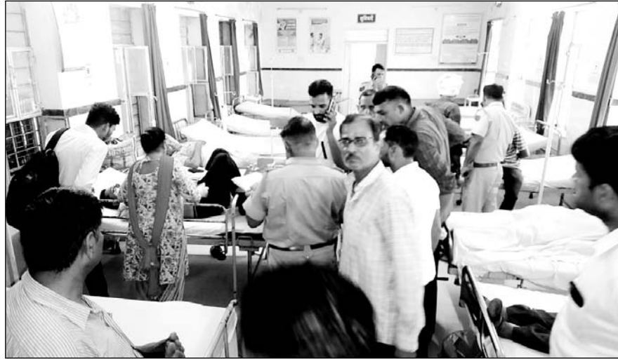
कानरपुरा बस स्टैंड पर हुए हादसे में घायलों को कालाडेर सामुदायिक स्वास्थ्य केंद्र में भर्ती कराया।