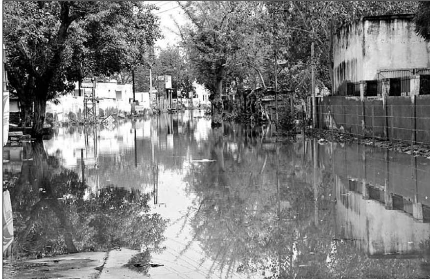
चूरु शहर में डाक बंगले के पास टाऊन हॉल की गली में बारिश के पानी ने नदी का रूप धारण कर लिया जिससे लोगों को अपने घरों से बाहर निकलना मुश्किल हो गया।

जानकारी के अनुसार सोमवार शाम को बारिश का दौर शुरू हुआ जो कि करीब एक घंटे तक चला। इसके बाद रात को करीब नौ बजे फिर से बारिश का दौर शुरू हुआ जो कि रातभर रुक रुक कर चलता रहा। रिमझिम बारिश के कारण मौसम सुहावना हो गया। लोगों को भयंकर गर्मी से निजात भी मिल गयी और किसानों के चेहरे खिल उठे। लेकिन शहरवासियों के लिए बारिश परेशानी का सबब बन गई जहां पर पानी भरवाव की समस्या आज से नहीं बरसों से चली आ रही है। बारिश के कारण मुख्य बाजार सुभाष चौक, झारिया मोरी, नेत्र चिकित्सालय, राजकीय भारतीय अस्पताल, डाक बंगले के पास, पंचायत समिति, चांदनी चौक आदि अनेक स्थानों पर पानी भर गया। जिससे लोगों को काफी परेशानी का सामना करना पड़ रहा है।