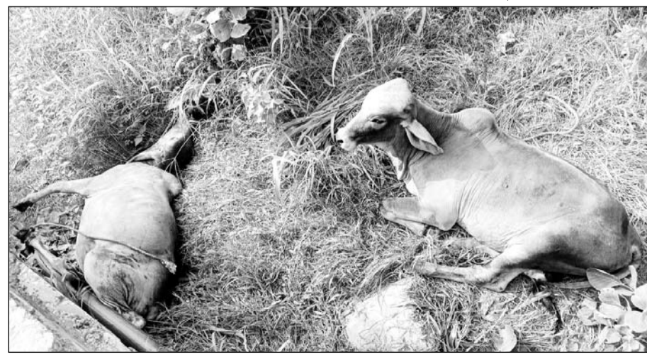
शक्करगढ़ थाना क्षेत्र के बाकरा गांव में गोवंश से भरी हुई पिकअप मिला।