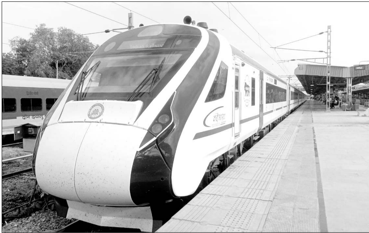
वंदे भारत ट्रेन शुक्रवार को उदयपुर पहुंची। इस ट्रेन को उदयपुर सिटी रेलवे स्टेशन पर लाकर ट्रेक नं. 5 पर खड़ा किया गया।

इस ट्रेन के उदयपुर से जयपुर (दुर्गापुरा) के बीच चलने की संभावना है। हालांकि इसका रूट अजमेर उदयपुर से कोटा, सवाईमाधोपुर