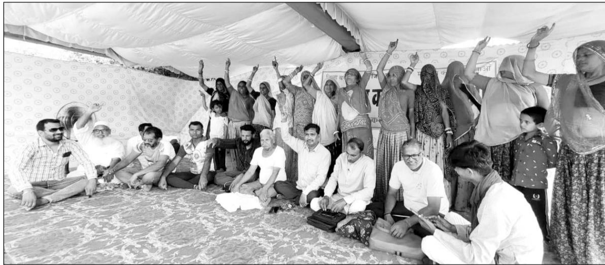
मालपुरा को जिला बनाने की मांग को लेकर 142वें दिन भी धरना व अनशन जारी रहा।

मालपुरा को नवीन जिलों में शामिल नहीं करना कांग्रेसियों के लिए गले की फांस बनी