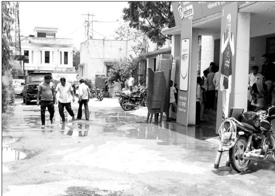
जालोर नगरपरिषद में गंदा पानी बहने से लोगों को परेशानी का सामना करना पड़ रहा है।

जालोर नगरपरिषद में कई पद रिक्त होने के साथ परिषद में कोई धणी धोरी नहीं होने से कार्मिक भी अपनी अपनी मर्जी से कार्य करते नजर आ रहे हैं। ऐसे में परिषद में कार्य करवाने आने वाले लोगों को काफी परेशानी का सामना करना पड़ता है। शुक्रवार को दूसरे दिन इंदिरा गांधी स्मार्ट फोन लेने के लिए महिलाओं की भीड़ परिषद में काफी नजर आई। ऐसे में परिषद के बाहर घुप में महिलाएँ फोन के लिए परेशान होती देखी गईं। वहीं परिषद में गंदा पानी बहने से लोगों को काफी परेशानी का सामना करना पड़ा। जिसका शहर की सफाई का जिम्मा दिया हुआ है। उस कार्यालय में स्वयं