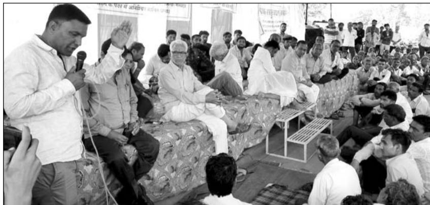
माण्डलगढ़ की शाहपुरा जिले में शामिल हुई पंचायतों के ग्रामीणों ने दूसरे दिन भी धरना जारी रखा।

माण्डलगढ़ उपखण्ड की 5 ग्राम पंचायतों के ग्रामीण परनाथी भीलवाड़ा जिले में ही रहने की मांग पर अड़े हैं। नव सृजित शाहपुरा जिले में कर्तई नहीं रहना चाहते हैं। गौरतलब है कि गत दिनों सरकार के गजट नोटिफिकेशन में माण्डलगढ़ उपखण्ड की 15 पंचायतों को शाहपुरा में शामिल किया गया है। उसी को लेकर ग्रामीणों में आक्रोश भड़का हुआ है। माण्डलगढ़ उपखण्ड कार्यालय के बाहर पंचायत बचाओ संघर्ष समिति मानपुरा के तलाधान में आयोजित धरना प्रदर्शन गुब्बार से शुरू किया गया। शुक्रवार को महुआ, दौलपुरा, रलायता, मानपुरा व धामनिया ग्राम पंचायतों के सरपंच