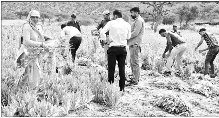
परबतसर पुलिस ने खेत में की जा रही अफीम की खेती को जब्त किया।

बताया कि पुलिस मुख्यालय के निर्देशानुसार नशे की वस्तुओं के खिलाफ लगातार अभियान चलाया जा रहा है। इसी क्रम में पुलिस को सूचना मिली थी कि परबतसर थाना क्षेत्र के बांसड़ा गांव में पहाड़ी की तलहटी में अवैध रूप से अफीम की फसल बोई