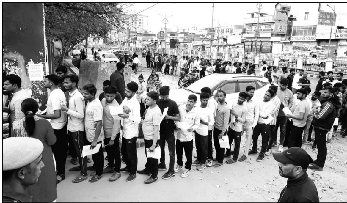
राजस्थान अध्यापक पात्रता परीक्षा रीट 2024 गुरुवार को दो पारियों में आयोजित की गई। परीक्षा सेंटर पर पहुंचने में स्टूडेंट्स को बहुत परेशानी का सामना पड़ा क्योंकि सहर की सड़कें विकास कार्यों के चलते इतर तरफ खोद के छोड़ दी गई हैं। एर्रामा शुरू होने से एक घण्टे पहले एंटी बंद करने से कुछ भागकर पहुंचे तो कुछ रह गए। लंबी लाइन भी लगी।