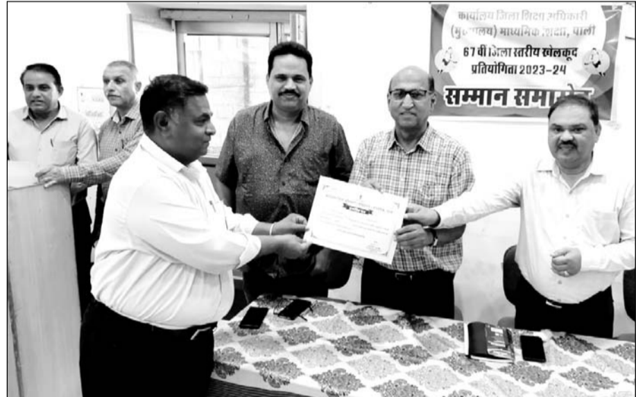
पाली में विद्यालयी छात्र-छात्रा खेलकूद प्रति. में सहयोगी रहे लोगों का सम्मान किया।

पाली, (नि.सं.)। शिक्षा विभाग की ओर से आयोजित 67 वीं जिला स्तरीय विद्यालयी छात्र-छात्रा खेलकूद प्रतियोगिता में सहयोग करने वाले संस्था प्रधानों एवं व्यवस्थापकों का बुधवार को श्री बांगड राजकीय उच्च माध्यमिक विद्यालय में प्रशस्ति पत्र देकर सम्मानित किया गया।