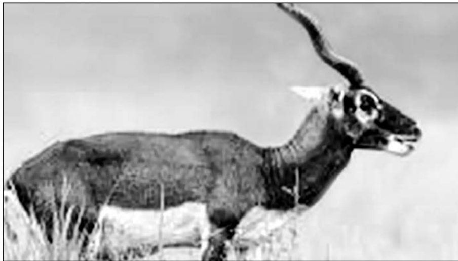
हनुमानगढ़ में वन भूमि में विचरण करते हिरण।