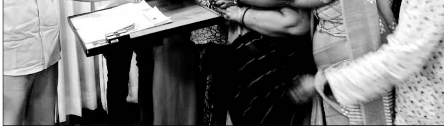
आंगनबाड़ी कर्मचारी संघ भीलवाड़ा ने जिला कलेक्टर को ज्ञापन दिया।