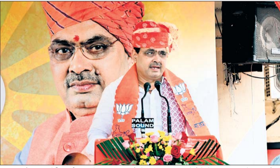
जापान और उत्तर कोरिया की यात्रा के बाद वापस लौटने पर जयपुर एयरपोर्ट से लेकर भाजपा प्रदेश कार्यालय तक मुख्यमंत्री भजनलाल शर्मा का भव्य स्वागत किया गया। भाजपा प्रदेश मुख्यालय में मुख्यमंत्री ने कार्यकर्ताओं को संबोधित करते हुए कहा, जापान के निवेशकों ने राजस्थान में निवेश के विषय में बहुत ही पॉजिटिव प्रतिक्रिया दी है।

और भाजपा कार्यकर्ताओं ने ढोल नगादों, बैंड-बाजों के साथ पुष्प वर्षा के बीच भाजपा प्रदेश कार्यालय में मुख्यमंत्री भजनलाल शर्मा का अभिमान किया। भाजपा के कार्यकर्ताओं का अपार प्रेम, स्नेह और भरोसा देखते हुए मुख्यमंत्री भजनलाल शर्मा ने सभी को धन्यवाद देते हुए यह विश्वास दिलाया कि भाजपा की सरकार प्रदेश के विकास की दिशा में नए आयाम