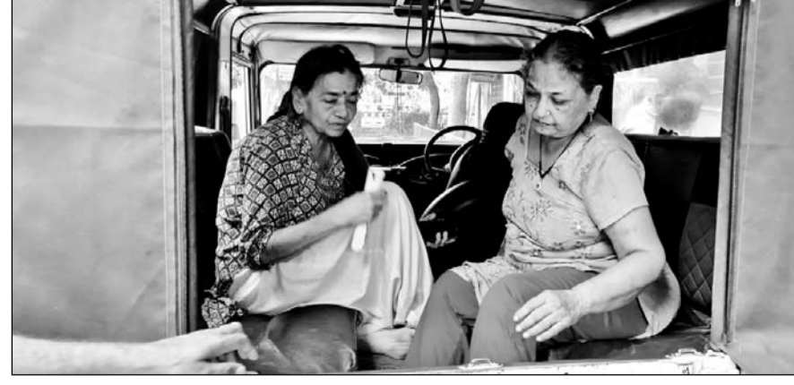
पुलिस ने दोनों महिलाओं को बदमाशों के चंगुल से छुड़वाया।

जानकारी के अनुसार गाड़ी में सवार दो बदमाश मौके का फायदा उठाकर भाग छुटे, जबकि एक बदमाश पुलिस के हाथ लग गया। पुलिस ने उस एक बदमाश को हिरासत में लेकर