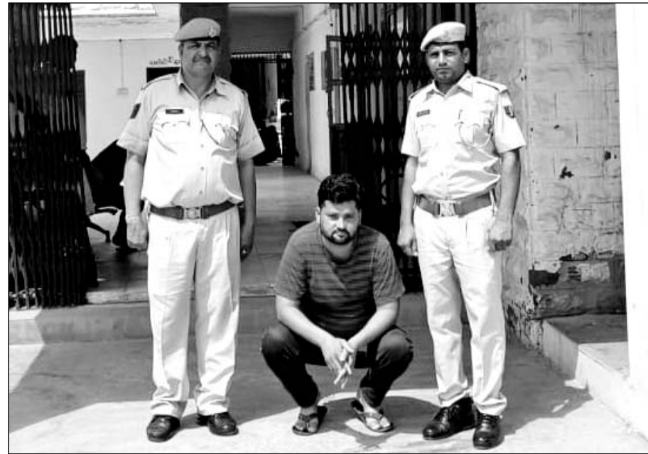
पुलिस ने विधवा महिला को स्लो पॉइजन देने के मामले में आरोपी को गिरफ्तार किया।