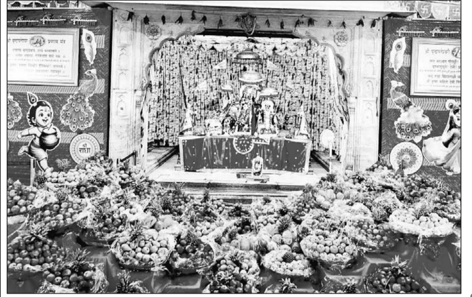
जयपुर के आराध्य देव गोविंददेवजी मंदिर में ठाकुरजी को 1100 किलो फलों का भोग लगाया गया। फलों में विशेष रूप से सेव, नाशपती, पपीता, अनार, अन्नानास व अंगूर शामिल थे।

उपमुख्यमंत्री ने कहा "हिन्दी सिर्फ एक भाषा या विषय नहीं बल्कि हमारी पहचान है, भावों की अभिव्यक्ति है"