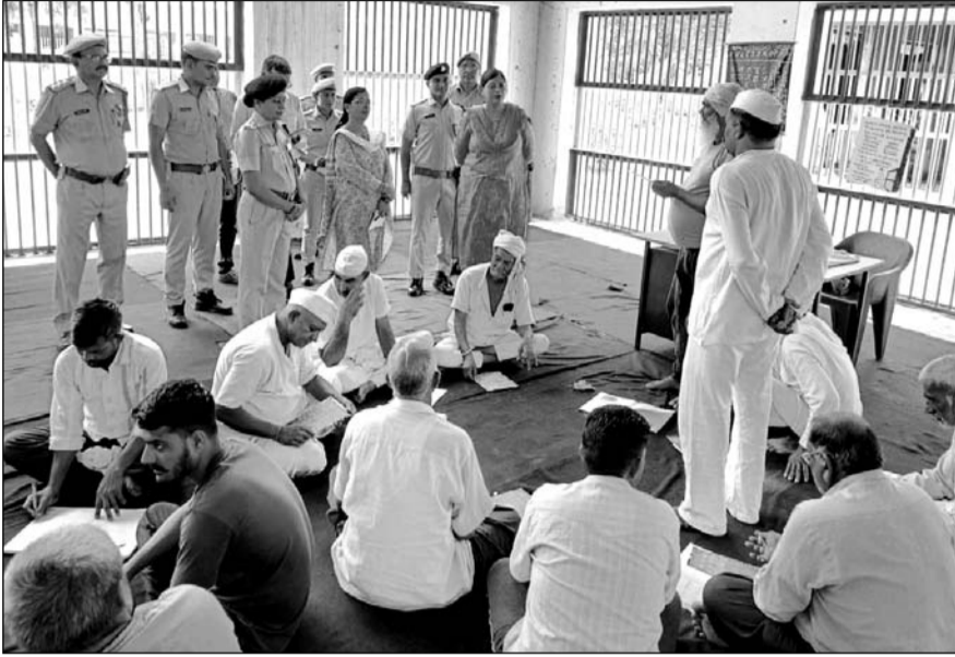
सेंट्रल जेल निरीक्षण करने पहुंची जिला कलेक्टर डॉ. दीक्षित ने बंदियों से चर्चा की।

अजमेर जिला कलेक्टर भारती दीक्षित गुरुवार को सेंट्रल जेल पहुंची, जहां जेल स्टाफ ने गार्ड ऑफ ऑनर दिया। जिला कलेक्टर डॉ. दीक्षित को जेल अधीक्षक सुमन मालीवाल ने जेल की व्यवस्थाओं से अवगत कराया और जेल की सुरक्षा व्यवस्था और जेल में हुए नवाचार को लेकर चर्चा कर जायजा लिया। जेल निरीक्षण के दौरान जिला कलेक्टर भारती दीक्षित ने जेल अधीक्षक मालीवाल द्वारा किए गए बेहतर नवाचारों जिसमें जेल बैंड, पढ़ाई जैसी कई नवाचार जेल में हुए हैं उनकी सराहना भी की। कलेक्टर डॉ. दीक्षित जेल अधीक्षक मालीवाल को जेल में सुविधाओं को बेहतर करने