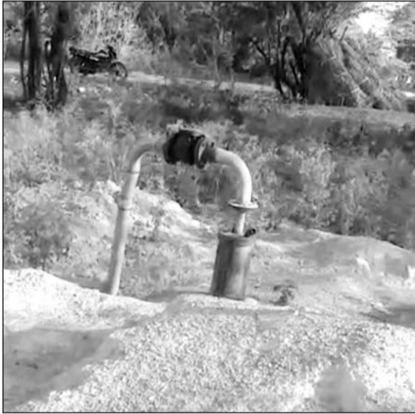
एक साल से विद्युत कनेक्शन के अभाव में खराब पड़ा बोर।

मौजूदगी में कनेक्शन करने पहुंचा परंतु विद्युत विभाग कनेक्शन नहीं कर पाया। मात्र कनेक्शन के अभाव में गांव में पेयजल संकट बना हुआ है और लोगों को मजबूरन महंगे दामों में टैकरो का पानी मंगवा कर अपनी पेयजल आपूर्ति करनी पड़ रही है। स्थानीय प्रशासन कुंभकर्णी नौद सो रहा है और जनता पानी के लिए त्राहि त्राहि कर रही है। लगभग एक साल बीतने को है उसके बावजूद भी विद्युत विभाग कनेक्शन नहीं कर सका जिसको लेकर लोगों में स्थानीय विधायक के खिलाफ सवालिया निशान पैदा कर रहा है।