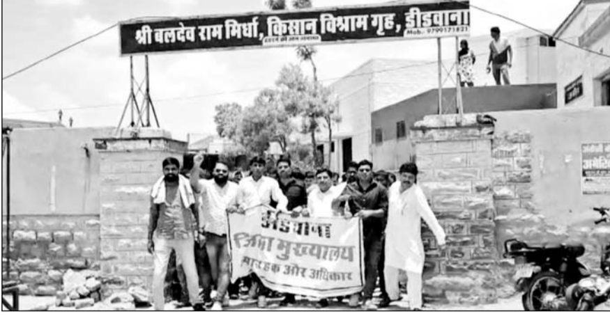
जिला मुख्यालय बनाने की मांग को लेकर डीडवाना में रैली निकाली।

ज्ञापन में संघर्ष समिति ने बताया कि डीडवाना जिले के सभी मापदंड और नियमों को पूरा करता है।