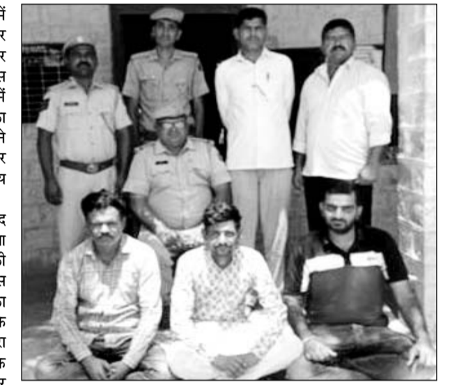
जैसलमेर पुलिस ने बालिका का अपहरण करने वाले आरोपियों को गिरफ्तार किया।