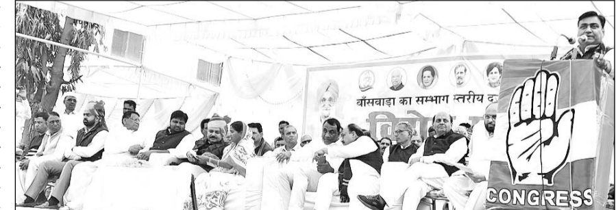
बांसवाड़ा को संभाग का दर्जा खत्म किये जाने को लेकर धरना प्रदर्शन कार्यक्रम आयोजित हुआ।

उन्होंने कहा कि आने वाले विधानसभा सत्र में हम लोग सरकार को छठी का दूध याद दिला देंगे। उन्होंने आने वाले पंचायत और नगर पालिका चुनाने के लिये कमर कसने का आवाहन किया और कहा कि राजीव गांधी ने पंचायत चुनाव के लिये 90 लाख साल में चुनाव का कानून बना दिया था, लेकिन ये लोग संविधान को