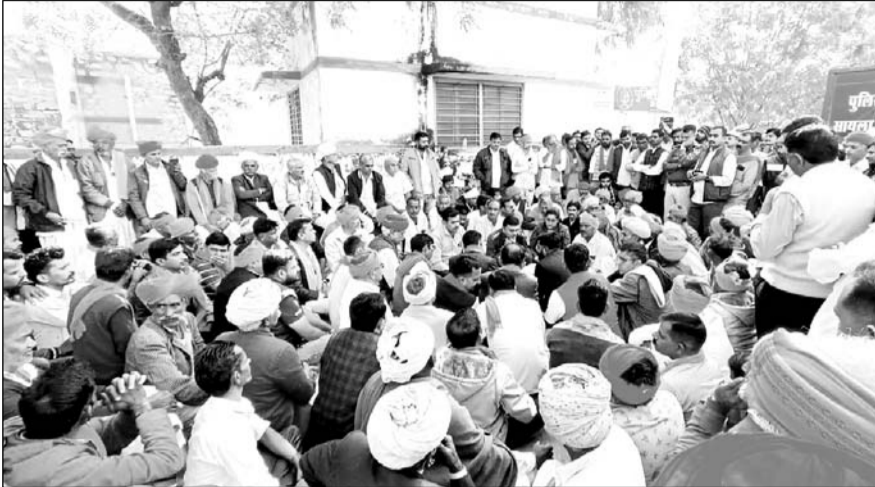
मांगों को लेकर परिजनों व समाज के लोगों ने थाने के बाहर धरना दिया।