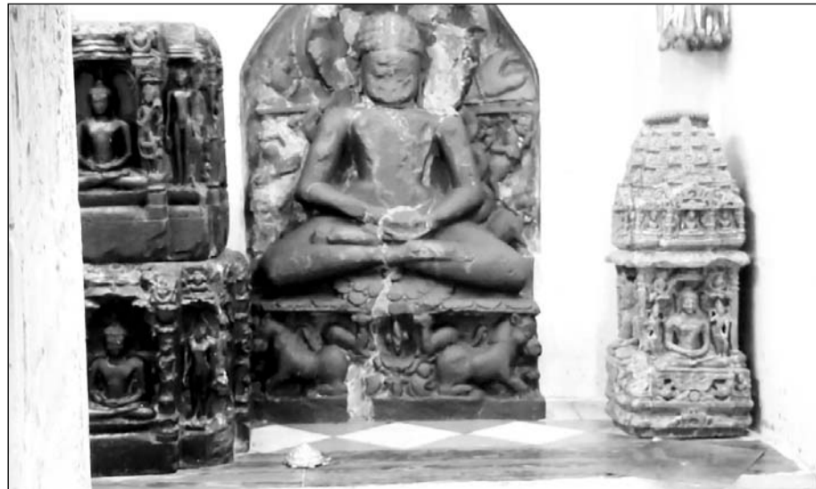
काछोला क्षेत्र स्थित श्री चंवलेश्वर पार्वनाथाय दिगम्बर जैन अतिशय तीर्थ क्षेत्र में चोरी की वारदात हुई।

धीलवाड़ा, (निर्स)। जिले के काछोला थाना क्षेत्र स्थित श्री चंवलेश्वर पार्वनाथाय दिगम्बर जैन अतिशय तीर्थ क्षेत्र में बीती रात चोरों ने चोरी की वारदात को अंजाम दिया, जिसे लेकर समाज में भारी रोष है।