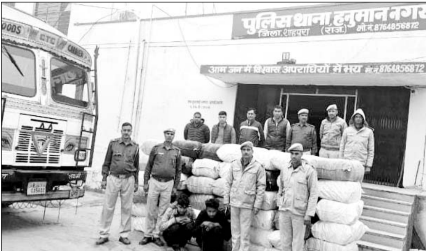
हनुमान नगर थाना पुलिस ने करोड़ों का गांजा बरामद कर तस्करों को गिरफ्तार किया।