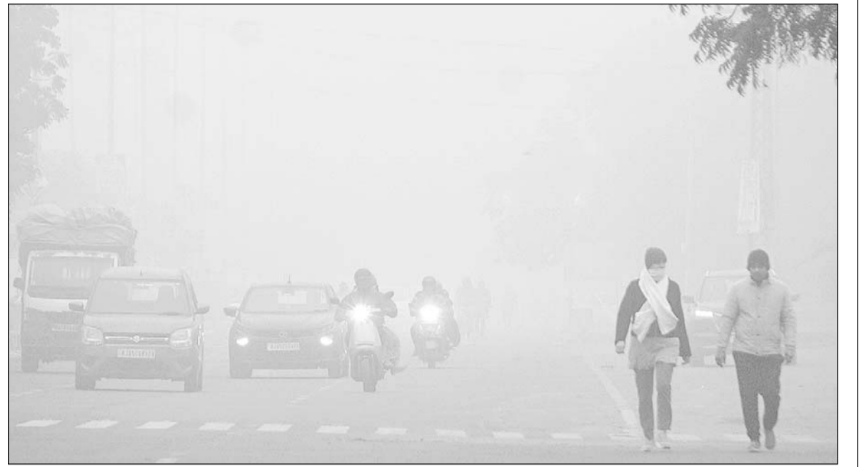
मौसम विभाग ने सोमवार को जयपुर सहित प्रदेश के कई जिलों में कोहरे का ऑरेंज अलर्ट जारी किया था जिसका जयपुर में भारी असर दिखाई दिया। कोहरे के कारण वाहनों की लाइट जलाने के बाद भी विजिलिबिलिटी बहुत कम होने से वाहन रेंग-रेंग कर चलते नजर आये।

संबंध में निर्णय लेने के लिए दो सप्ताह का समय दिया था, लेकिन अब छह सप्ताह बाद भी राज्य सरकार का जवाब नहीं आया है। इसके जवाब में महाधिवक्ता ने कहा कि भर्ती को लेकर बड़े स्तर पर विचार विमर्श चल रहा है, और जवाब के लिए समय दिया जाए। अदालत ने राज्य सरकार को दो दिन का समय देते हुए सुनवाई 9 जनवरी को तय की है। सुनवाई के दौरान अदालत ने यह भी कहा कि महाधिवक्ता जब भर्ती को रद्द करने की राय दे चुके हैं तो मामले में पैरवी कैसे कर सकते हैं। वहीं प्रार्थियों के अधिवक्ता हरेन्द्र नील ने कहा कि पुलिस विभाग ने भर्ती पर यथास्थिति आदेश के बाद भी 31 दिसंबर को आदेश जारी कर ट्रेनी एसआई को प्रैक्टिकल ट्रेनिंग के लिए जिला आवंटित करने के लिए कहा है। यह आदेश अदालती अवमानना है। मूल याचिका में पूरी भर्ती को ही रद्द करने का आग्रह किया है। सरकार ने अदालत के समय देने के बाद भी भर्ती को लेकर अपनी स्थिति नहीं बताई और ट्रेनी एसआई को फोल्ड पोस्टिंग में भेज रहे हैं जो गलत है।