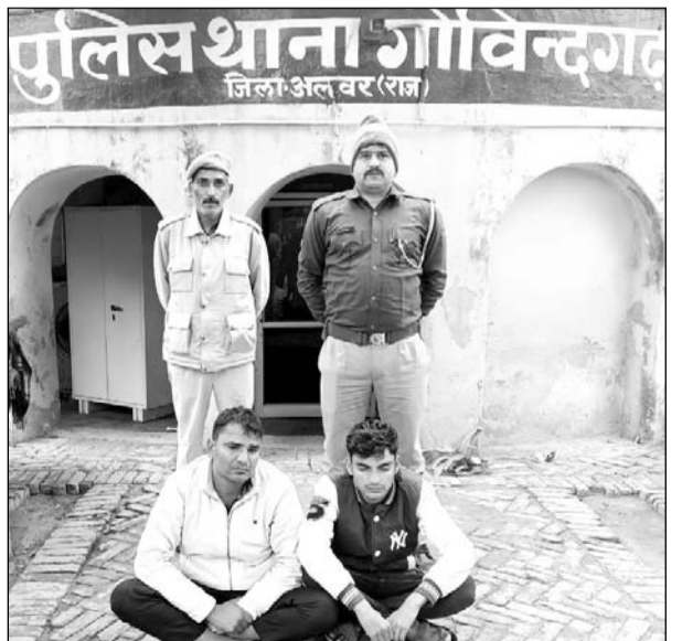
पुलिस ने ठगी के आरोपियों को गिरफ्तार किया।

गोविंदगढ़/अलवर, (निर्स)। गोविंदगढ़ थाना पुलिस ने ऑपरेशन एंटीवैबिजनेस अभियान के तहत दो आरोपियों को गिरफ्तार किया है एवं दो मोबाइल जप्त किये हैं। गोविंदगढ़ थाना पुलिस टीम द्वारा ऑनलाइन ठगी सेक्टर ऑप्लेक्स आदि फ्रॉड के विरुद्ध चलाए जा रहे अभियान एंटीवैबिजनेस के तहत गांव शाकीपुर में दबिश देकर विभिन्न